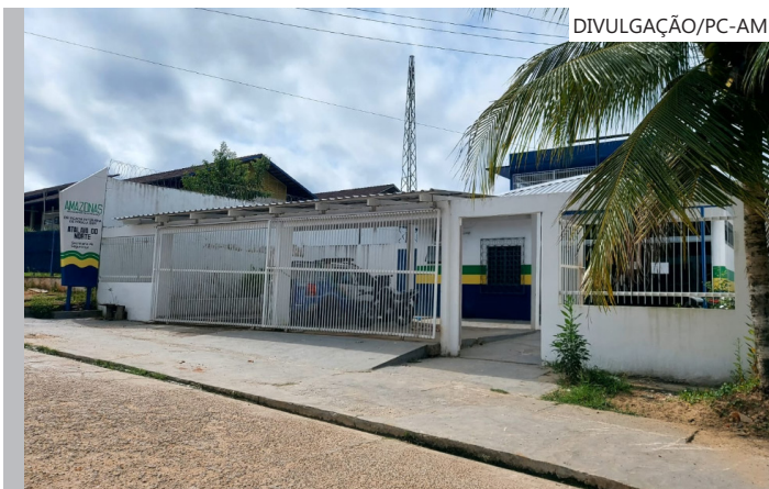
O suspeito já tinha denúncias por importunação sexual e dano qualificado

Ainda segundo o delegado, diante da gravidade dos fatos e da reiteração das condutas criminosas, foi representada pela prisão preventiva do autor, a qual foi analisada e deferida pelo Poder Judiciário.