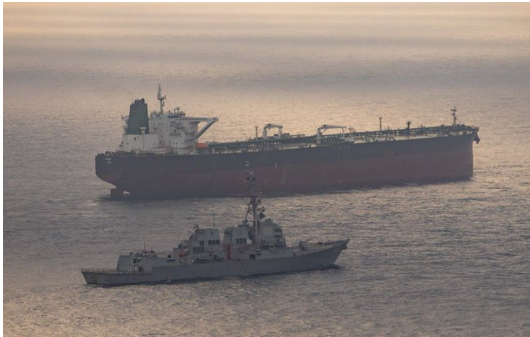
Destróier de mísseis guiados USS Rafael Peralta e de um navio com bandeira iraniana tentando navegar até um porto no Irã na sexta-feira (24)

Trump, por ora, está se aprofundando em uma estratégia destinada a causar o máximo de prejuízo econômico possível ao Irã, na esperança de forçar Teerã