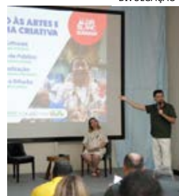
O Edital Território Criativo se destaca por seu caráter estruturante