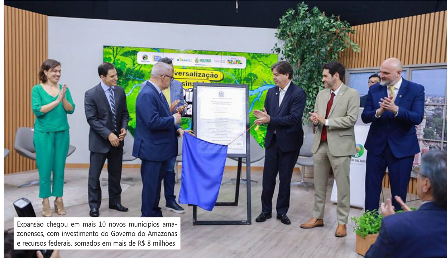
Expansão chegou em mais 10 novos municípios amazonenses, com investimento do Governo do Amazonas e recursos federais, somados em mais de R$ 8 milhões

Durante a cerimônia, o ministro das Comunicações, Frederico de Siqueira Filho, ressaltou o investimento na