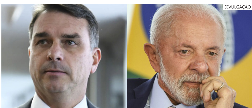
O senador Flávio Bolsonaro (à esquerda) e o presidente Luiz Inácio Lula da Silva (à direita)