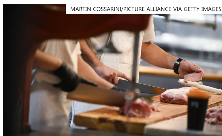
Iniciativa de produtor chamou atenção, mas jumentos não são consumidos como alimento no país

No último ano, o custo da carne bovina disparou. Os diferentes cortes encareceram, em média, 68,6% em Buenos Aires, Rosário e Córdoba, de acordo com o Ipcva (Instituto de Promoção da Carne Bovina da Argentina).