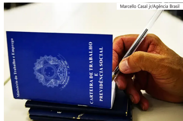
Apenas o setor agropecuário apresentou saldo negativo de empregos no mês; salário médio real de admissão no mês de março foi de R$ 2.350,83