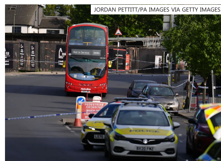
Vítimas foram esfaqueadas por um homem na zona norte da cidade; grupo Harakat Ashab al-Yamin al-Islamiyya clamou a autoria

O governo prometeu fornecer mais recursos em todo o país para proteger as comunidades, mas, em um sinal de raiva e medo, uma multidão no local vaiou Rowley e pediu sua renúncia, gritando "você falhou".