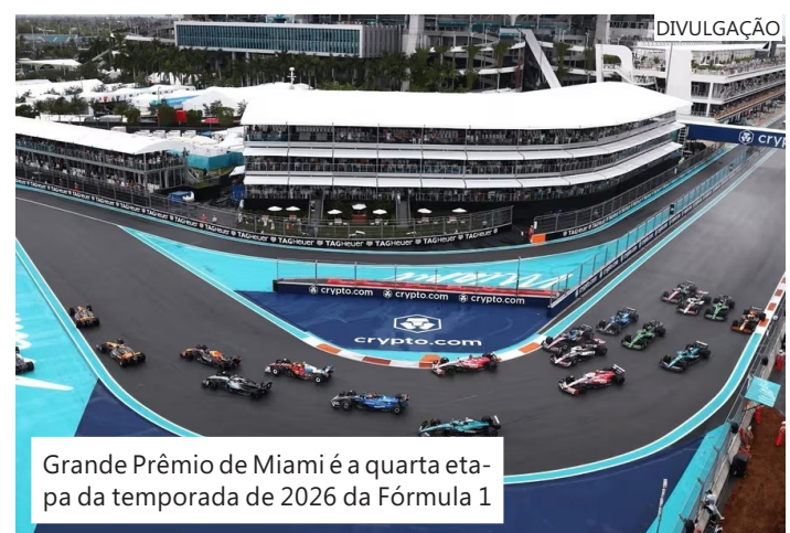
Grande Prêmio de Miami é a quarta etapa da temporada de 2026 da Fórmula 1