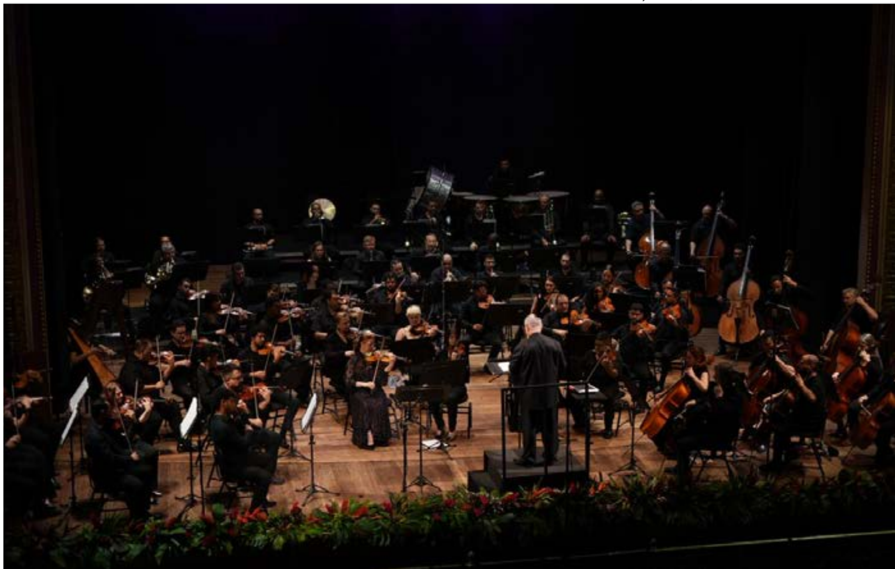
Em sua 27ª edição, evento consolida parcerias internacionais e traz o barítono sul-coreano Sunu Sun ao palco do Teatro Amazonas