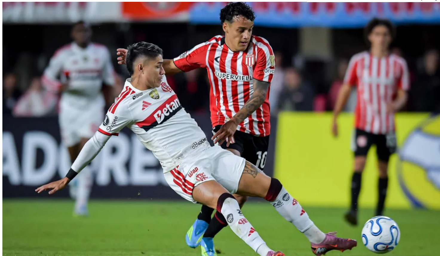
Lance de Estudiantes x Flamengo pela Libertadores

O lance do craque uruguaio foi aos 16 minutos do primeiro