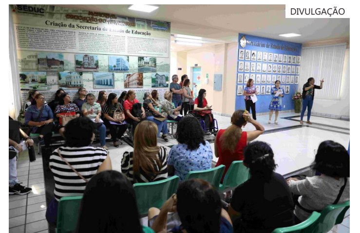
Atendimento aos candidatos convocados será nesta quinta-feira (30/04)

O não comparecimento do convocado excluirá o candidato do certame, ocasionando a perda do direito à vaga, conforme os editais de nº 01 e 02-PSS/SE-DUC/2023/2024 informam.