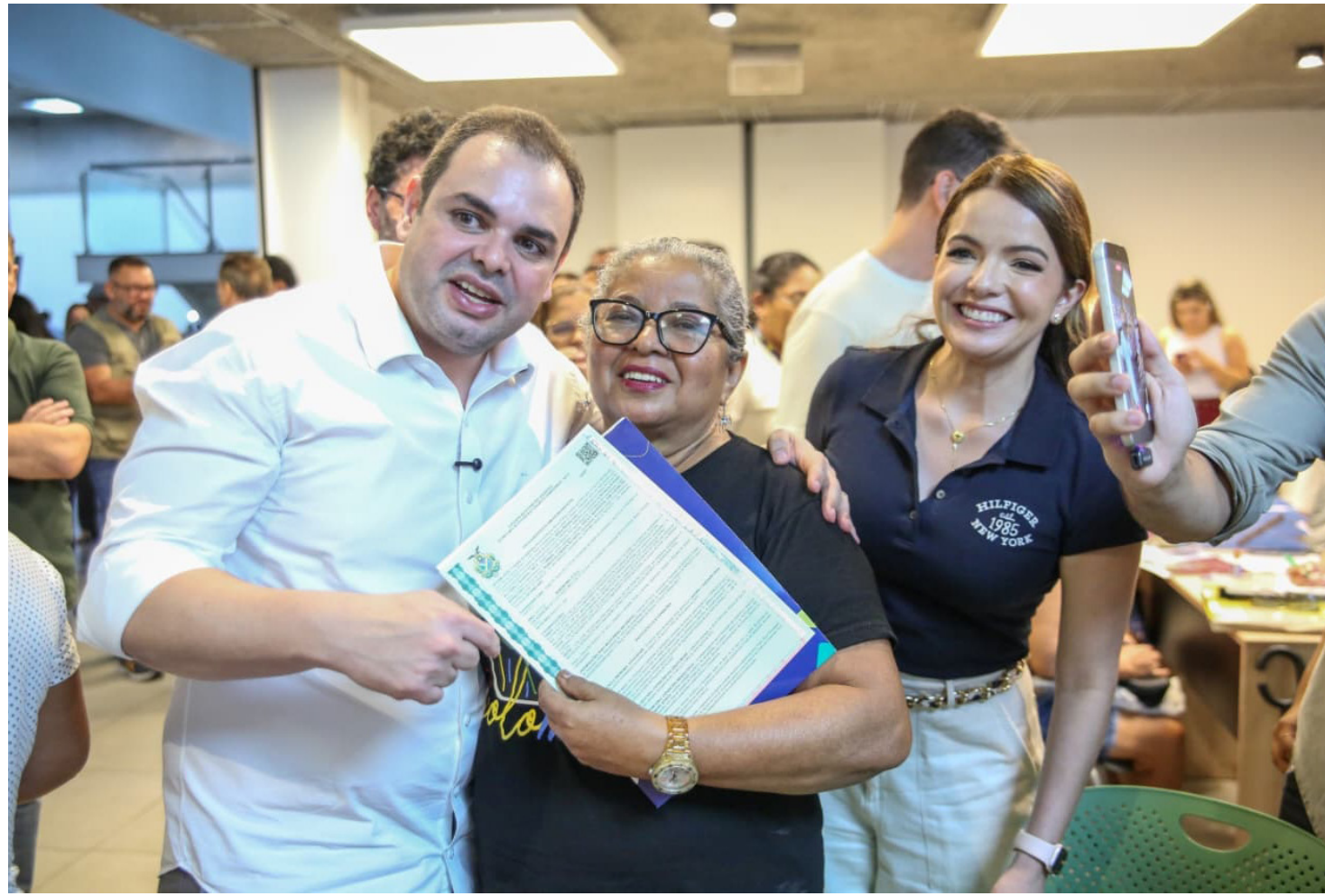
Entrega de 500 títulos definitivos de imóvel entregues pelo Governo do Estado