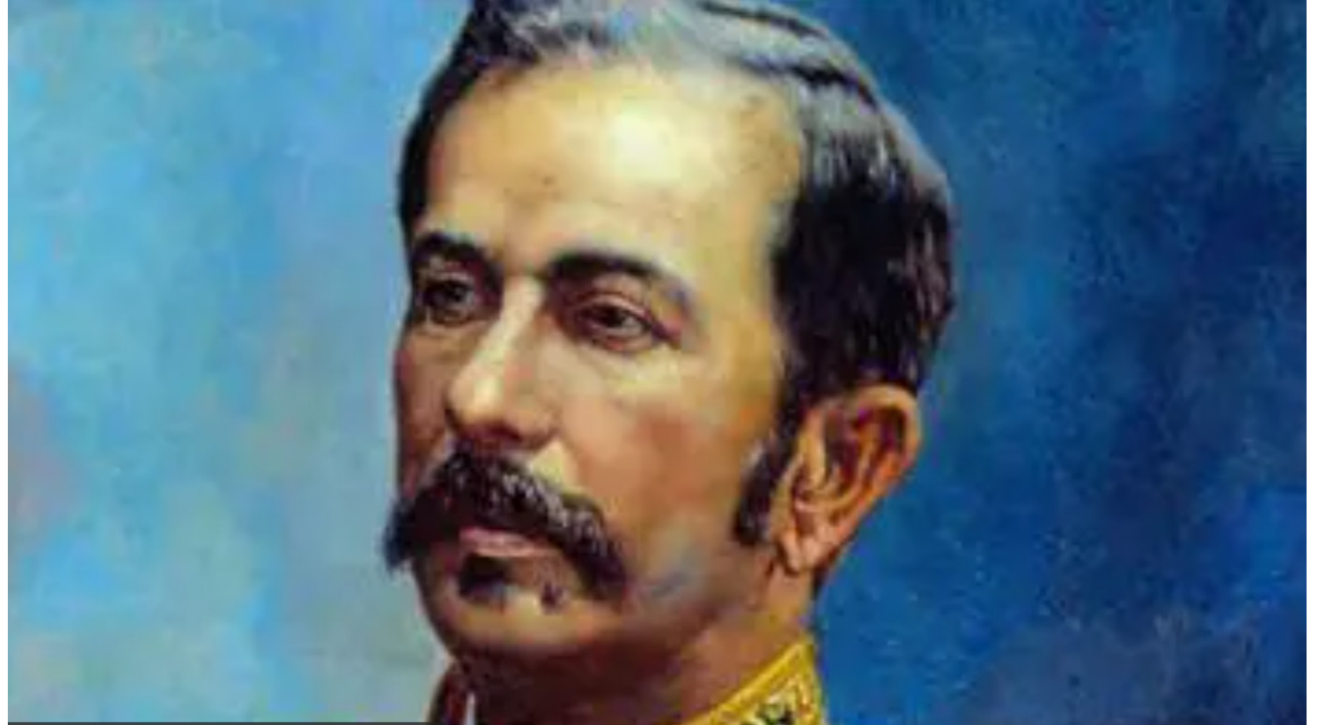
Floriano Peixoto teve 5 indicações rejeitadas

O órgão foi fundado em 1890, no ano seguinte à Proclamação da República. Embora seja her-