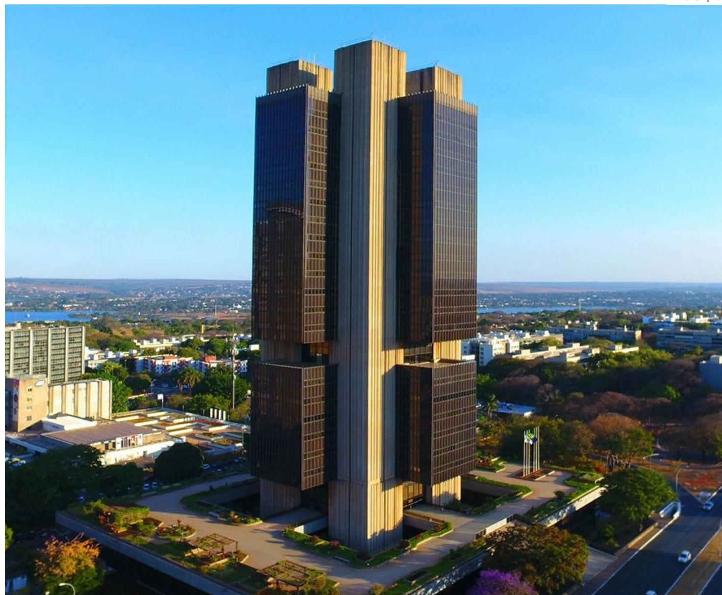
O BC reajustou suas expectativas para a inflação

O comitê ressaltou neste comunicado que o cenário garante condições para que sejam feitos ajustes no ritmo do ciclo de cortes. Além dis-