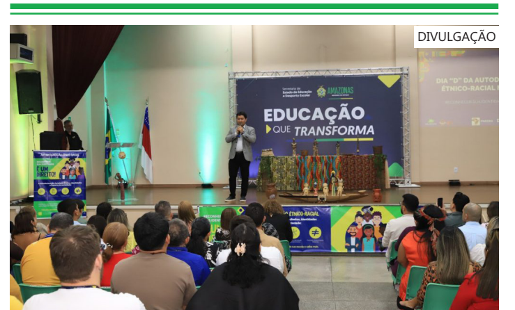
Campanha visa diminuir o percentual de estudantes que não declararam sua cor, raça ou pertencimento étnico-racial no Sigeam

A meta é diminuir o percentual de estudantes que não declararam sua cor, raça ou pertencimento étnico-racial no Sigeam