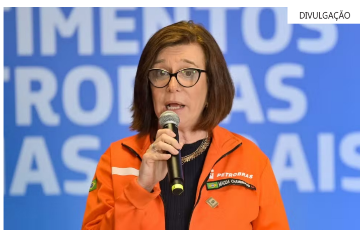
Presidente da Petrobras, Magda Chambriard

A presidente da companhia destacou que a gasolina exige uma análise mais cuidadosa do que o diesel, devido à concorrência direta com o etanol hidratado. Segundo ela, a queda recente do preço do biocombustível no mercado brasileiro influencia as decisões da estatal, especialmente diante da ampla frota flex do país.