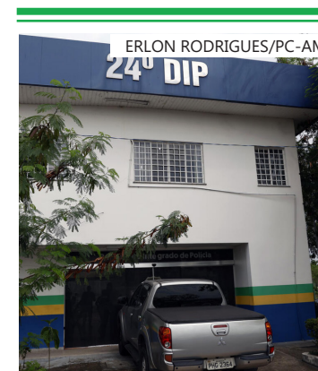
A ação cumpriu oito mandados de busca e apreensão no bairro Compensa

No dia do crime, a ação foi registrada por câmeras de segurança, que mostraram uma dupla de suspeitos entrando no local e rendendo o segurança e clientes que estavam no estabelecimento comercial.