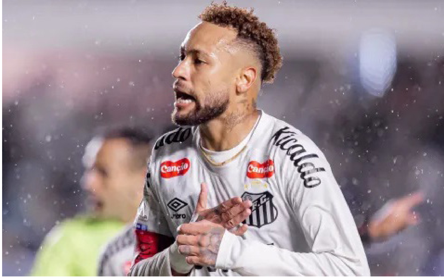
Neymar durante Santos x RB Bragantino

Neymar fará mais duas partidas antes do anúncio da convocação final dos 26 jogadores que vão representar o Brasil no Mundial. Os dois jogos serão contra o Coritiba, o primeiro fora de casa, pela Copa do Brasil, e o segundo na Vila Belmiro, em Santos, pelo