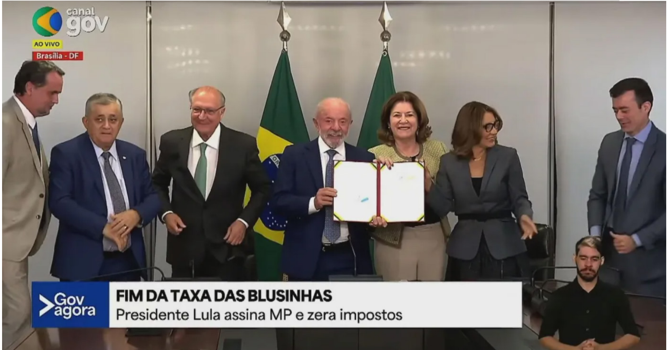
FIM DA TAXA DAS BLUSINHAS Presidente Lula assina MP e zera impostos

A medida foi anunciada no início da noite pelo presidente Lula