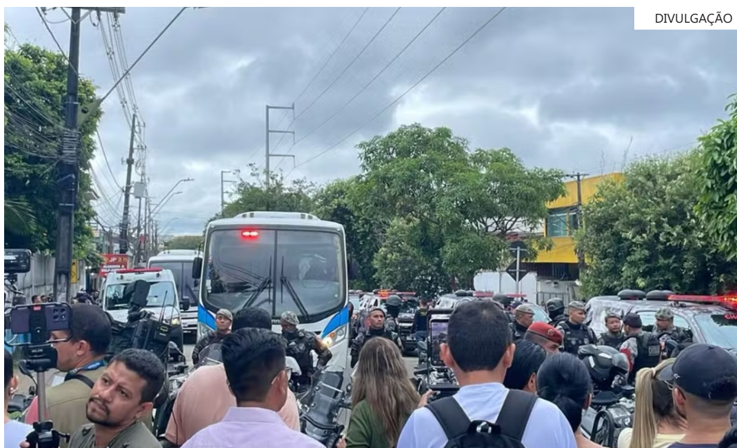
Mais de 70 agentes foram sendo levados para a nova Unidade Prisional da Polícia Militar do Amazonas

no bairro Monte das Oliveiras, Zona Norte da capital. Diferente da nova unidade, o núcleo funcionava como uma estrutura interna da própria corporação, em um prédio independente, usado de forma provisória para custodiar policiais militares presos. O espaço era destinado apenas a praças da PM, como soldados, cabos, sargentos e subtenentes.