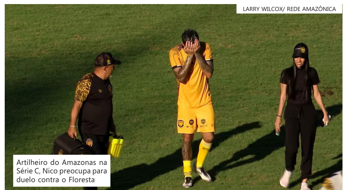
Artilheiro do Amazonas na Série C, Nico preocupa para duelo contra o Floresta