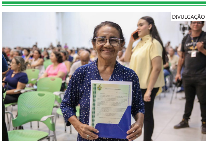
Para iniciar o processo, o interessado deve realizar o agendamento pelo WhatsApp (92) 98286-0162 e comparecer à sede da Sect

Para iniciar o processo, o interessado deve realizar o agendamento pelo WhatsApp (92) 98286-0162 e comparecer à sede da Sect, loca-