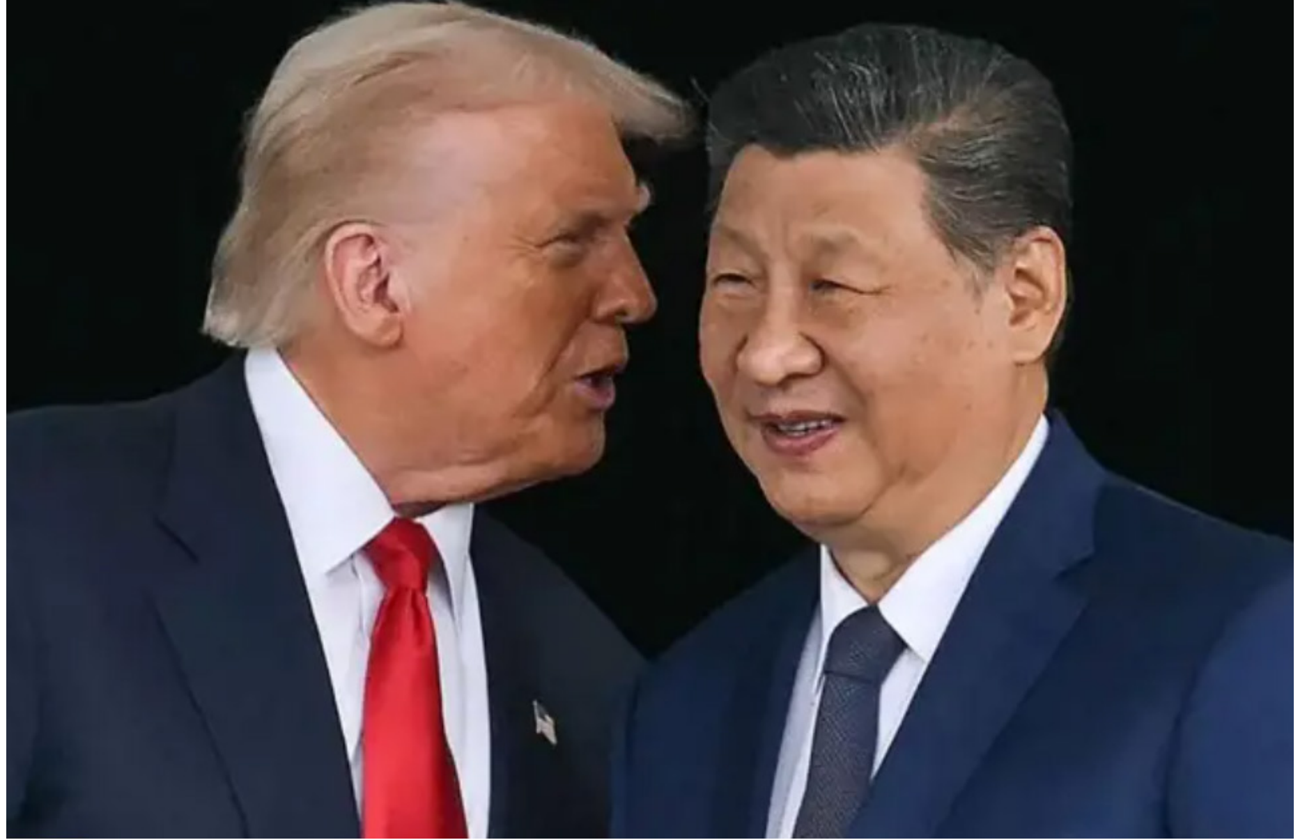
A visita de Estado na quinta e sexta-feira (14/5 e 15/5) incluirá negociações

Os EUA estavam observando de perto. “Espero que os chine-