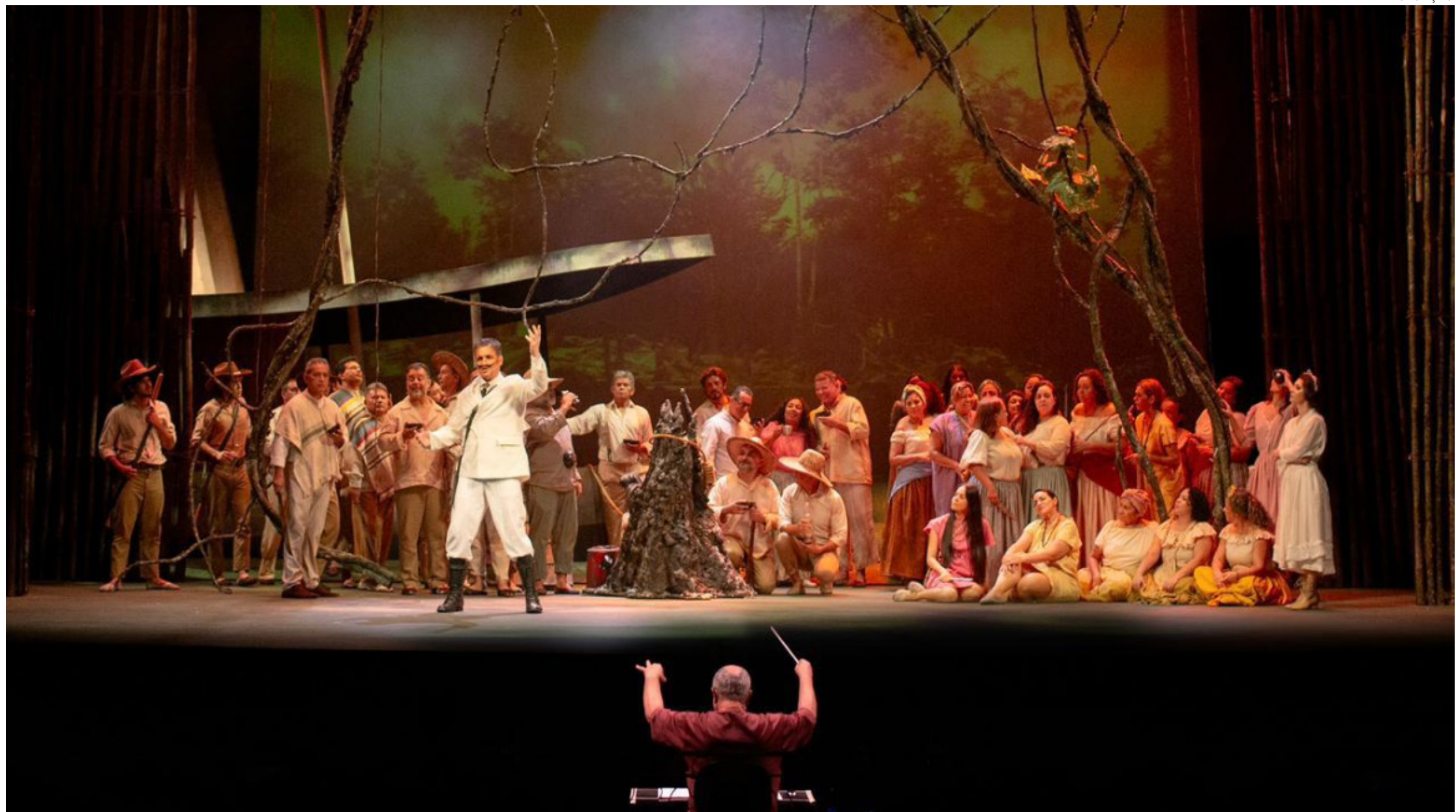
A programação completa pode ser conferida no Instagram oficial do evento, no perfil @festivalamazonasdeopera

Espectáculo un talentos locais e do Rio de Janeiro para contar saga de pintor revolucionário em Nápoles, nos dias 15, 17 e 19 de maio