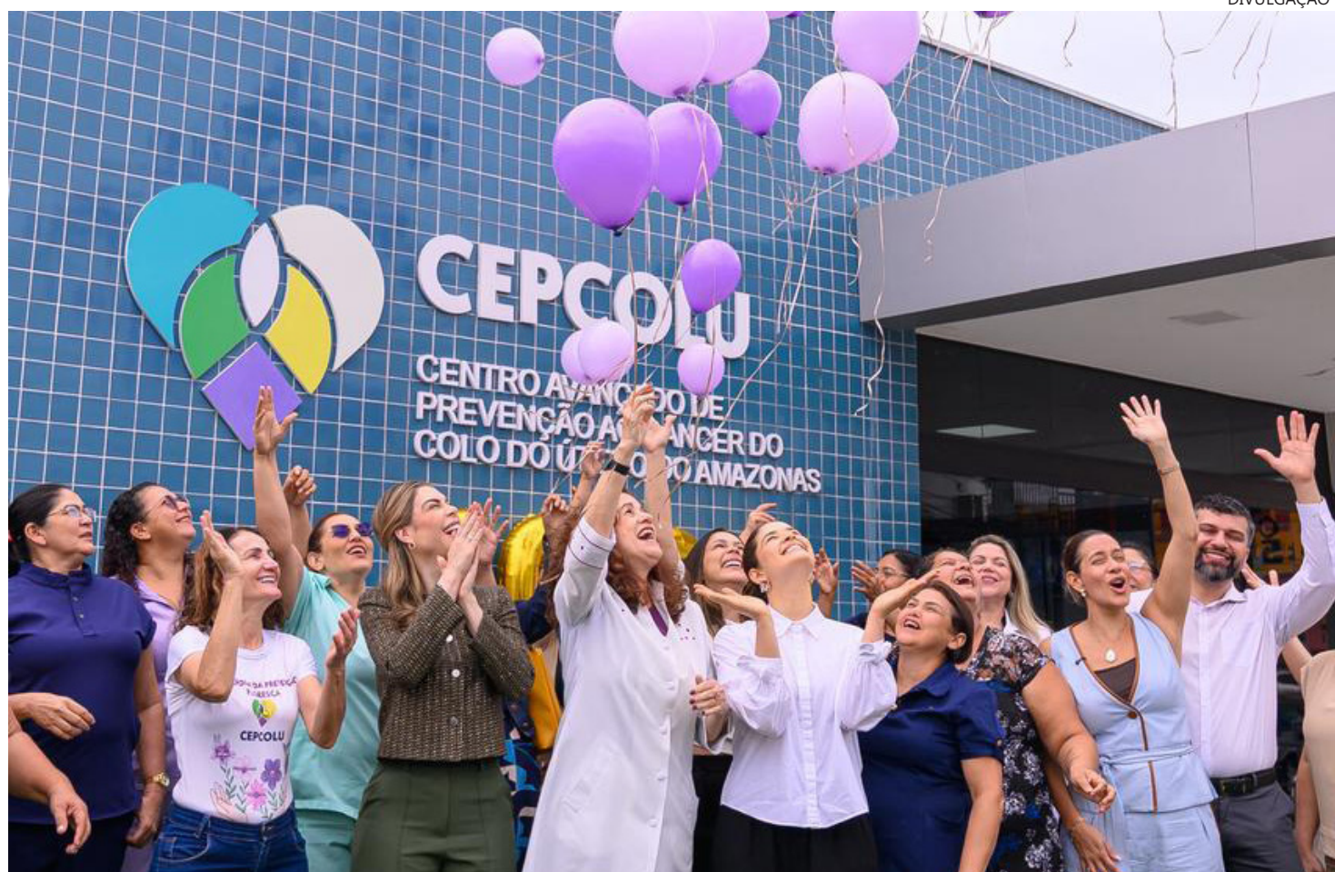
Centro Avançado de Prevenção ao Câncer do Colo do Útero do Amazonas (Cepcolu)

A primeira-dama Thaisa Cidade participou da solenidade em comemoração às mil conizações, conheceu a estrutura do Cepcolu e destacou o centro como uma unidade de acolhimento