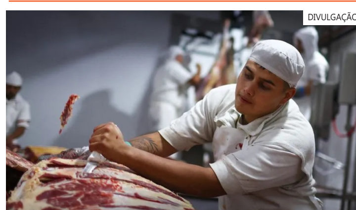
Brasil deve garantir conformidade com os requisitos da União sobre o uso de antibióticos durante toda a vida dos animais

“Para ser incluído na lista de países terceiros autorizados a exportar para a União, o Brasil deve garantir conformidade com os requisitos da União sobre o uso de antibióticos durante toda a vida dos animais dos quais os produtos exportados se originam”, afirmou a porta-voz.