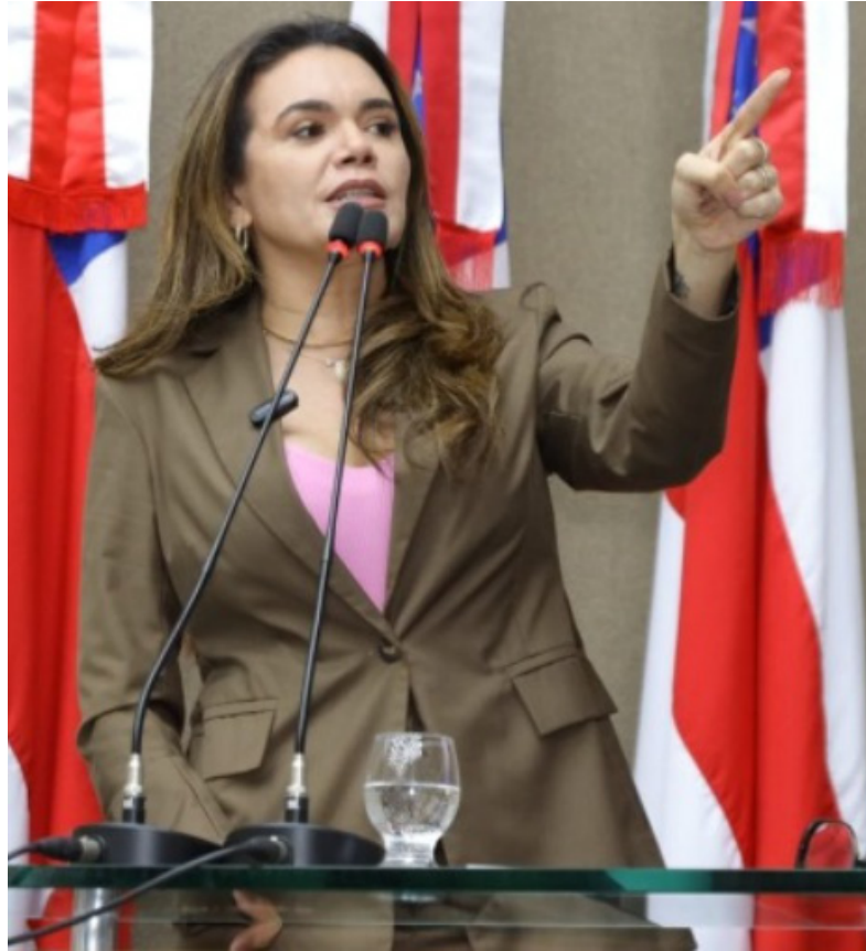
Deputada estadual Alessandra Campelo (PSD)