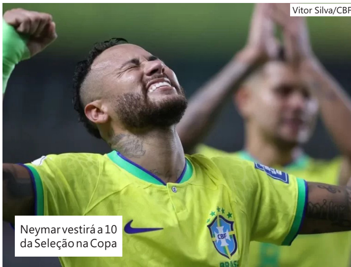
Neymar vestirá a 10 da Seleção na Copa

13 de junho: Brasil estreia contra o Marrocos, no MetLife Stadium, em Nova Jersey