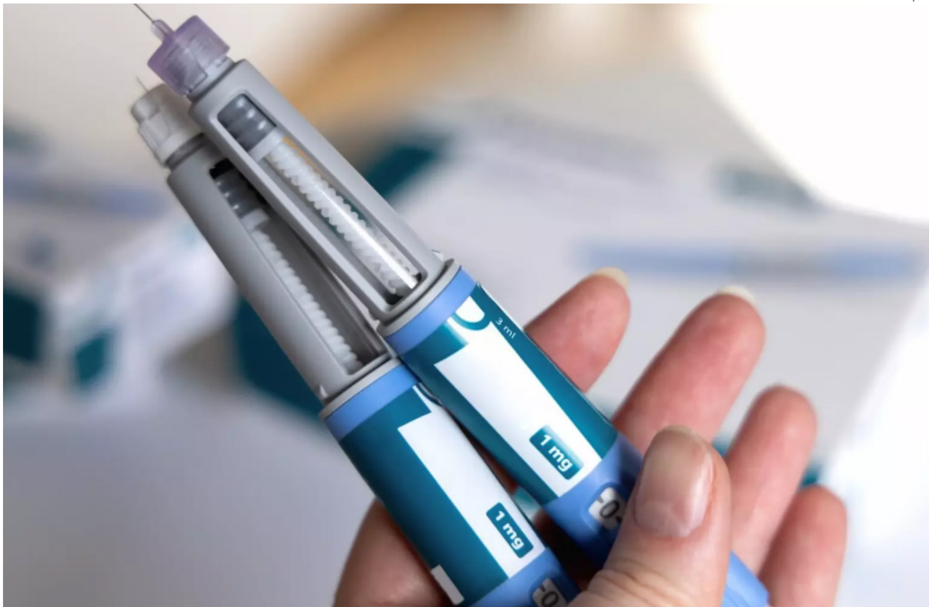
Ozivy é uma versão sintética do mesmo princípio ativo do Ozempic, que teve a patente derrubada em março