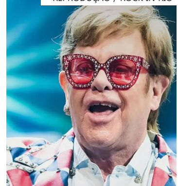
Evento de música do Rio de Janeiro ocorrerá nos dias 4, 5, 6, 7, 11, 12 e 13 de setembro