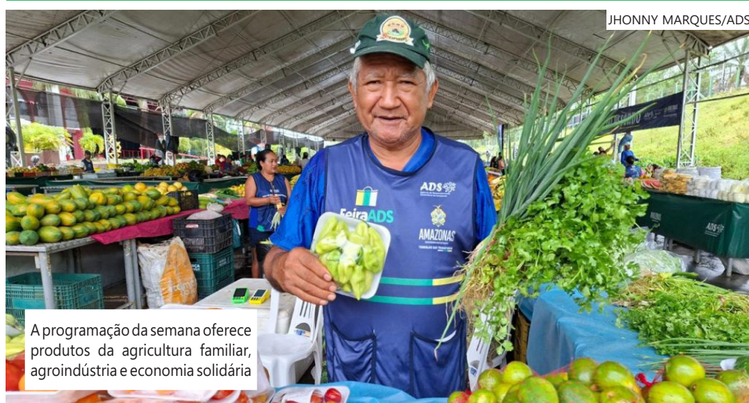
A programação da semana oferece produtos da agricultura familiar, agroindústria e economia solidária

Promovidas pelo Governo do Amazonas, por meio da Agência de Desenvolvimento Sustentável do Amazonas (ADS), as feiras impulsionam a economia local, incentivam a produção rural e garantem produtos de qualidade com bons preços, diretamente do produtor para o consumidor.