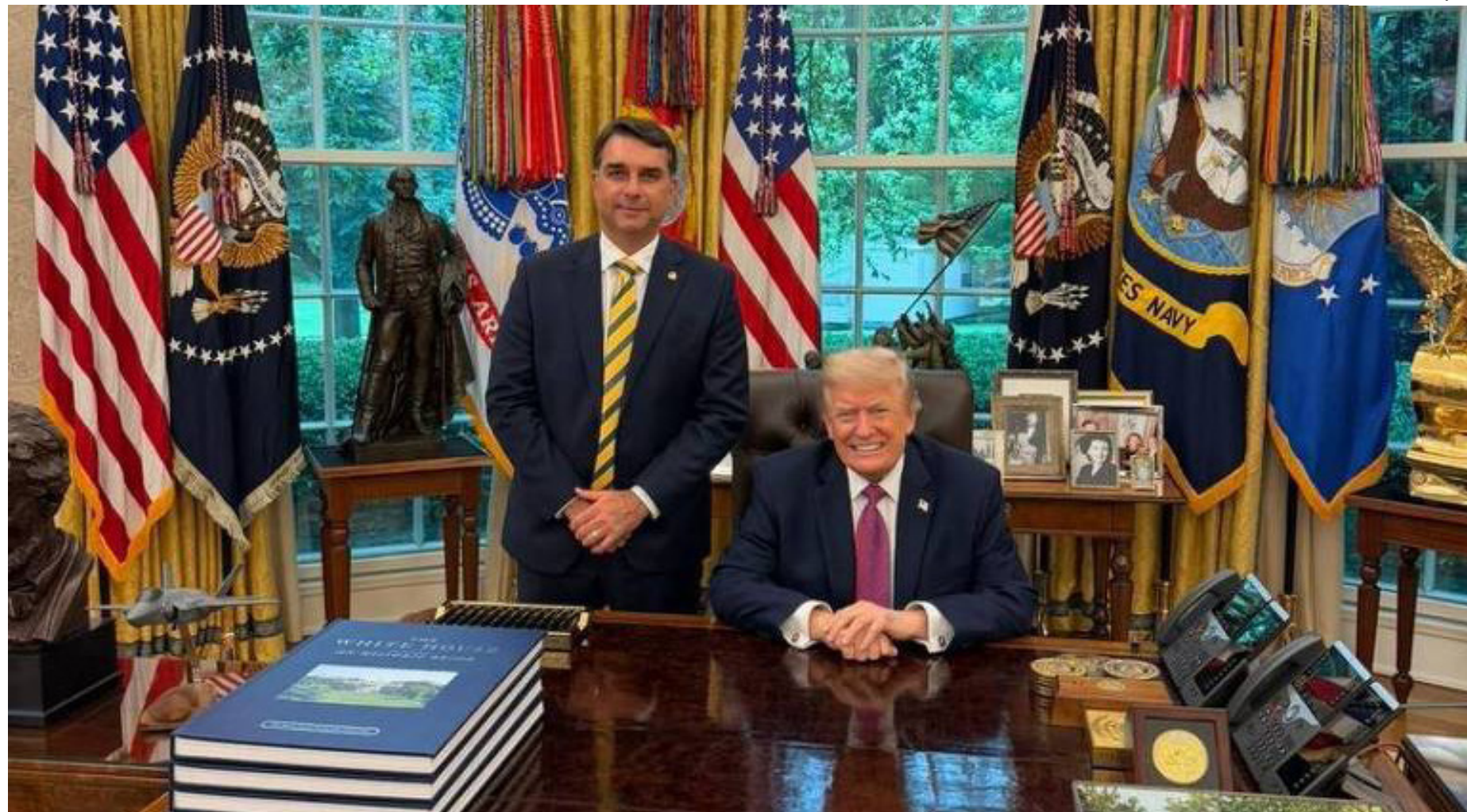
Senador Flávio Bolsonaro e o presidente dos EUA, Donald Trump

Segundo Flávio, as organizações criminosas brasileiras atingiram um nível transnacional, com ramificações nos Estados Unidos e na Europa,