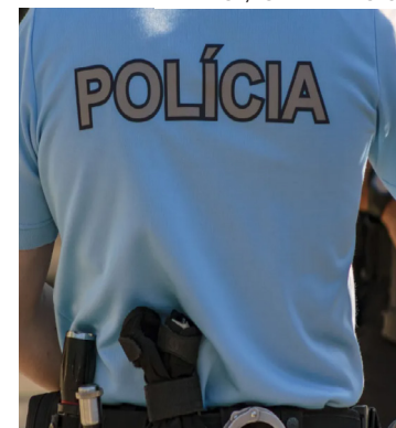
Grupo seria responsável por regularizar a situação de cerca de 4 mil imigrantes