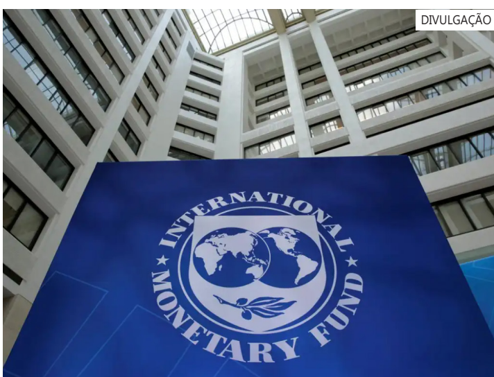
“Expectativas bem ancoradas ajudam a limitar a transmissão de altas nos preços da energia e de outras commodities para os preços em geral”

Isso, no entanto, não significa que o regime de metas exija uma conjuntura “perfeitamente tranquila” para ser implementado. Conforme o FMI, um amplo apoio institucional é essencial em quase todos os casos.