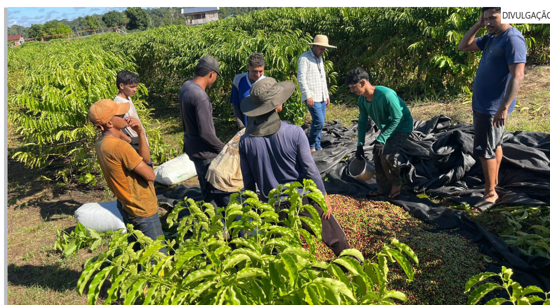
Idam faz visita técnica à agroindústria que receberá a produção

Com uma safra de 244,16 toneladas em 2025, a safra deste ano tem o potencial de triplicar os números alcançados no ano anterior.