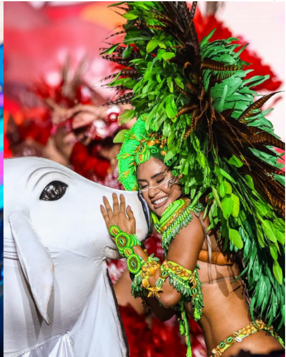
Cunhãs-poranga dos bois Caprichoso e Garantido estão entre os destaques do espetáculo