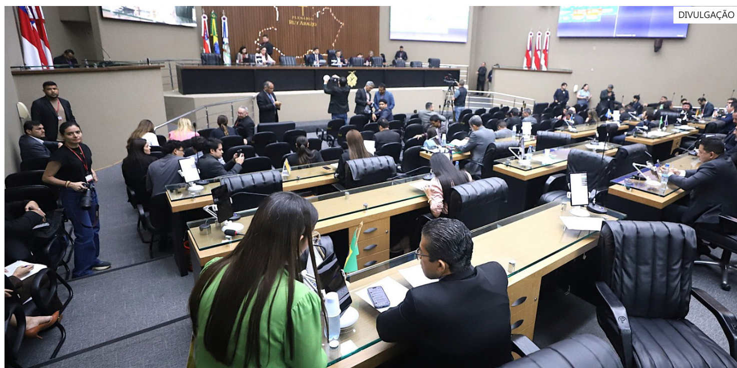
Assimbleia Legislativa do Amazonas (Aleam)

Também foi promulgada a Lei Ordinária nº 8.326/2026, que reconhece o Hino do Estado do Amazonas como patrimônio cultural de natureza imaterial do Amazonas.