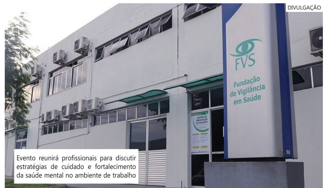
Evento reunirá profissionais para discutir estratégias de cuidado e fortalecimento da saúde mental no ambiente de trabalho

Mais informações podem ser obtidas pelo e-mail: cerestam.visat@gmail.com .