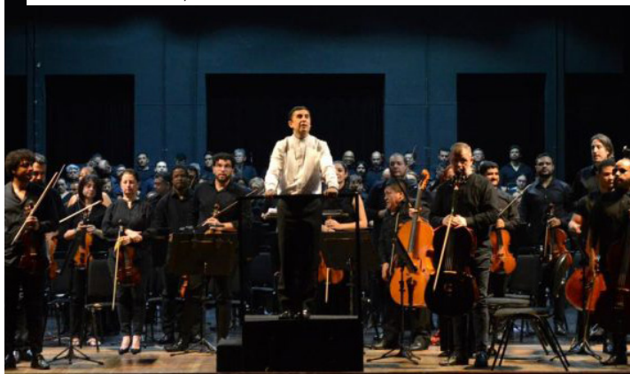
Peça de Gaetano Donizetti encerra a 27ª edição do festival com a Amazonas Filarmônica e solistas de renome nacional