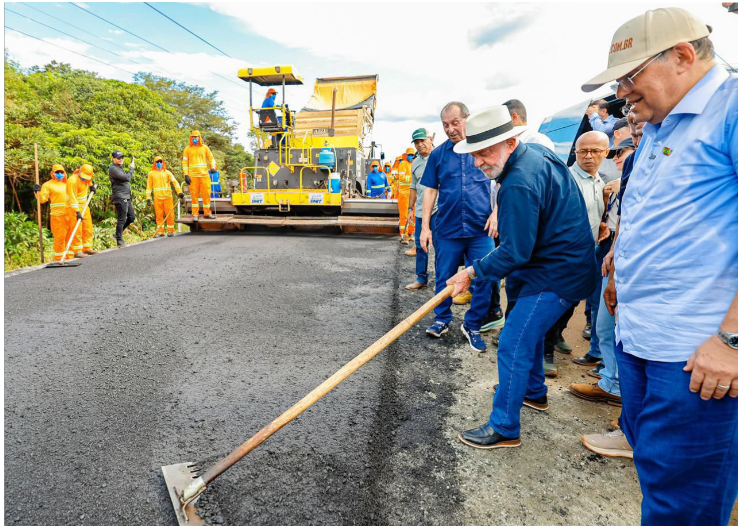
Presidente Lula pisou no asfalto que, enfim, está caindo na BR-319 depois de décadas de descaso

O senador também ressaltou que a presença de Lula no Amazonas representa uma nova etapa de investimentos estruturantes para o estado. "Presidente Lula