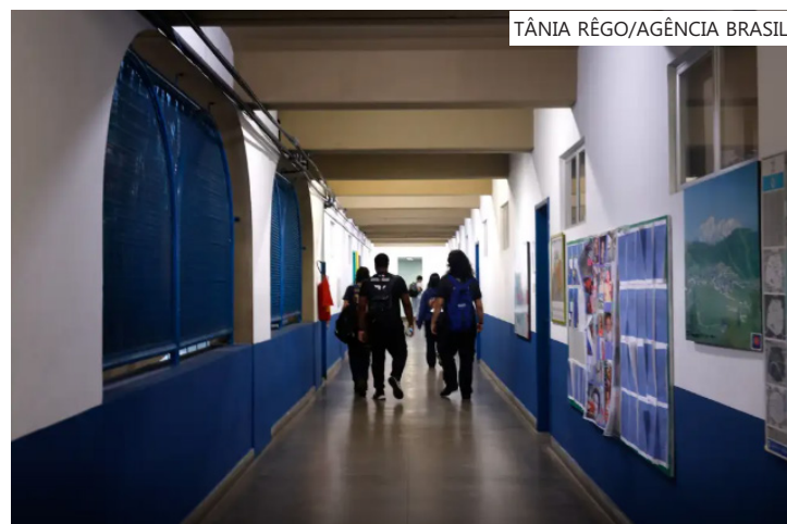
Profissionais relatam dificuldade em temas como racismo e bullying