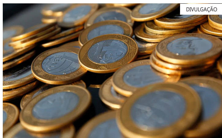
Dados da entidade apontam que Brasil tem 82,8 milhões de pessoas com problemas nas contas pessoais

"Quando despesas essenciais, como alimentação e saúde, passam a ser financiadas no crédito, o risco de efeito bola de neve aumenta significativamente".