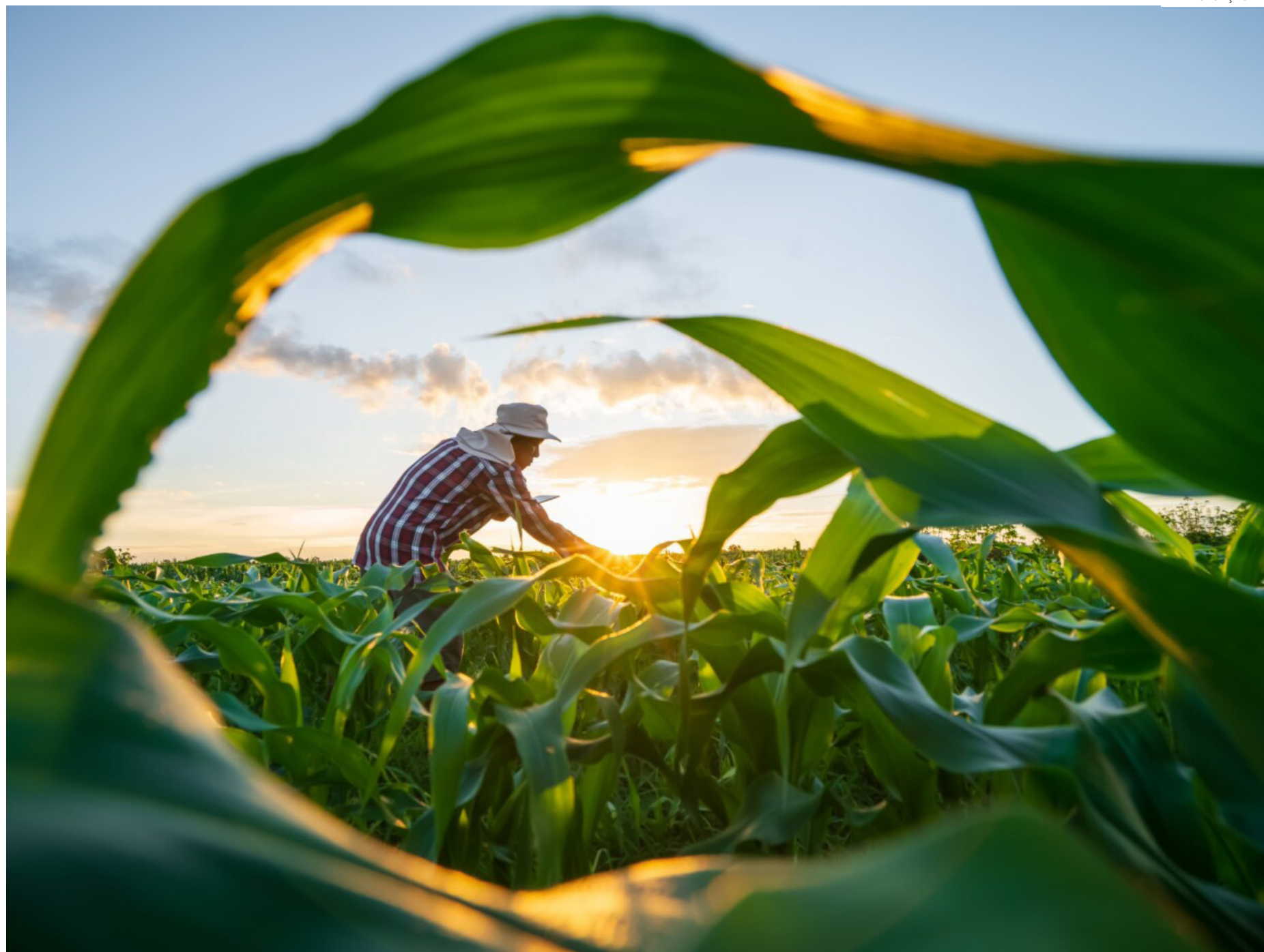
Trabalhadores rurais ganham menos que a média nacional

O estudo indica ainda que o bom desempenho da agropecuária, com recordes de safras e de abates animais, ampliou a procura pelo setor de serviços. Também apresentaram salto nos postos de trabalho os setores de agroindústria (aumento de 1,4% com 66 mil novos empregos) e insumos (3,4%, com 10,5 mil novos postos). A única categoria que re-