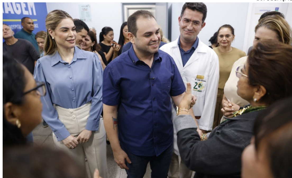
Programa já efetuou mais de 336 mil procedimentos e projeta alcançar 342 mil cirurgias em 2026

O tempo de espera pelos procedimentos também apresentou redução significativa. Nas