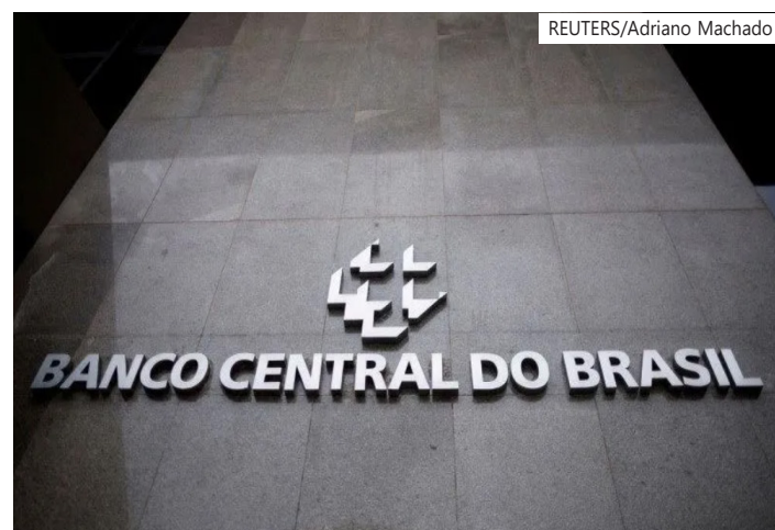
No comércio exterior, saldo no período foi positivo em US$ 6,61 bilhões, com importações de US$ 21,88 bilhões e exportações de US$ 28,5 bilhões

O País anotou fluxo cambial positivo de US$ 3,3 bilhões na semana passada, segundo o BC. Entre os dias 27 e 30 de abril, o canal financeiro apresentou saídas líquidas de US$ 1,02 bilhão.