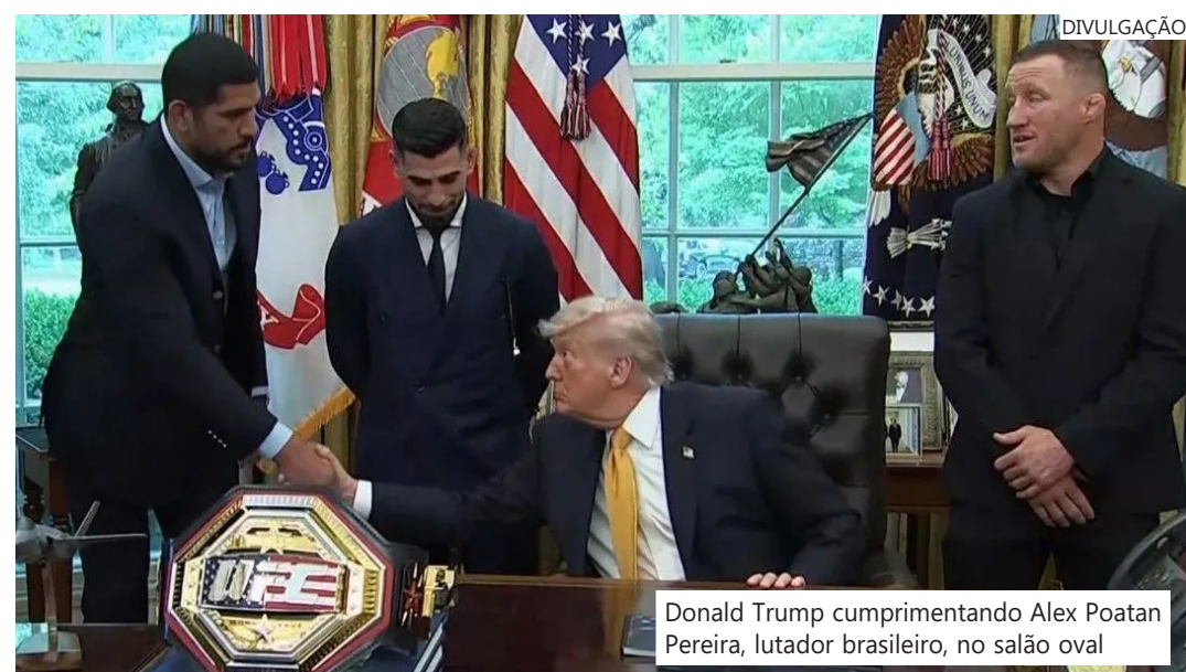
Donald Trump cumprimentando Alex Poatan Pereira, lutador brasileiro, no salão oval

"Pela forma como a Casa Branca é organizada, você tem o prédio, depois o South Lawn, depois uma estrada e logo ali o parque Ellipse. Vamos distribuir ingressos para 85 mil pessoas no Ellipse", disse o dirigente, que garantiu que os ingressos serão gratuitos.