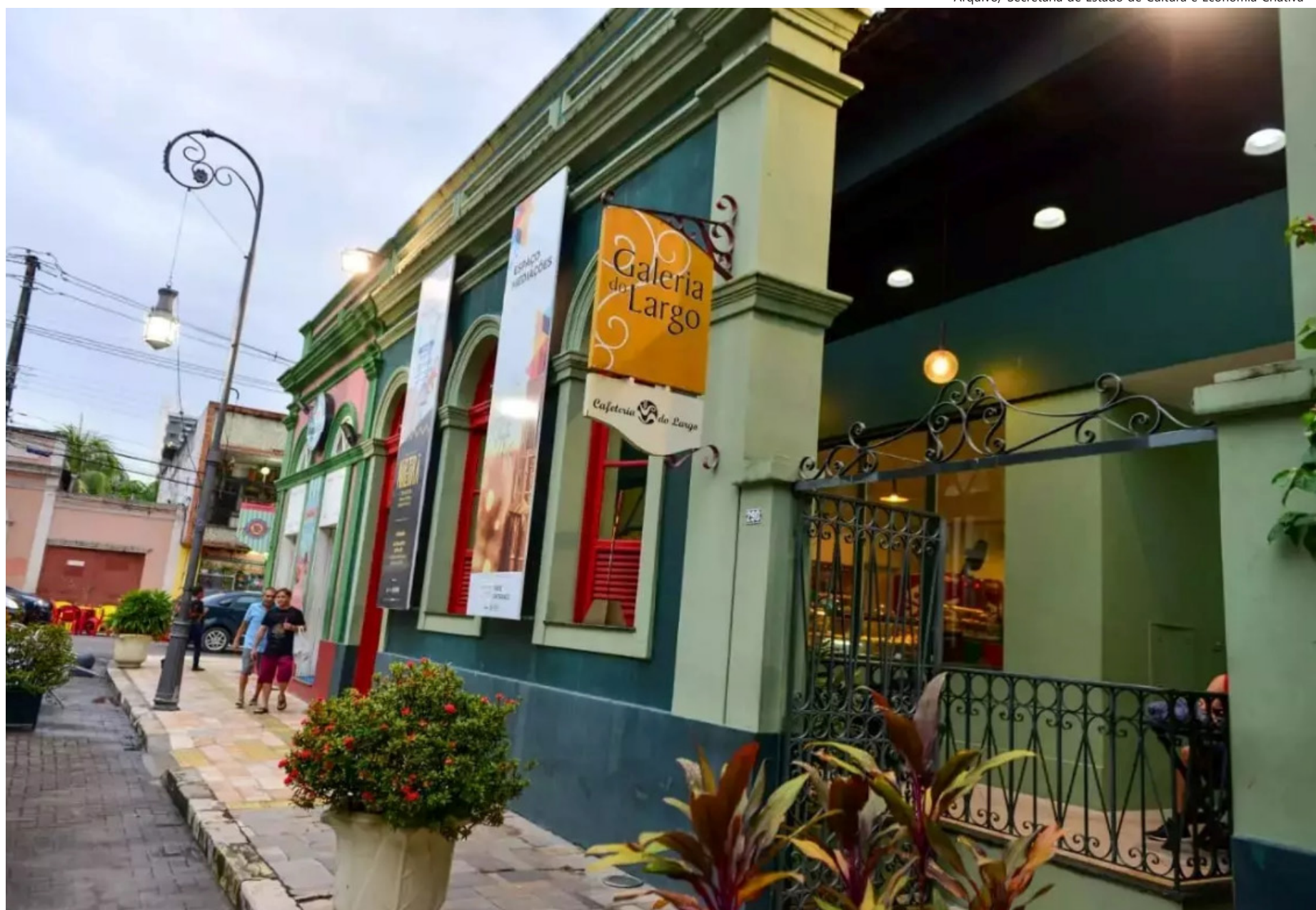
A mostra reúne três propostas expositivas que dialogam com processos contemporâneos de criação nas artes visuais