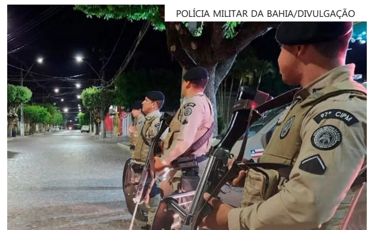
Pelo menos 24 suspeitos morreram em confronto com a PM da Bahia em novembro de 2023

Segundo informações da Secretaria da Segurança Pública (SSP), o mês de abril de 2026 teve 256 ocorrências de mortes violentas. Para a pasta, o primeiro quadrimestre do ano marcou a queda de crimes graves contra a vida, passando de 1.449 casos no mesmo período de 2025 para 1.119 neste ano.