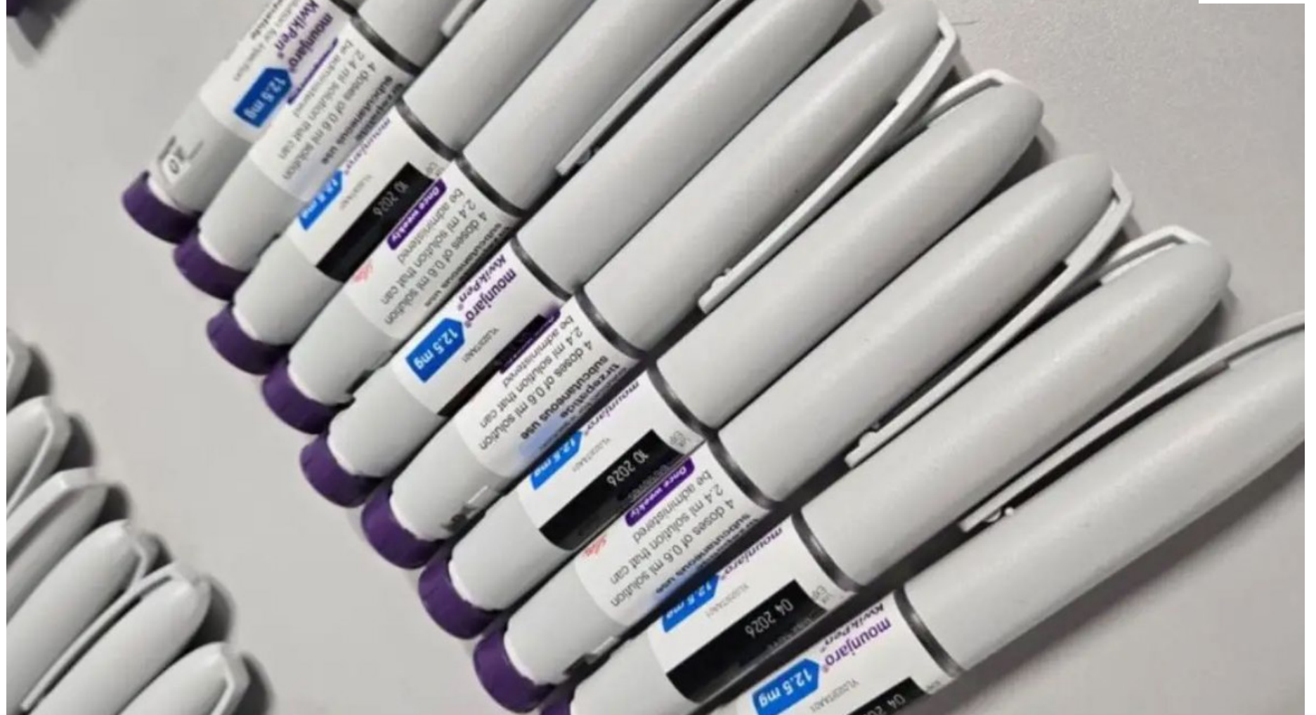
Acordo para atuação conjunta deverá ser assinado

De acordo com Pereira, a cooperação consolida um modelo já testado em operações conjuntas pontuais, como a Heavy Pen, que, no mês passado, cumpriu 45 mandados judiciais de busca e apreensão e 24 ações de