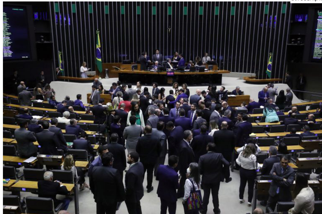
Plenária da Câmara dos Deputados

O texto aprovado cria a PNMCE (Política Nacional de Minerais Críticos e Estratégicos) e estabelece instrumentos para estimular beneficiamento, transformação mineral, industrialização, inovação e