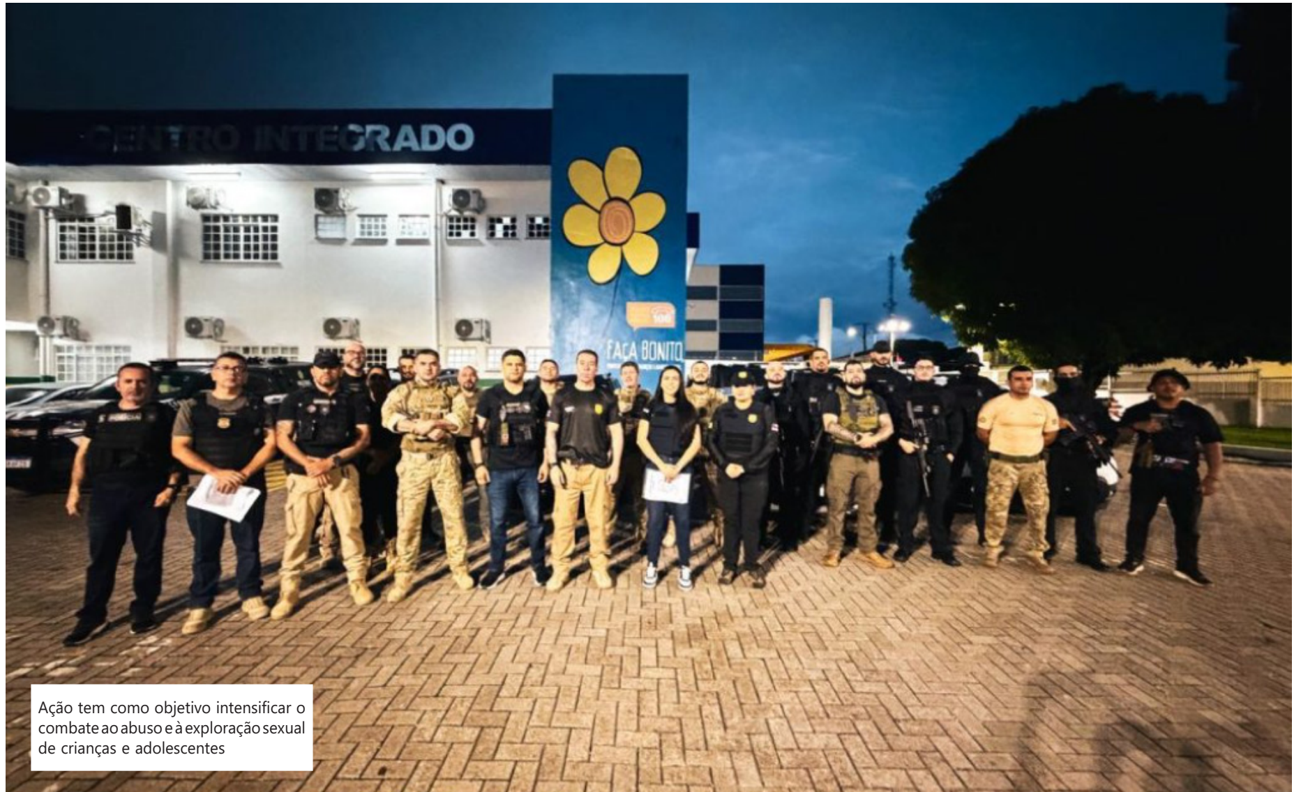
Ação tem como objetivo intensificar o combate ao abuso e à exploração sexual de crianças e adolescentes