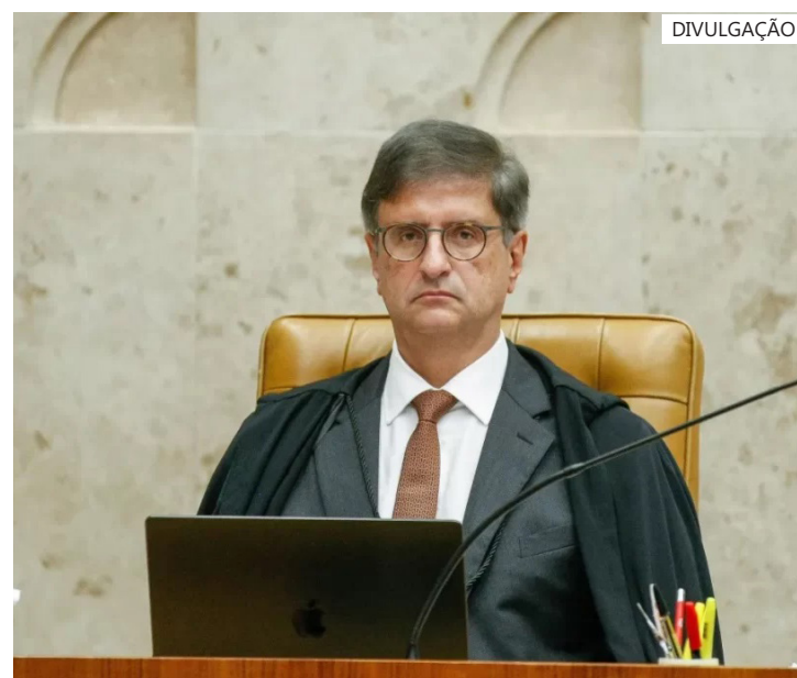
Procurador-geral da República Paulo Gonet

A medida surtiu efeito. Desde a edição da portaria, a Rede Membros diminuiu o número de integrantes de mais de 1.000 para menos de 300 nesta semana, segundo seus integrantes.