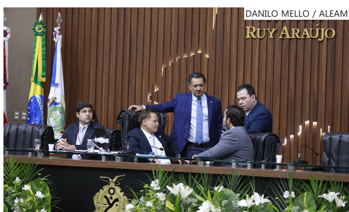
Sessão Ordinária no plenário Ruy Araújo

Entre os itens estão duas repetidoras de comunicação instaladas em Iranduba e Tabatinga, além de 1.400 coletes balísticos e motores de alta potência para embarcações de patrulhamento.