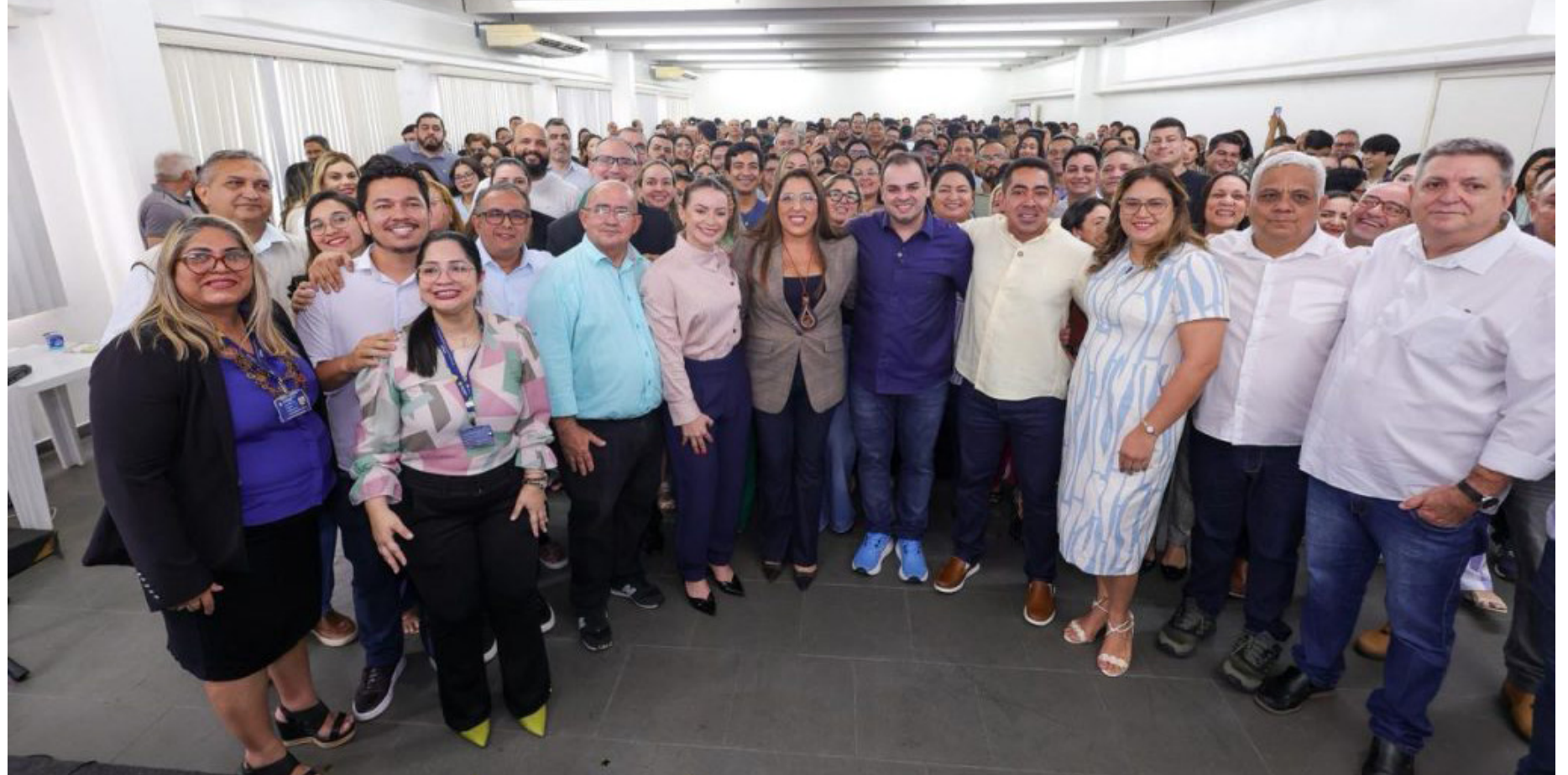
Visitas institucionais às sedes administrativas da Secretaria de Estado de Educação e Desporto Escolar (Seduc) e da Secretaria de Estado de Produção Rural (Sepror)

"Nosso foco é agir com eficiência e responsabilidade. Pedi que elaborem, com