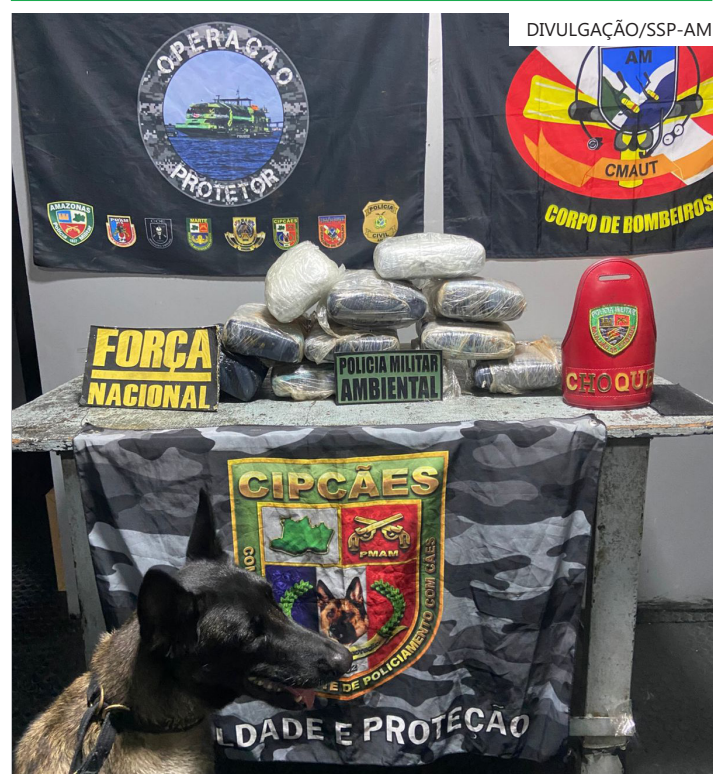
Confronto aconteceu durante a abordagem a uma lancha blindada usada pelos criminosos, que conseguiram fugir

minhados ao cartório da Base Arpão II, onde permaneceram à disposição da autoridade policial. O prejuízo estimado ao crime organizado é de aproximadamente R$ 226,1 mil.