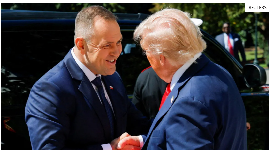
Líder americano anunciou na quinta-feira (21) que os EUA enviarão mais 5 mil soldados para a Polônia

O presidente polonês, Karol Nawrocki, agradeceu ao presidente dos Estados Unidos, Donald Trump, por sua decisão de enviar tropas americanas adicionais para a Polônia. A manifestação de gratidão ocorreu depois que Trump afirmou, na quinta-feira (21), que os EUA enviariam mais 5.000 soldados para a Polônia, citando sua relação com Nawrocki como o motivo.