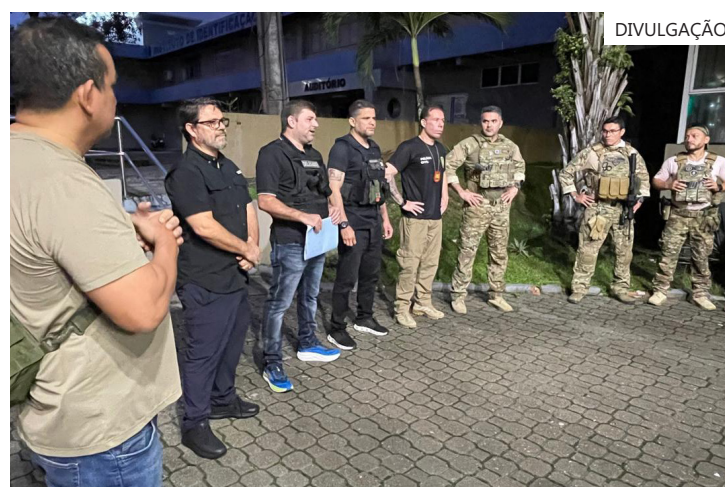
Foram cumpridos 33 mandados em Manaus e 11 no interior