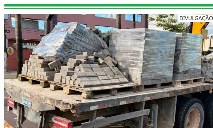
Operação fiscalizou caminhões, reboques, semirreboques e caminhões-tratores em diversas zonas da capital