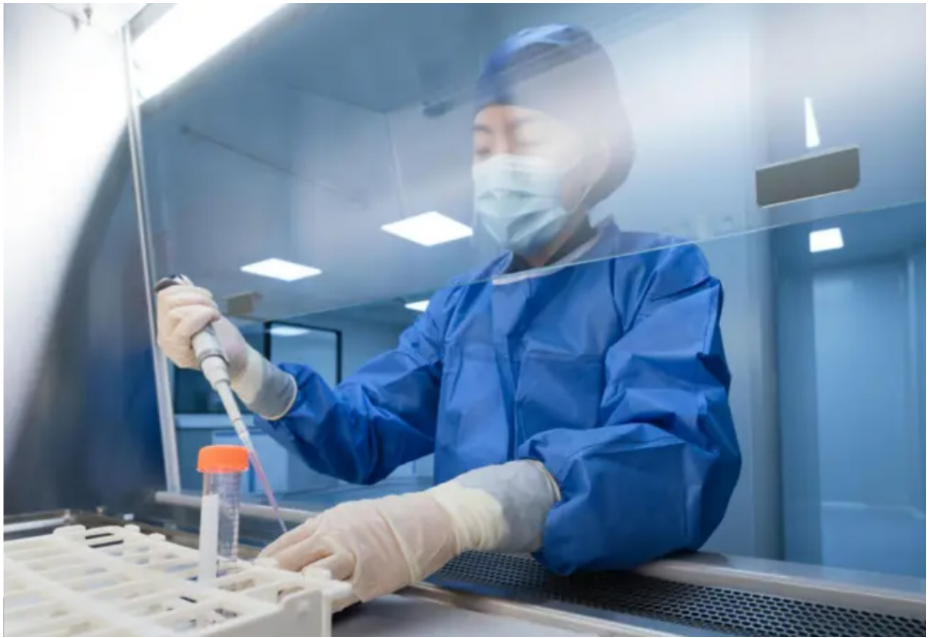
O surto em curso, concentrado na República Democrática do Congo, já registrou 750 casos suspeitos e 177 mortes

A atualização do status do surto ocorreu depois de a OMS declarar, no último domingo (17/05), emergência de saúde pública de interesse internacional, ressaltando que o surto não configura uma pandemia (situação em que uma doença infecciosa ameaça muitas pessoas ao redor do mundo simultaneamente, como ocorreu com a Covid-19). Uma outra vacina experimental contra a Bundibugyo também está em desenvolvimento, mas a previsão é que leve entre seis e nove meses para