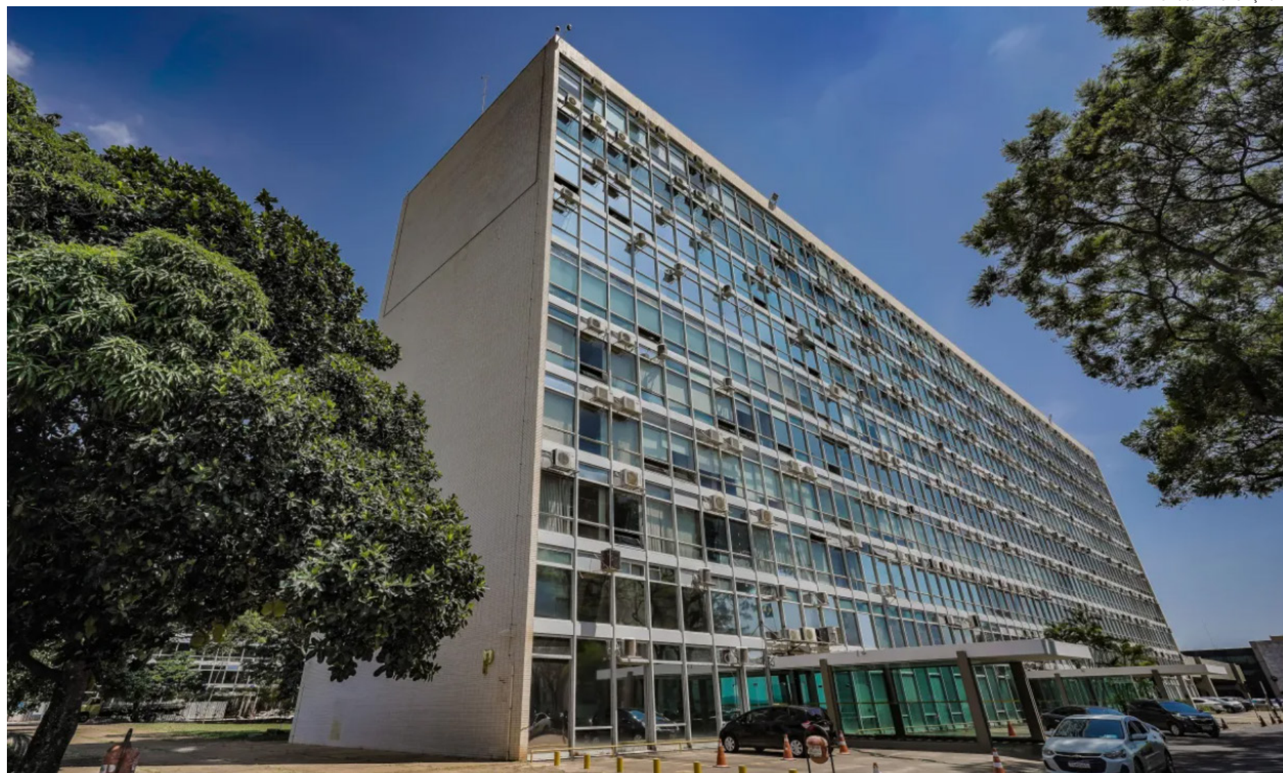
Prédio do Ministério da Fazenda, na Esplanada dos Ministérios, em Brasília

O detalhamento de quais ministérios serão atingidos pelo bloqueio será divulgado até o fim deste mês, por meio do decreto de programação orça-