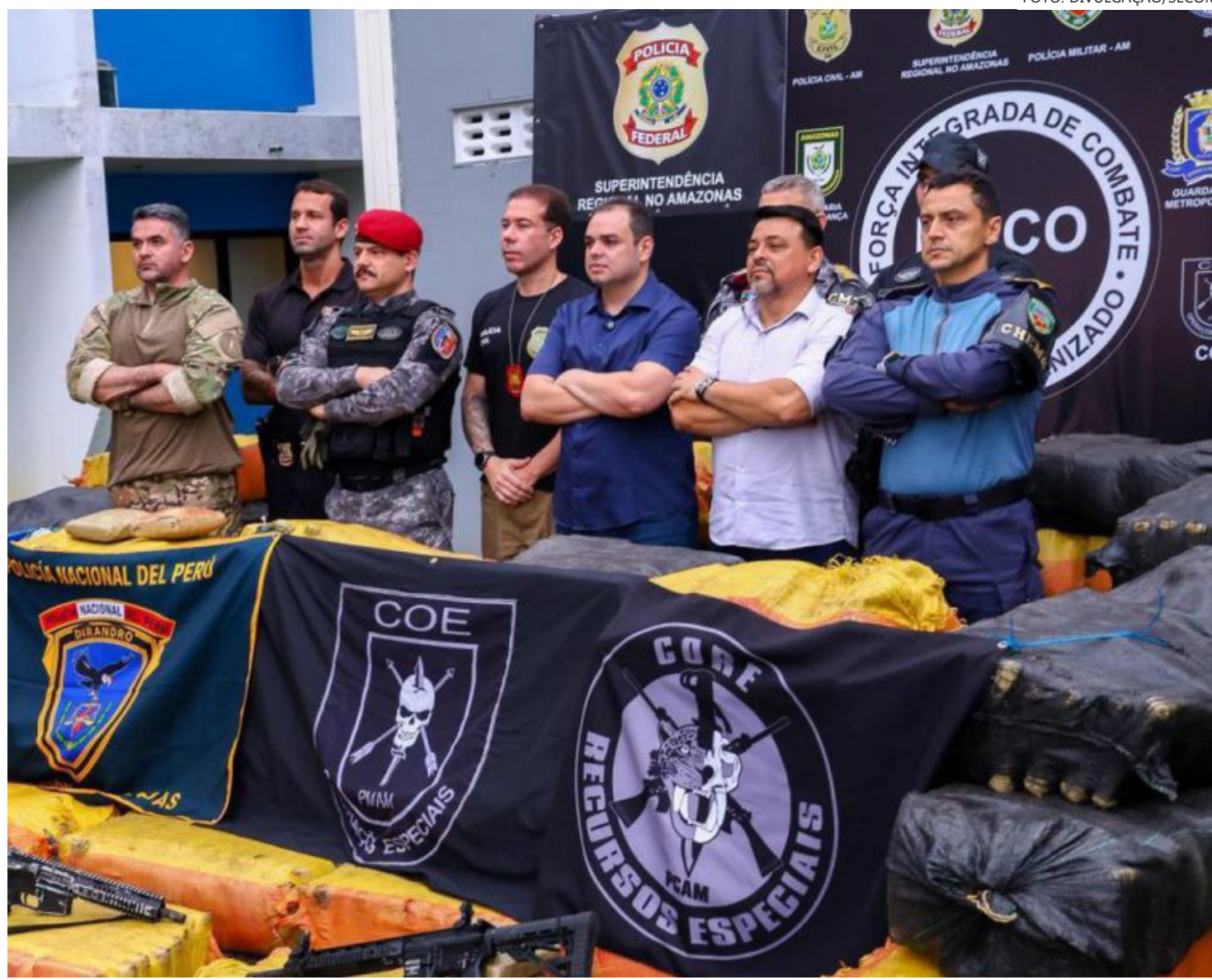
Governo do Estado lançou a segunda fase da Operação Segurança Presente, ampliando as ações para os 61 municípios do interior

"Quero aqui parabenizar a COE, parabenizar a Polícia Internacional, agradecer também o empenho da Polícia Federal. Foi um trabalho em conjunto. Fizemos uma das maiores apreensões de drogas da história do estado do Amazonas e nosso objetivo é continuar o combate ao crime dessa forma. Os traficantes vinham numa lancha blindada artesanal, altamente armados, mas, graças a Deus e a coragem desses homens, nossos policiais