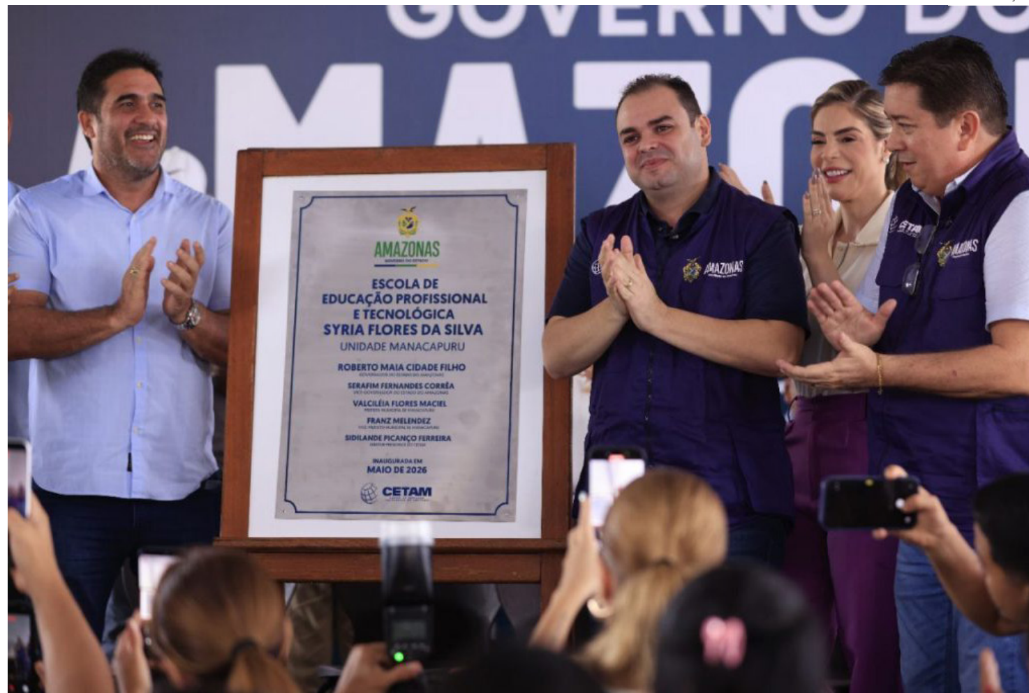
Inauguração da Escola de Educação Profissional e Tecnológica Syria Flores da Silva, em Manacapuru

Durante a inauguração, o governador Roberto Cidade destacou que investir em educação profissional é criar oportunidades, garantindo que mais amazonenses tenham acesso à formação e melhores condições de inserção no mercado de trabalho. "O caboclo amazonense, o homem e a mulher amazonense precisam ter oportunidades. E, quando têm uma oportunidade, podem chegar longe. Enquanto eu estiver na condição de governador, vou me dedicar ao máximo para cuidar das nossas famílias e das pessoas que precisam dessas oportunidades. O Cetam é uma marca deste governo, que investe nos nossos homens e mulheres. Temos muitos desafios, mas sei que, a cada dia, vamos dar um passo à frente e fazer muitas entregas para a população", afirmou Roberto Cidade.