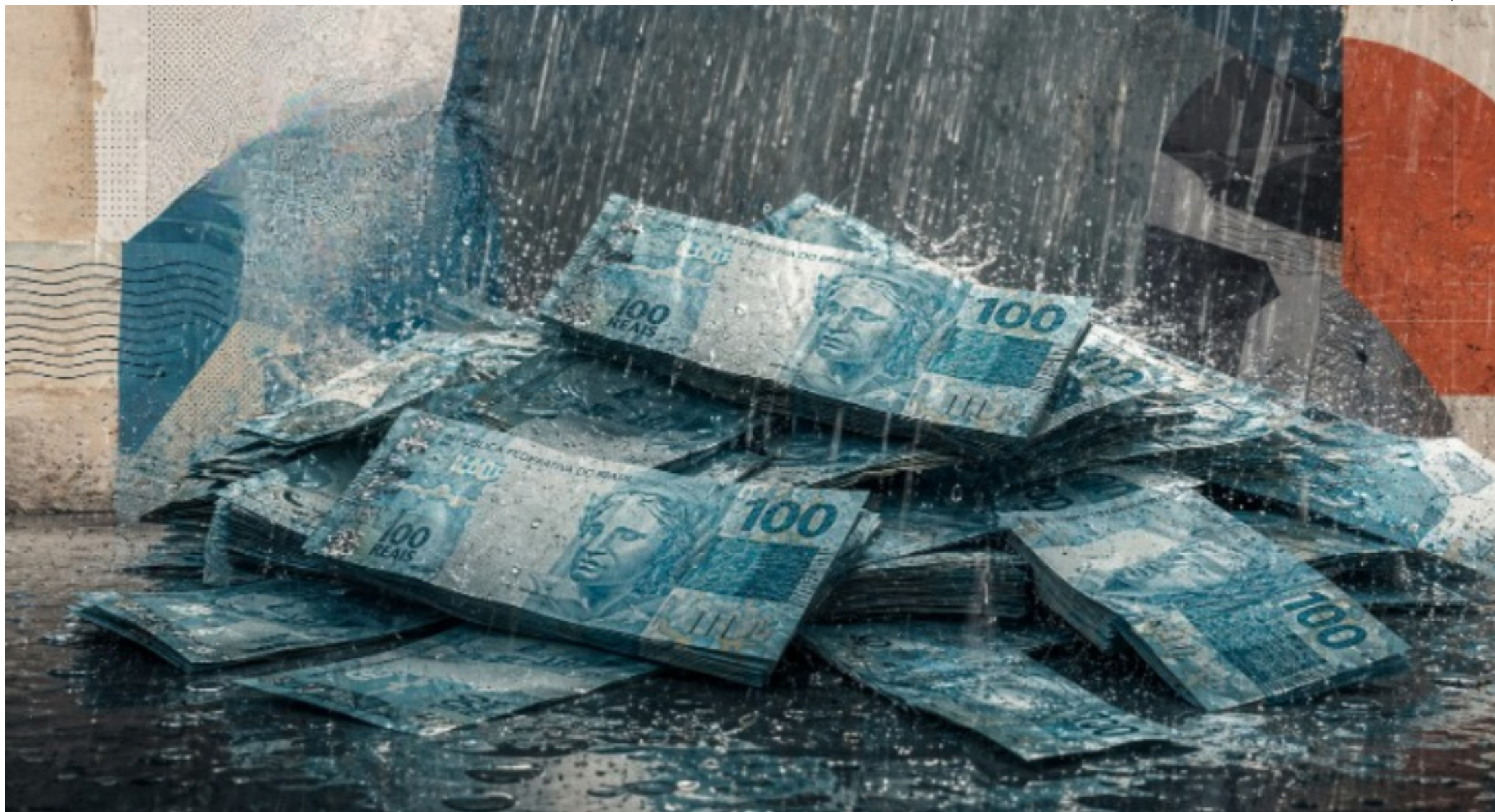
Estruturas financeiras sofisticadas, patrimônio e aparência de legalidade passaram a ocupar papel central nas investigações sobre crime organizado