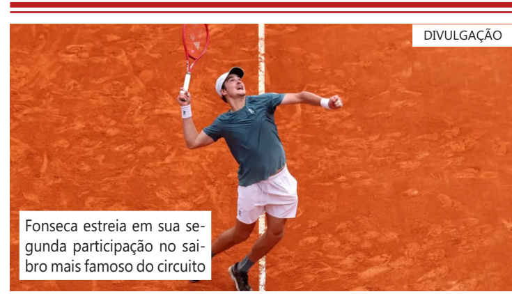
Fonseca estreia em sua segunda participação no saibro mais famoso do circuito

Na semifinal, o brasileiro pode cruzar com Alexander Zverev ou Taylor Fritz. Do outro lado da chave, o líder do ranking mundial Jannik Sinner surge como principal favorito ao título.