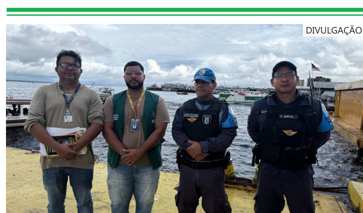
Fiscalização semanal verifica regularização de serviços turísticos e reforça segurança aos visitantes