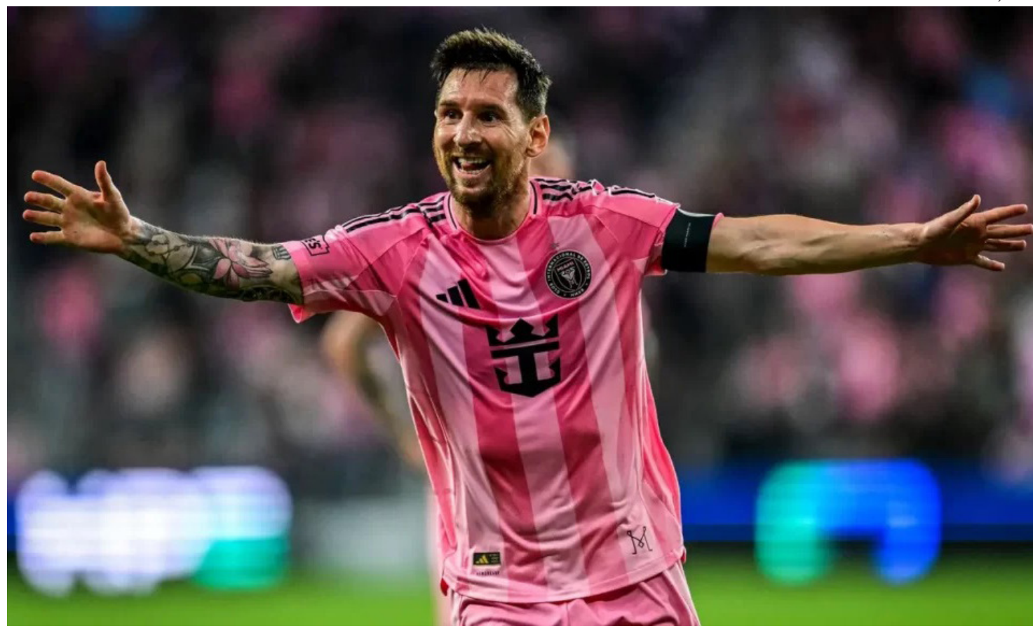
O valor dos times da MLS aumentou US$ 3,2 bilhões desde a chegada do astro argentino do futebol, Lionel Messi, a Miami

Porém, mais recentemente – sob a orientação do pai Jorge – sua carreira empresarial floresceu. Um enorme salário do atual time Inter Miami, su-