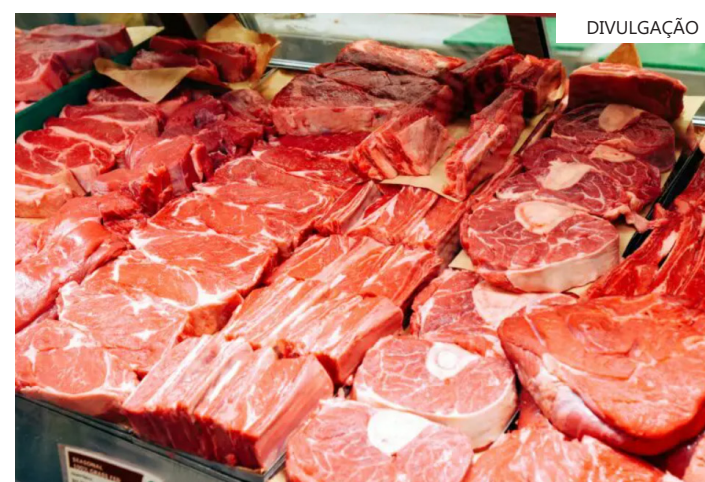
Divulgação O tema segue sendo tratado no âmbito técnico entre Brasil e China, com vistas à rápida normalização da situação

A substância, utilizada como medicamento veterinário, é proibida na China.