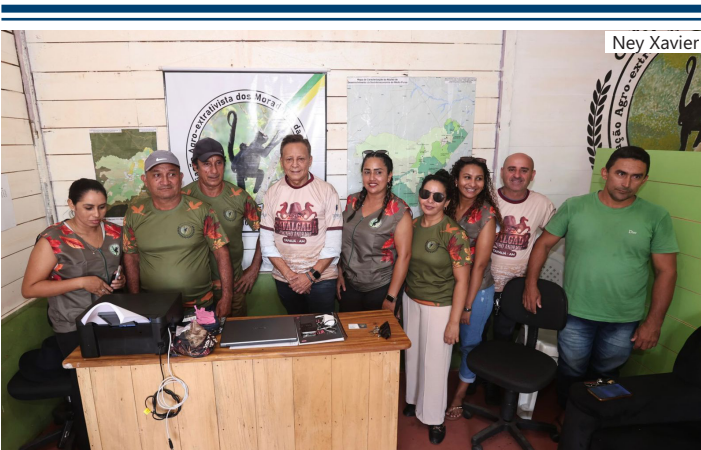
Agenda institucional no município de Tapauá

Durante a reunião, o deputado Adjuto ouviu demandas relacionadas à logística, incentivo à produção e valorização do extrativismo sustentável. "O homem e a mulher da floresta precisam ser tratados com dignidade e respeito. O extrativismo sustentável é uma riqueza do Amazonas e deve receber apoio técnico, estrutura e incentivo para que essas famílias possam crescer sem abandonar suas raízes", destacou o presidente em exercício da Aleam.