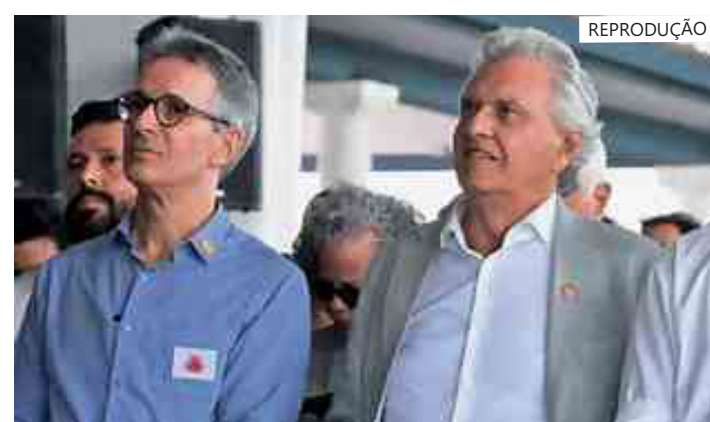
Romeu Zema (Novo) e Ronaldo Caiado (PSD-GO)

A resposta do campo bolsonarista foi imediata. Carlos Bolsonaro escreveu nas redes sociais que o "engolidor de casca de banana está passando de todos os limites", em referência a um vídeo em que Zema comeu uma banana sem retirar a casca. Eduardo Bolsonaro também criticou Zema, afirmando que ele "se aproveita e larga a acusação sem fundamento, sem nem ouvir o outro lado".