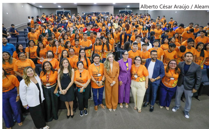
"Maio Laranja" é a campanha nacional de mobilização ao combate ao abuso e exploração de crianças e adolescentes