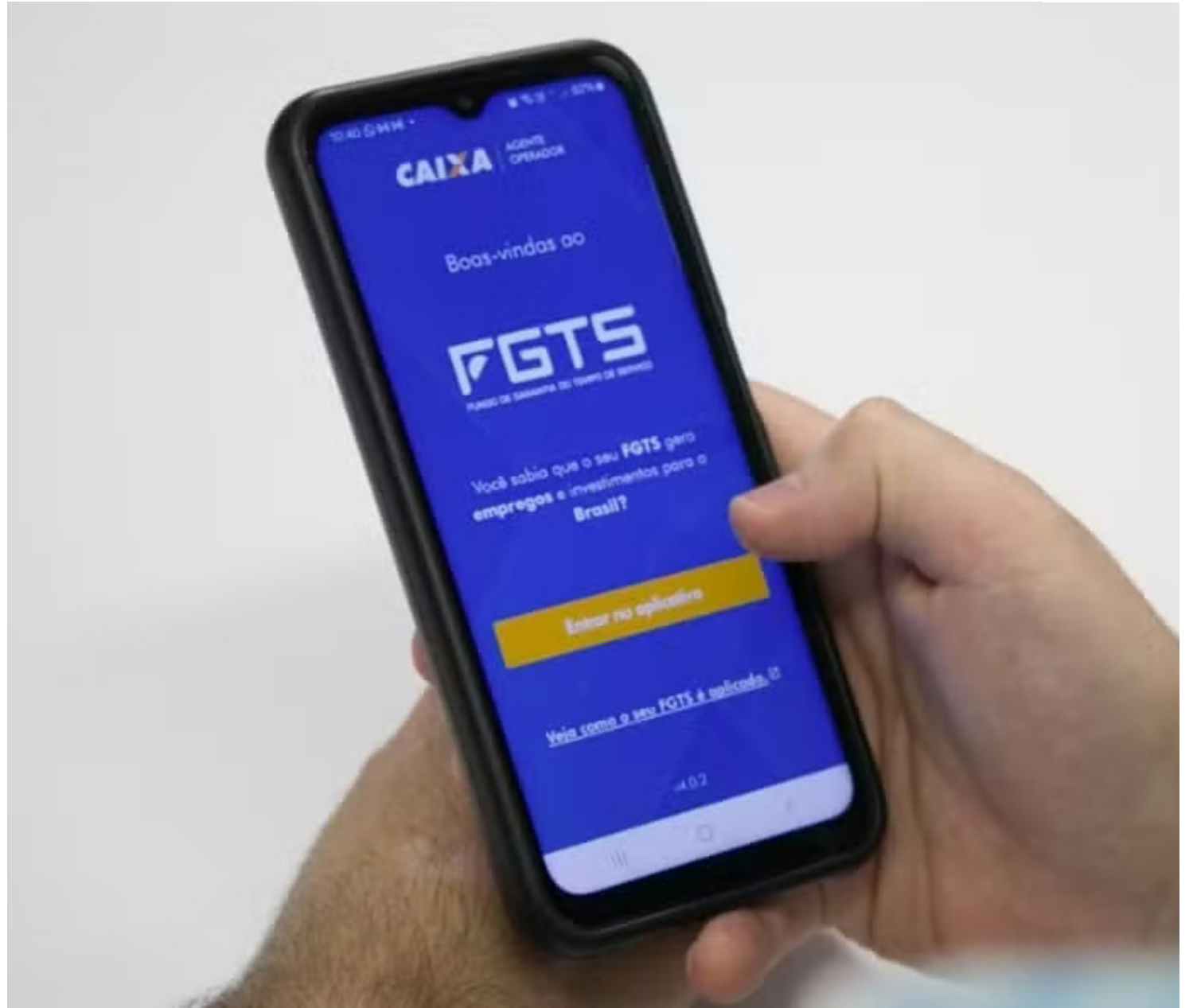
Governo federal espera uma saída de até R$ 8,2 bilhões do fundo para o programa

O governo federal espera uma saída de até R$ 8,2 bilhões do FGTS para o programa. A Caixa está finalizando a integração dos sistemas e iniciando os testes operacio-