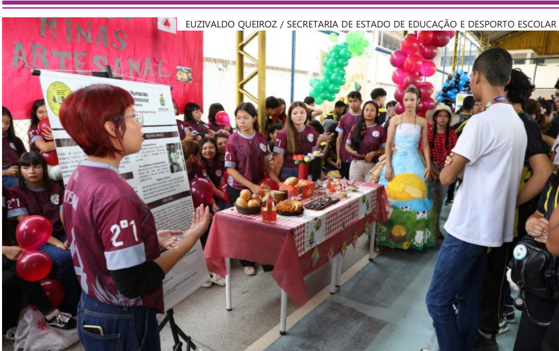
EUZIVALDO QUEIROZ / SECRETARIA DE ESTADO DE EDUCAÇÃO E DESPORTO ESCOLAR