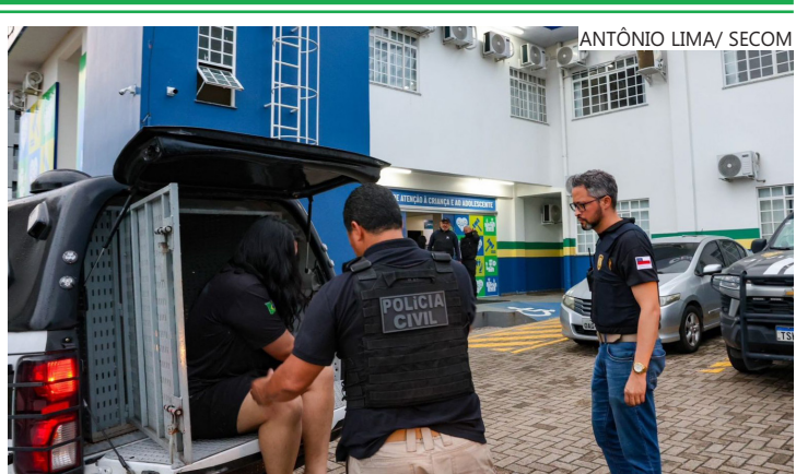
Ação do Dia D marcou mobilização nacional de combate à exploração sexual infantil

As ações foram conduzidas de forma integrada pelas Forças de Segurança, reunindo efetivos da Polícia Civil e da Polícia Militar em uma mobilização simultânea na capital e no interior.