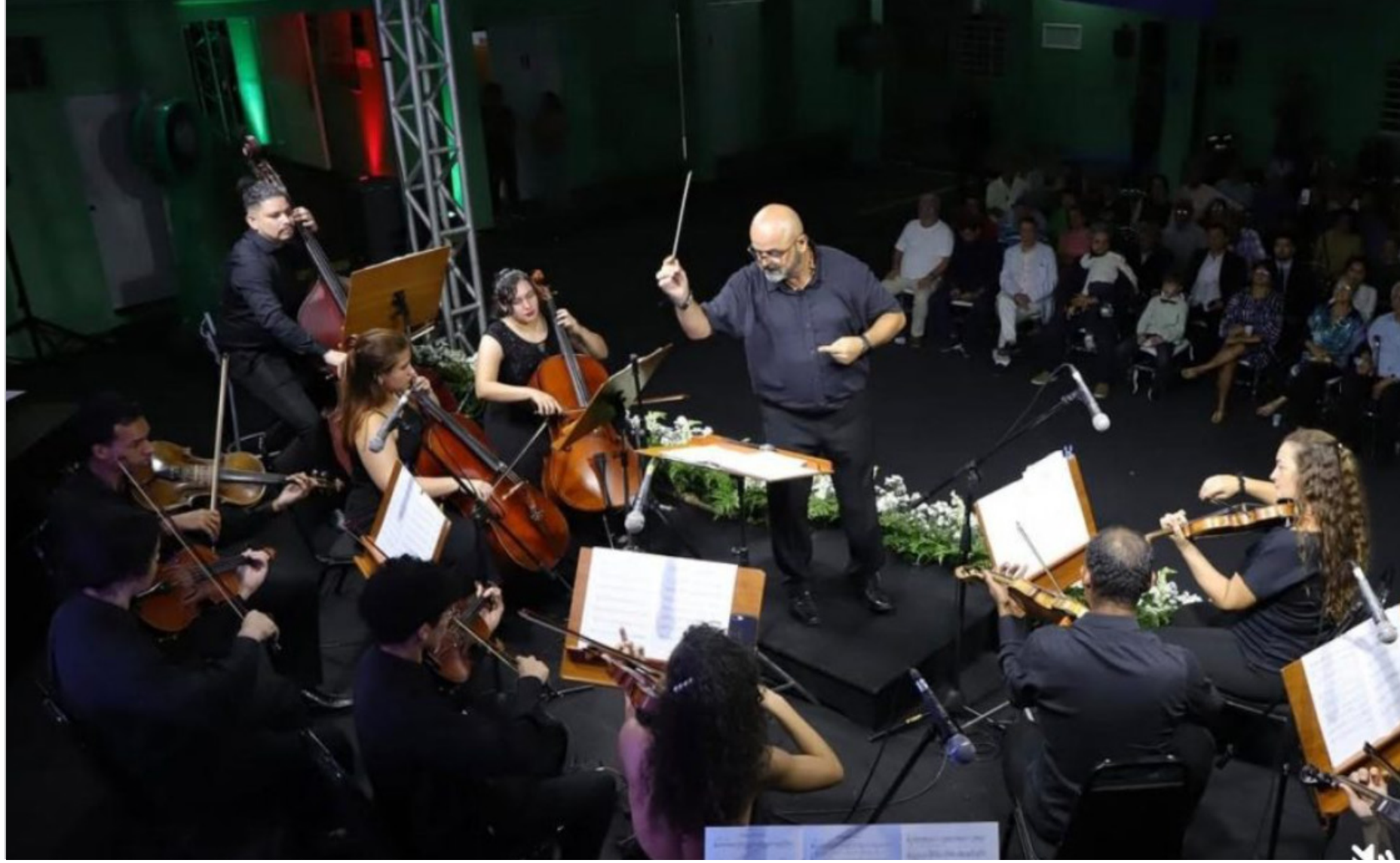
Espectáculo 'Música Brasileira para Orquestra' acontece nesta sexta-feira (15/05)