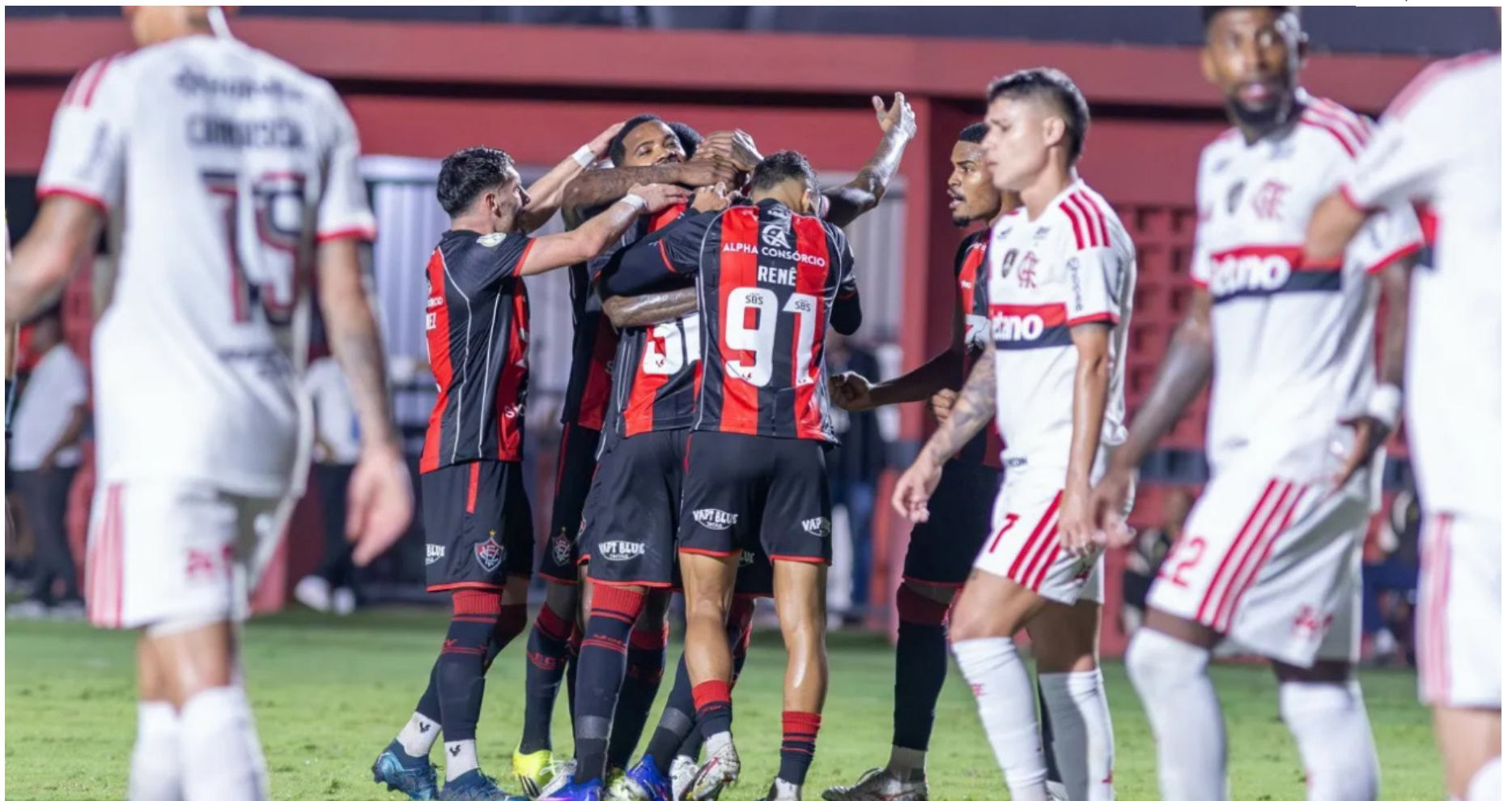
Vitória está nas oitavas de final da Copa do Brasil

Na sequência, Samuel Lino ficou com a posse, entrou na área e puxou para o pé direito, mas mandou para fora após desvio no meio