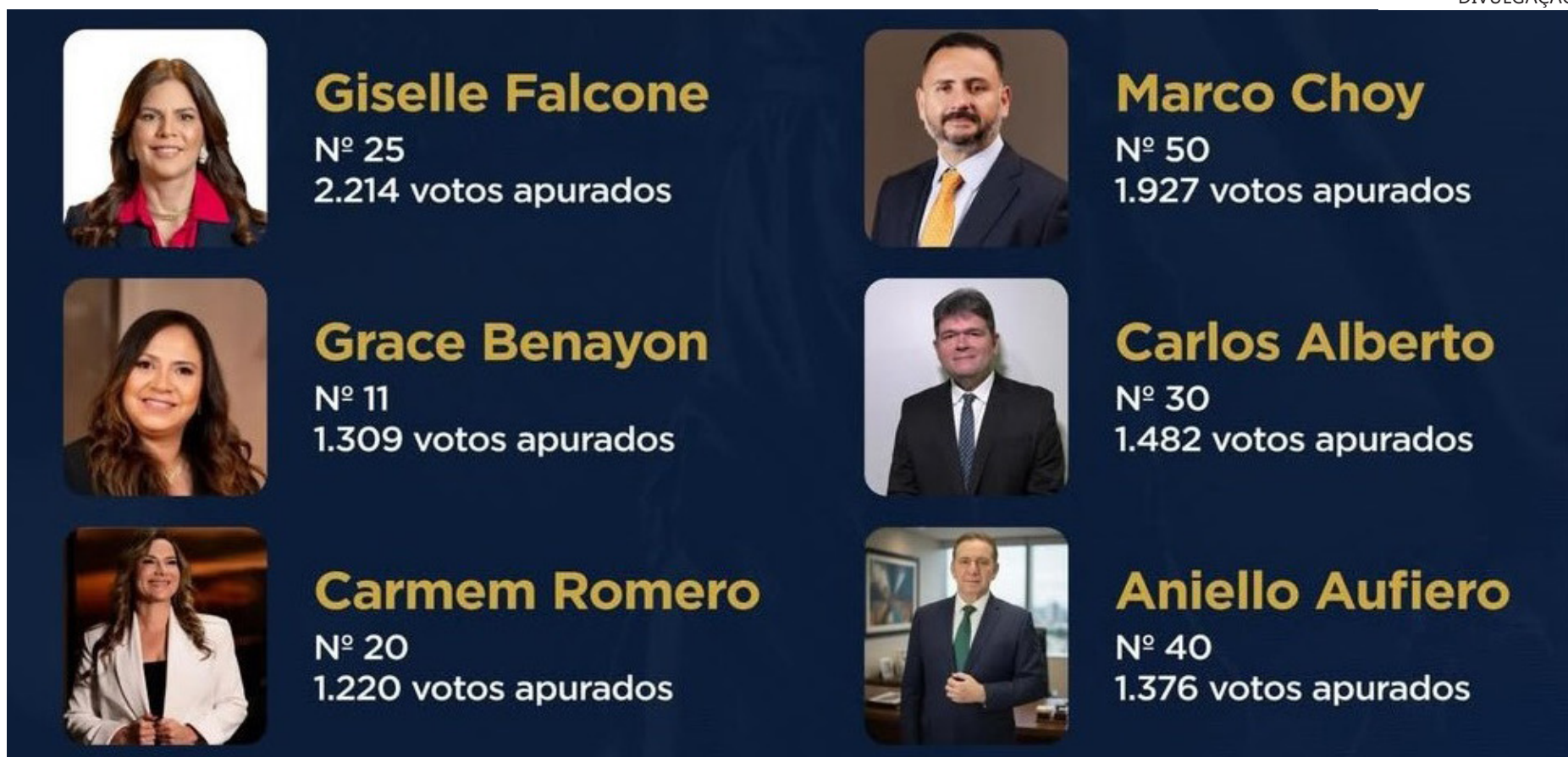
Foram escolhidos os seis nomes que vão seguir na disputa pela vaga de desembargador do Tribunal de Justiça do Amazonas