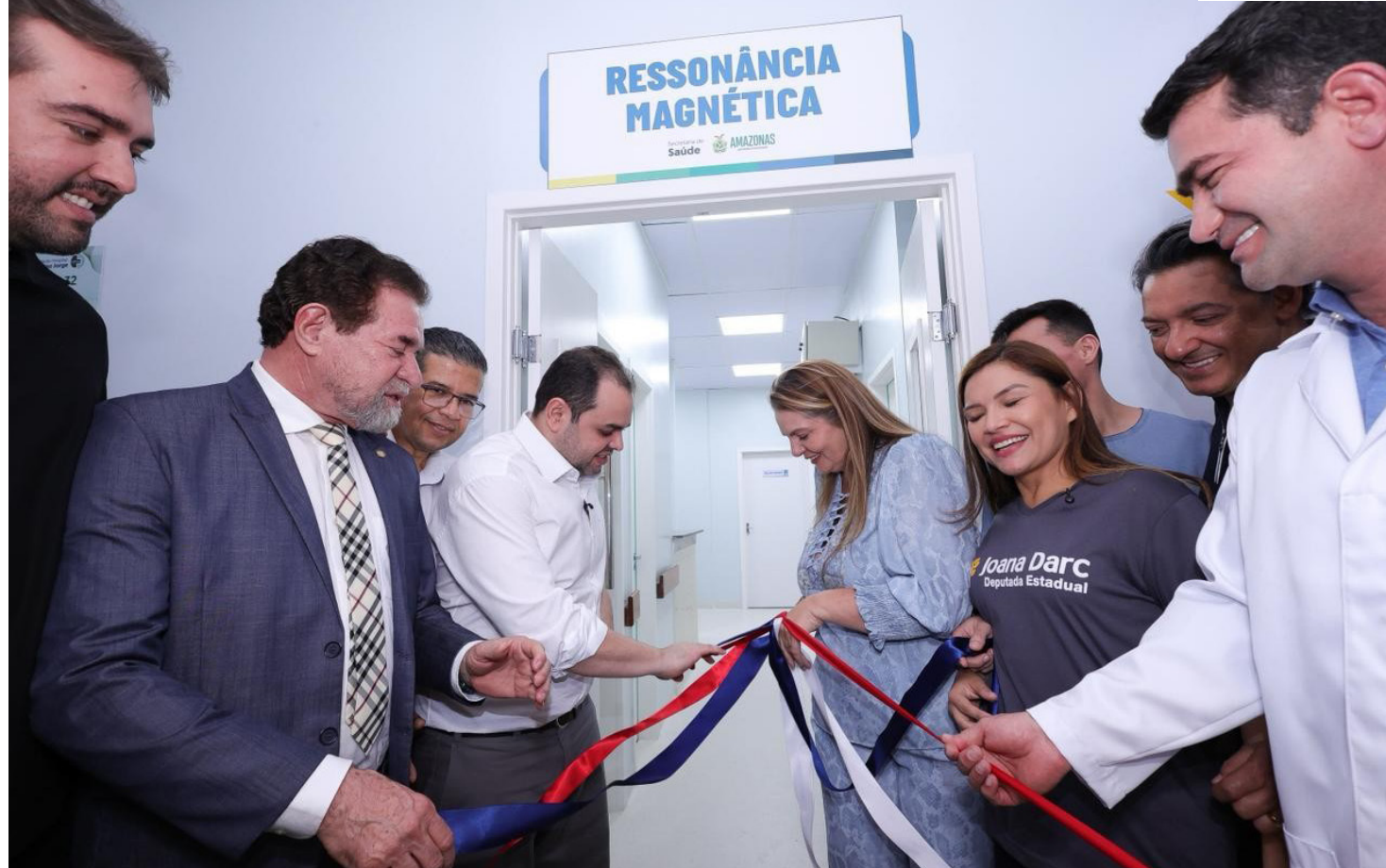
Serviço de Ressonância Magnética da Fundação Hospital Adriano Jorge (FHAJ)

A implantação do novo serviço integra um conjunto de investimentos realizados pelo Governo do Amazonas,