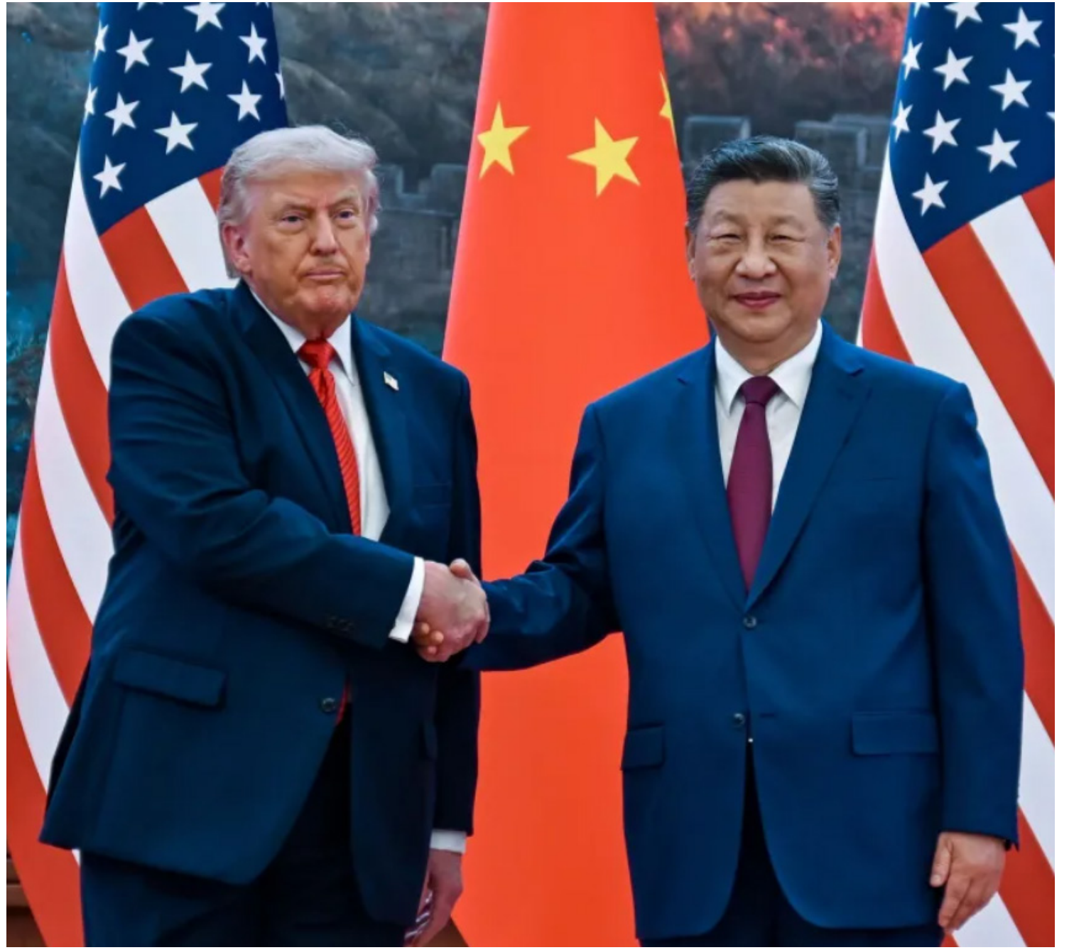
O presidente dos EUA, Donald Trump, é recebido pelo presidente chinês, Xi Jinping, no Grande Salão do Povo, em 14 de maio de 2026, em Pequim, China

A cúpula Xi-Trump tem como objetivo fechar acordos sobre produtos agrícolas e aeronaves, além de manter uma frágil trégua na guerra comercial entre as duas maiores economias do mundo. A viagem estava originalmente planejada para o final de março, mas foi adiada devido à guerra dos EUA e de Israel contra o Irã.