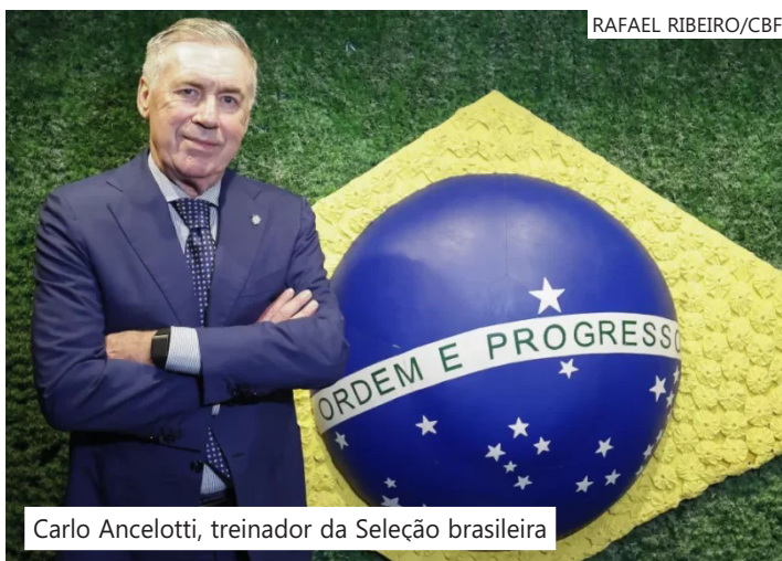
Carlo Ancelotti, treinador da Seleção Brasileira