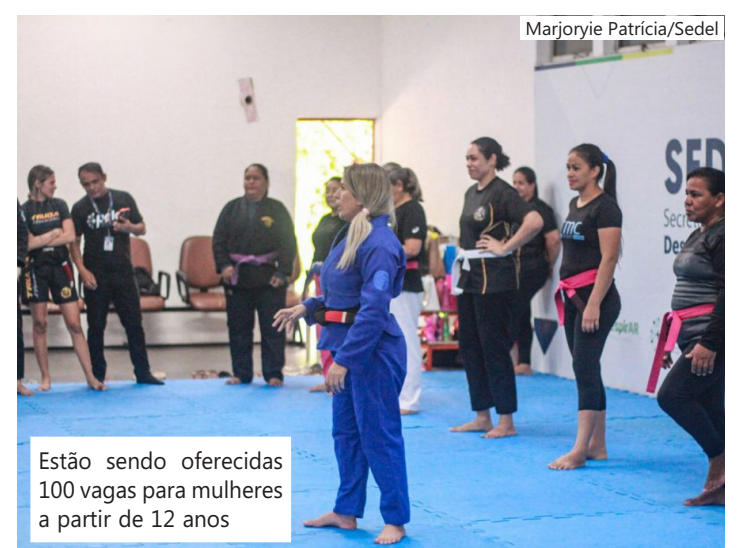
Estão sendo oferecidas 100 vagas para mulheres a partir de 12 anos

Criado em 2023, o curso integra o Projeto Formando Campeões, vinculado ao Programa Esporte e Lazer na Capital e Interior (Pelci), e já ultrapassou a marca de 5 mil de mulheres atendidas em Manaus e no interior do estado. A iniciativa também conta com núcleos fixos e participação em ações como o projeto Vila Aberta Para Todos, ampliando o acesso da população às atividades.