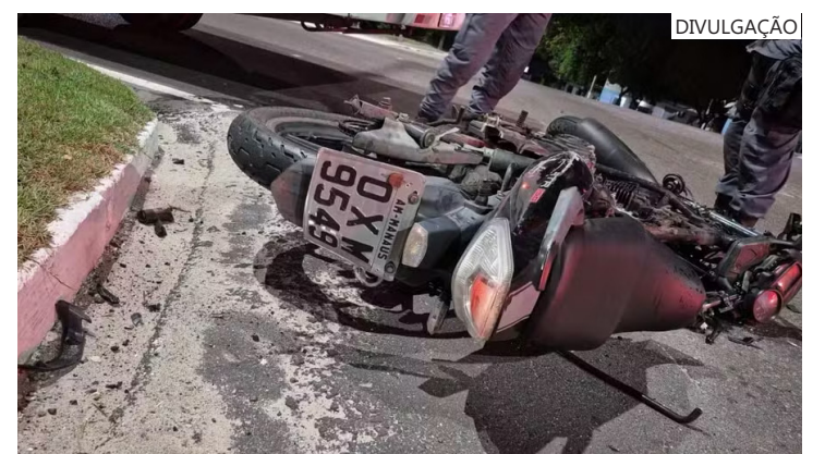
De acordo com o Boletim Epidemiológico de Mortalidade, o estado registrou 275 mortes de motociclistas em 2025

Segundo ele, o objetivo é reforçar o uso de equipamentos de proteção e combater comportamentos imprudentes no trânsito.