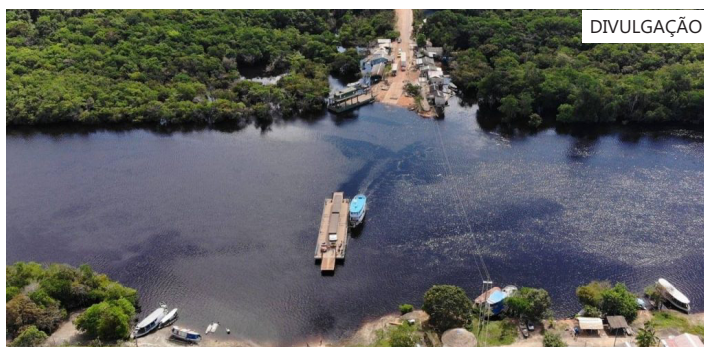
Estrutura vai viabilizar construção da ponte sobre o rio Igapó-Açu, onde travessia ainda é feita por balsa

O Instituto de Proteção Ambiental do Amazonas (Ipaam) emitiu, nesta quinta-feira (14/05), licença de instalação para a Construtora Etam Ltda implantar o canteiro de obras da construção da ponte sobre o rio Igapó-Açu, no quilômetro 268 da BR-319, no município de Borba (a 151 quilômetros de Manaus), no chamado “trecho do meio” da rodovia, considerado um dos mais desafiadores e estratégicos para a trafegabilidade.