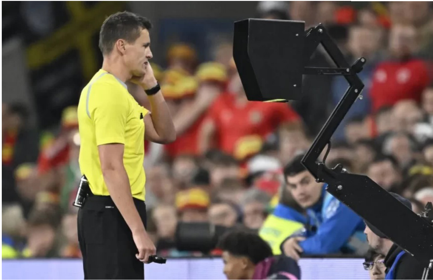
Árbitro consultando VAR em partida qualificatória para a Copa do Mundo de 2026

sistema processa mais de 2 mil métricas por partida e utiliza milhares de conexões de dados para reconstruir o posicionamento das equipes em campo. A proposta é oferecer aos treinadores e analistas um ambiente capaz de simular cenários estáticos e identificar padrões de jogo com maior precisão.