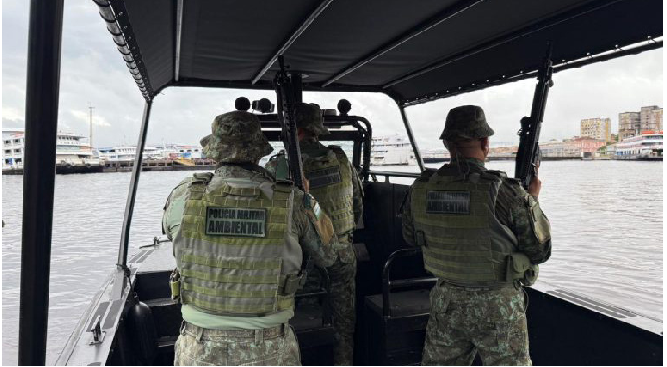
Após o festival, a base se guirá para o município de Japurá