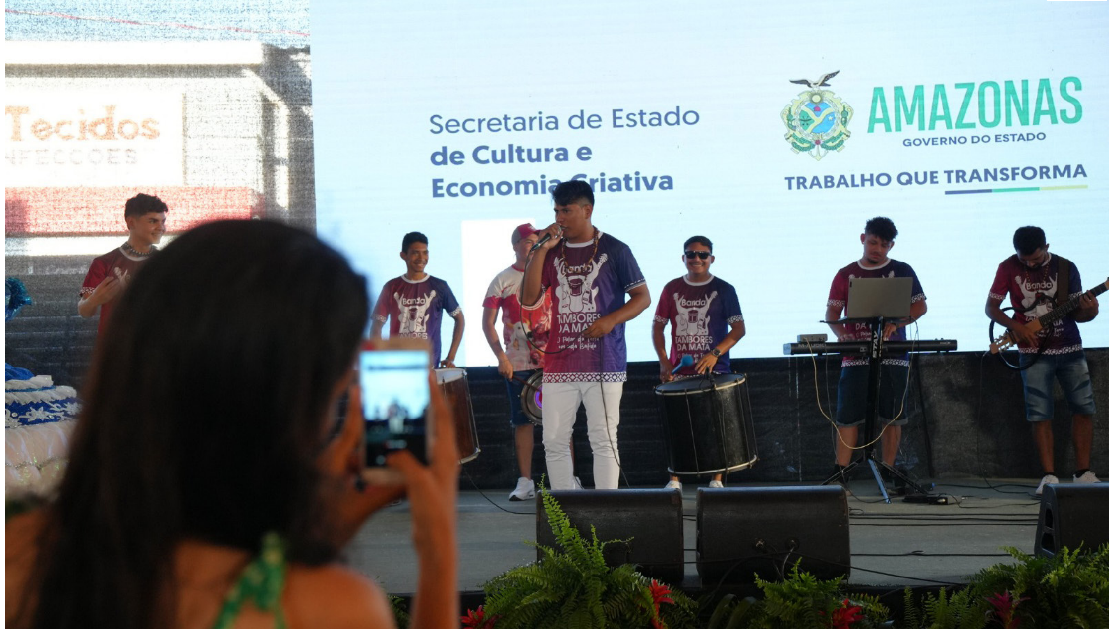
A cantata cênica "Carmina Burana" segue em cartaz até domingo (14/04) no Teatro Amazonas

Programação do Circuito Cultural do 59º Festival de Parintins contará com apresentações de estudantes do Liceu de Artes e Ofícios Claudio Santoro