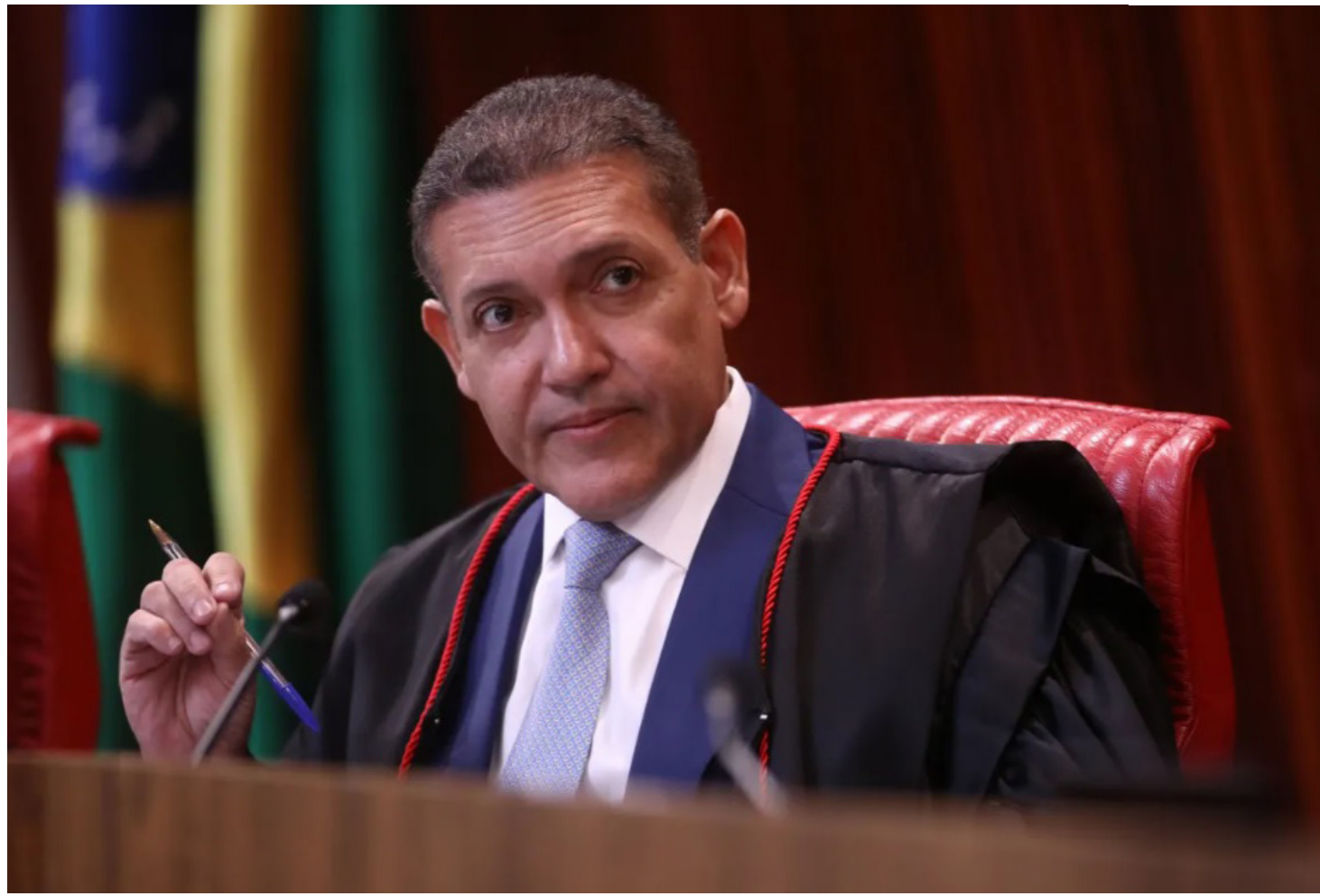
Ministro Nunes Marques, novo presidente do TSE

Nunes Marques afirmou haver, de fato, indícios de que a metodologia empregada na pesquisa poderia ter contaminado as respostas dos eleitores.