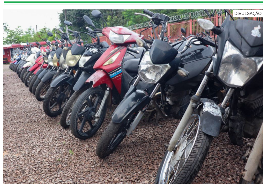
Ao todo, estarão disponíveis 223 veículos neste certame, a ser realizado na segunda-feira (15/06)

Para mais detalhes, basta acessar o site institucional do Detran-AM ( detran.am.gov.br ), clicar em "Acesso à informação", "Publicações", em seguida aba Leilões, e por fim, acessar o "Edital de Chamamento Público 02/2026".