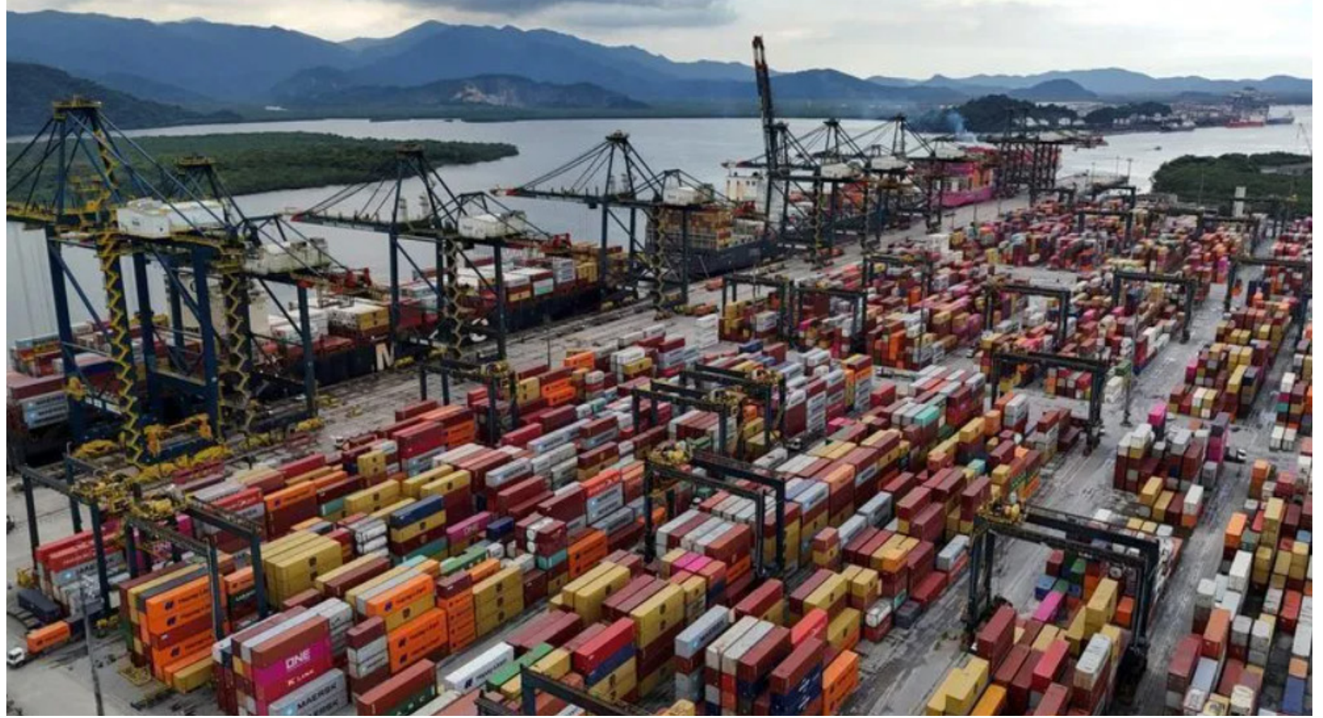
Vista de drone mostra navios e contêineres no Porto de Santos

Entre as autorizações obtidas estão a exportação de sêmen de pacu-caranha para a Argentina, couro bovino salgado para a Bolívia, material genético bovino para El Salvador e Honduras, milho pipoca para o Equador e a República Dominicana, além de sementes de coco, mamona, maracujá e pimen-