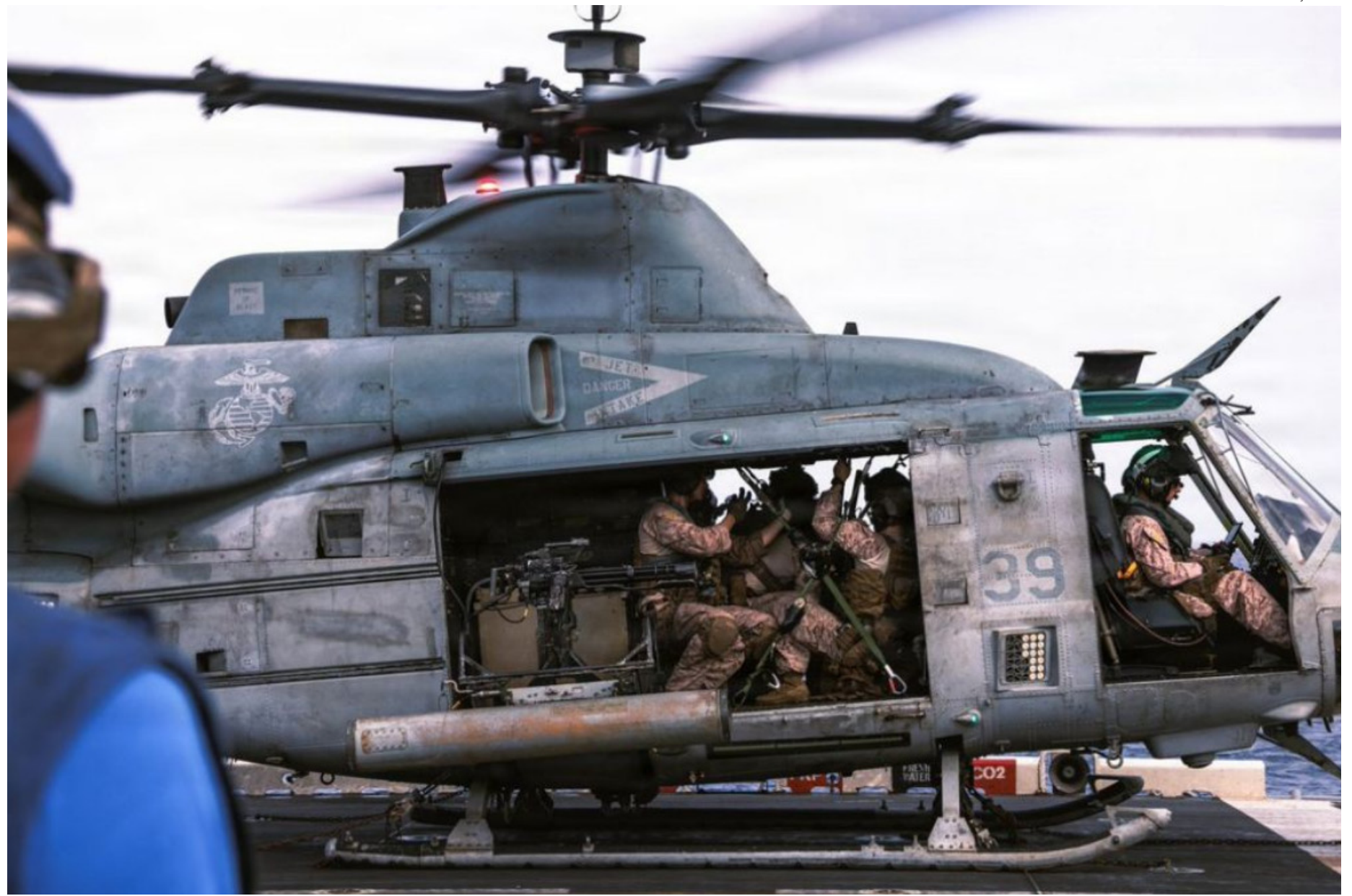
Ofensiva acontece após Trump acusar Teerã de derrubar um helicóptero do Exército Americano

"Acabei de ser informado por nossas Forças Armadas que, na noite passada, os iranianos abateram um de nossos sofisticados helicópteros Apache enquanto patrulhava