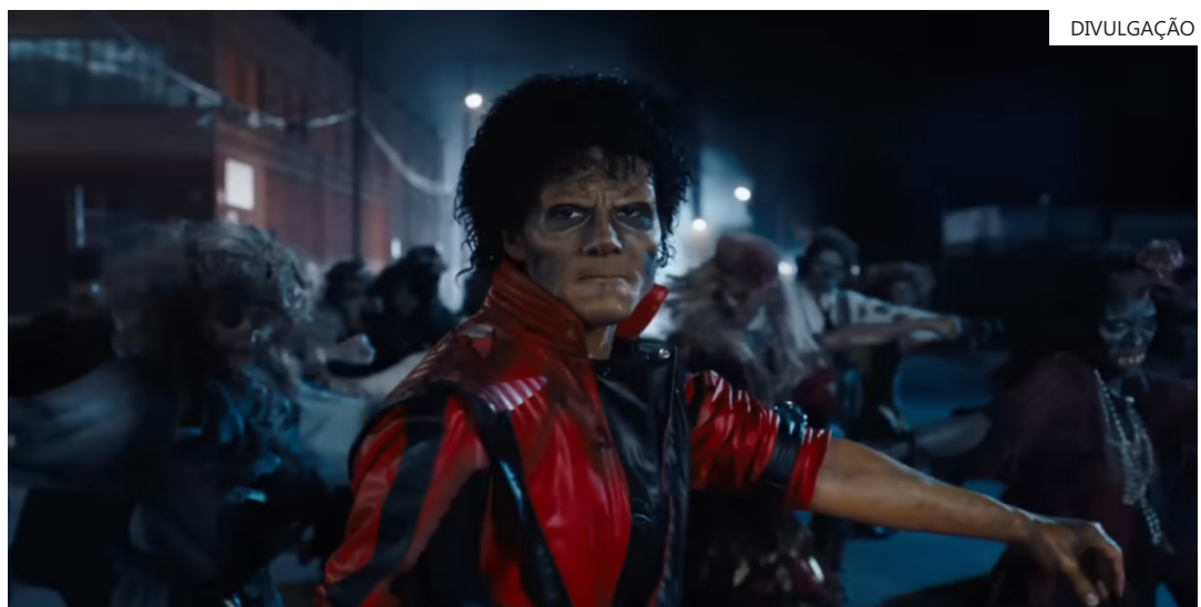
Cinebiografia de Michael Jackson, intitulada "Michael"

milhões "Avatar: Fogo e Cinzas" – R$ 76,6 milhões "Zootopia 2" – R$ 61,4 milhões "Devorados de Estrelas" – R$ 48 milhões "Pânico 7" – R$ 33,9 milhões "Cara de Um, Focinho de Outro" – R$ 28,7 milhões "O Agente Secreto" – R$ 26,3 milhões