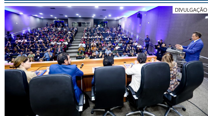
1º Seminário Estadual sobre o ECA Digital