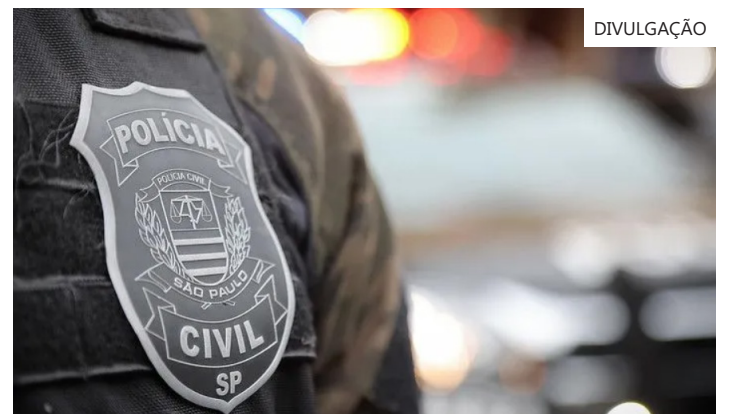
Delegacia de Investigação Sobre Entorpecentes é unidade especializada da Polícia Civil focada exclusivamente no combate ao tráfico de drogas