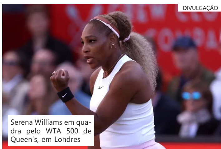
Serena Williams em quadra pelo WTA 500 de Queen's, em Londres

Mas quando perdeu para Ajla Tomljanovic na terceira rodada do US Open, em setembro de 2022, e se despediu de forma emocionante, poucos imaginavam que ela retornaria para escrever mais um capítulo de uma história esportiva que inspirou milhões de pessoas.