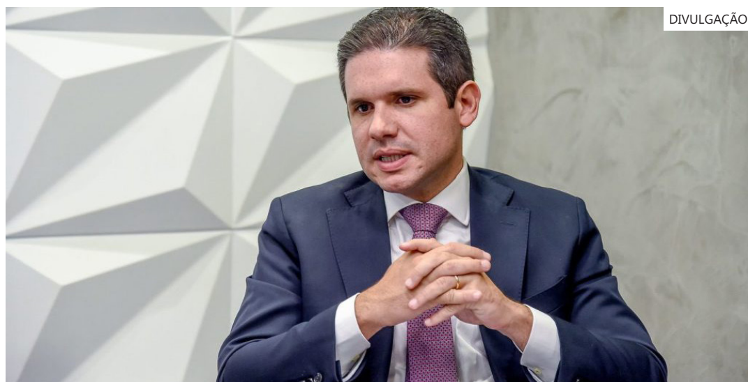
Presidente da Câmara, Hugo Motta