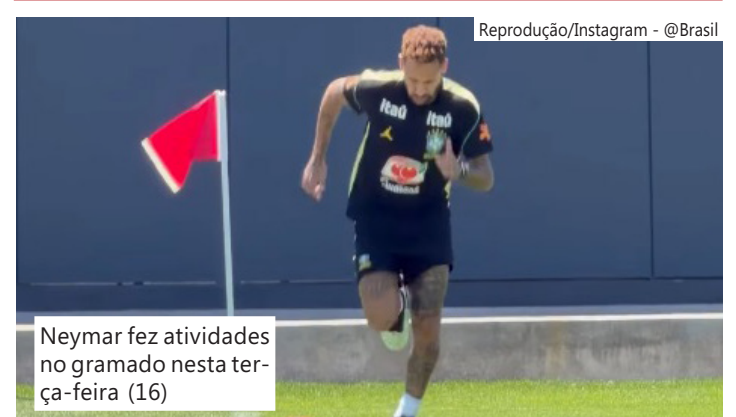
Neymar fez atividades no gramado nesta terça-feira (16)

Neymar está lesionado desde o dia 17 de maio, após partida contra o Coritiba pelo Campeonato Brasileiro. Amanhã, a lesão do craque completa um mês.