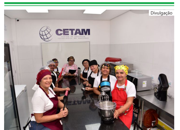
O período de inscrições on-line ocorrerá das 7h do dia 17 até às 23h59 do dia 18 de junho

A abertura das vagas marca o início das atividades na Escola de Educação Profissional da Compensa, que representa a sétima unidade do Cetam instalada na capi-