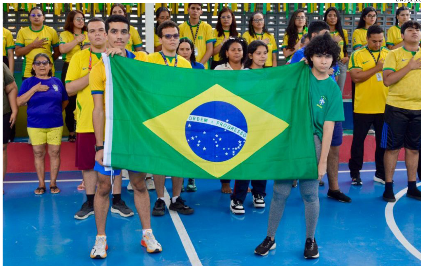
1ª Copa TEA

As atividades foram planejadas para estimular habilidades essenciais à convivência em grupo, como comunicação, cooperação, respeito às regras e trabalho em equipe, contribuindo para o