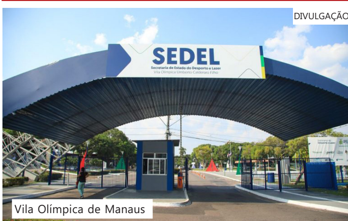
Vila Olímpica de Manaus

A expansão da Vila Aberta para Todos reforça a política do Governo do Amazonas de democratizar o acesso ao esporte e incentivar hábitos saudáveis, consolidando a Vila Olímpica de Manaus como um dos principais centros de esporte, lazer e cidadania do estado.