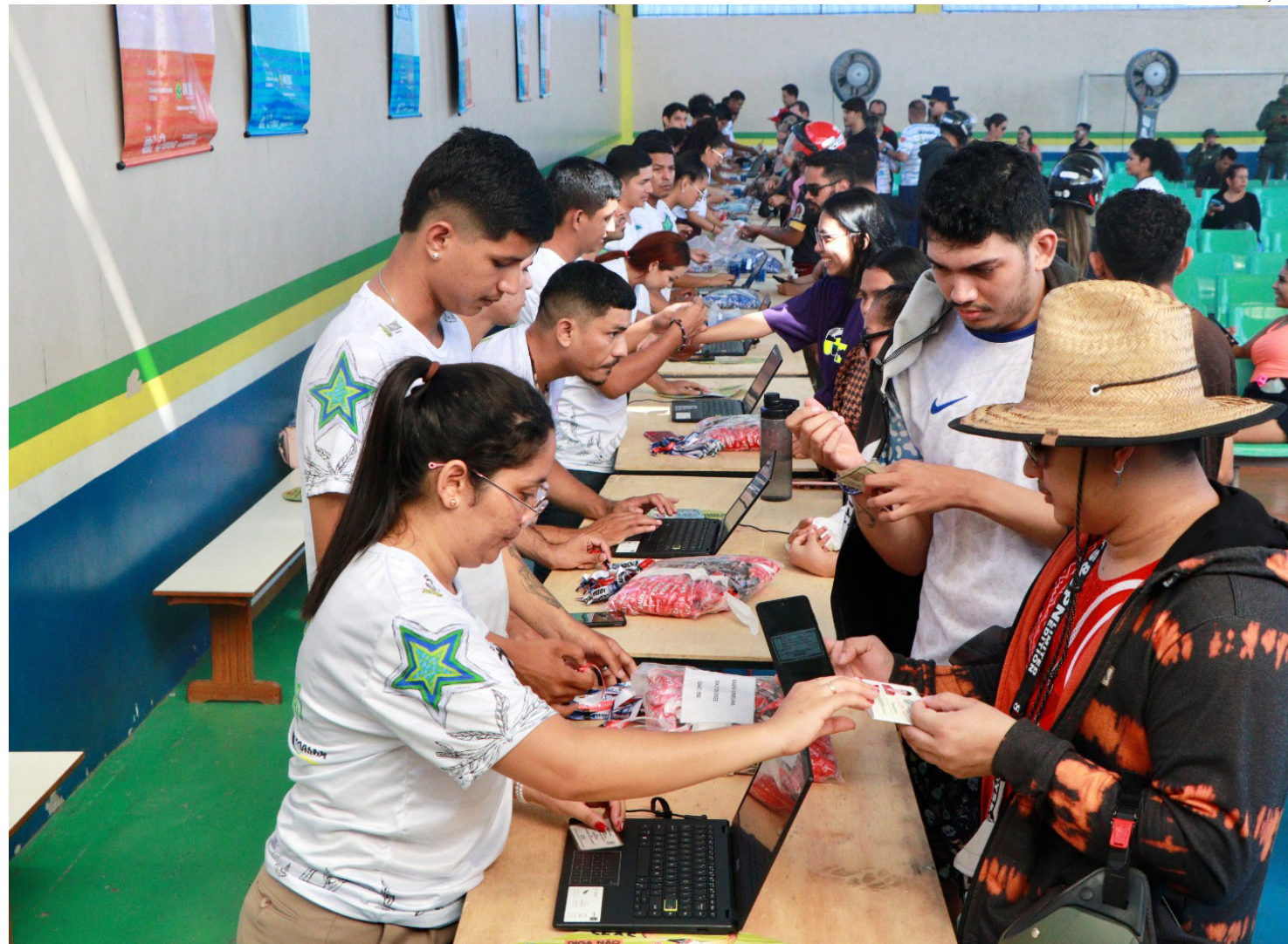
Festa dos Visitantes 2026 terá 24 mil pulseiras gratuitas, com troca de ingressos por alimentos não perecíveis

Ao todo, serão disponibilizadas 24 mil pulseiras. Cada pulseira contará com um QR Code exclusivo vinculado ao CPF do participante, impedindo duplicidade de acesso e garantindo maior segurança