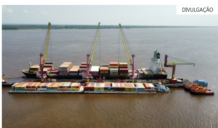
As transações comerciais do Amazonas fecharam o mês de maio com uma movimentação de US$ 1,79 bilhão

Comexstat A "Balança Comercial do Amazonas" é um estudo produzido pelo Departamento de Estatística e Geoprocessamento (Degeo) da Secretaria Executiva de Planejamento (Seplan) da Sedecti, com dados do ComexStat, que é o sistema oficial do governo brasileiro para consulta e extração de dados e estatísticas do comércio exterior, mantido pelo Ministério do Desenvolvimento, Indústria, Comércio e Serviços (MDIC).