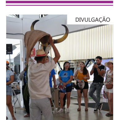
Em 2026, as visitas guiadas serão realizadas entre os dias 24 e 28 de junho, mediante agendamento prévio

As visitas serão organizadas em grupos de até 40 pessoas, distribuídos em quatro horários: das 9h às 9h40, das 9h40 às 10h20, das 10h20 às 11h e das 11h às 11h40.