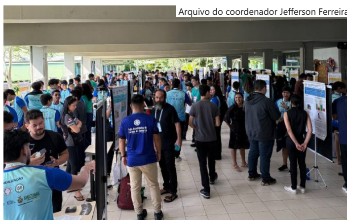
A iniciativa é amparada pelo programa Parev, da Fapeam