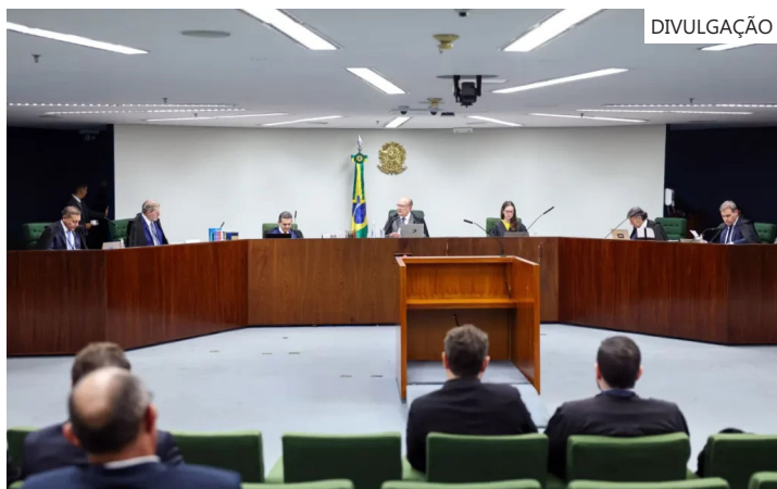
Sessão da Segunda Turma no STF

O relator das investigações sobre o Banco Master refutou a comparação feita por Gilmar da condução deste caso com a Lava Jato. Mendonça afirmou que não age "por pressões da mídia e não busca a mídia", em resposta ao colega, que havia mencionado "espetacularização" e "sensacionalismo" em seu voto sobre o tema.