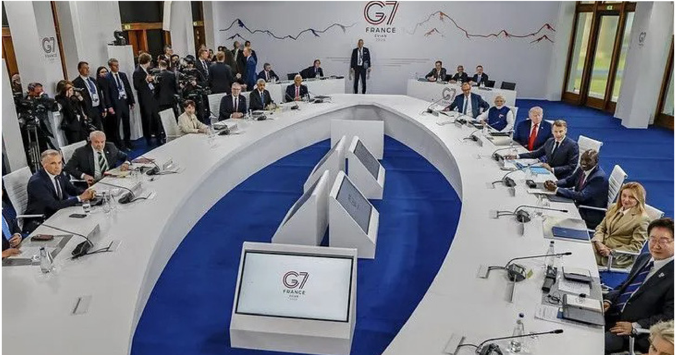
Presidente brasileiro criticou unilateralismo e defendeu respeito à soberania dos países nas políticas de combate ao narcotráfico e crime transnacional