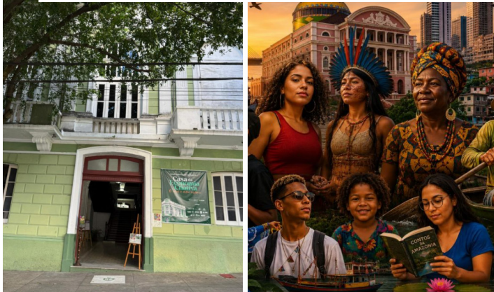
Programação cultural une poesia falada, desfiles de moda e gastronomia nativa na avenida Eduardo Ribeiro, com entrada gratuita