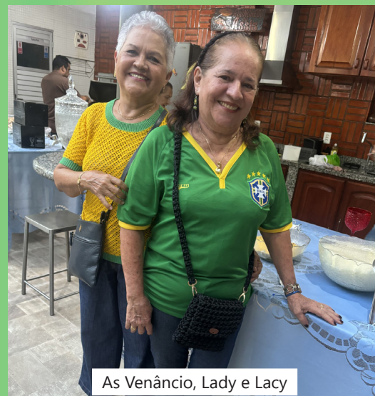
As Venâncio, Lady e Lacy