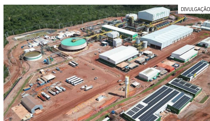
Rare Earths Americas contratou a Hatch para avaliar plano inicial de lavra, metalurgia, infraestrutura, licenciamento e economia do projeto Alpha

A empresa afirma que neodímio, praseodímio, disprósio e térbio representam mais de 24% dos óxidos contidos no projeto. Esses elementos são usados na cadeia de ímãs permanentes de alto desempenho, com aplicações em veículos elétricos, turbinas eólicas, defesa, eletrônicos e robótica.