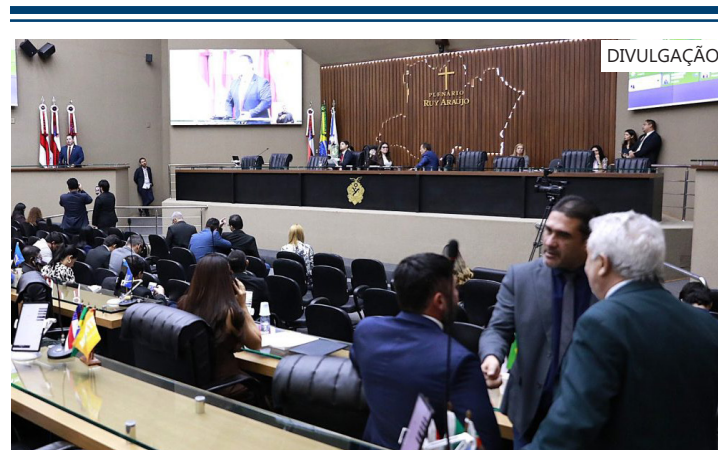
Sessão Ordinária realizada na manhã desta terça-feira (16/6)

A parlamentar, que também preside a Comissão do Idoso da Aleam, informou que participou, na segunda-feira (15/6), do lançamento da campanha nacional de combate à violência contra a pessoa idosa, promovida pelo Ministério da Justiça.