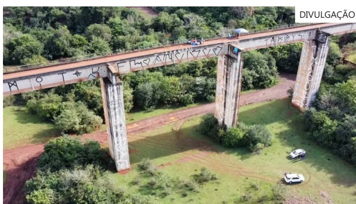
Ponte do Esqueleto, em Limeira

Anteriormente, a Prefeitura de Limeira havia informado que necessitaria o Governo Federal, alegando omissão, já que seriam exclusivamente responsáveis pela fiscalização, manutenção e controle de acesso à ponte.