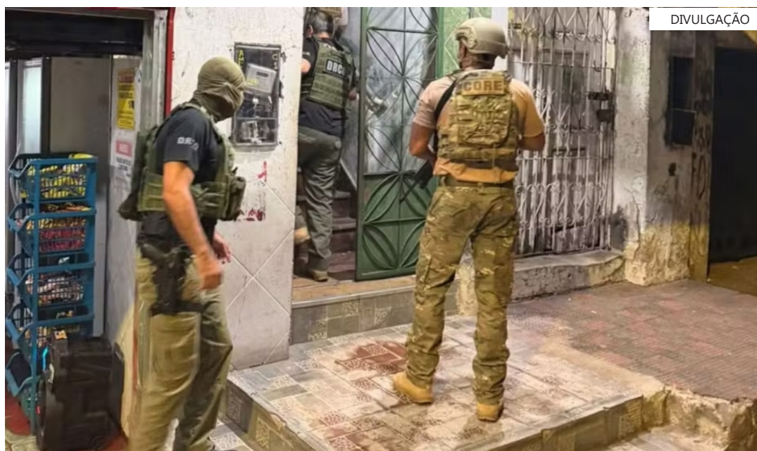
Na capital, a Polícia Civil do Amazonas cumpriu três mandados de prisão preventiva. Outros dois suspeitos foram presos em Tabatinga

De acordo com a Polícia Civil, o Tren de Aragua também usava transações com criptomoedas para esconder e lavar dinheiro obtido com tráfico de drogas e comércio ilegal de armas.