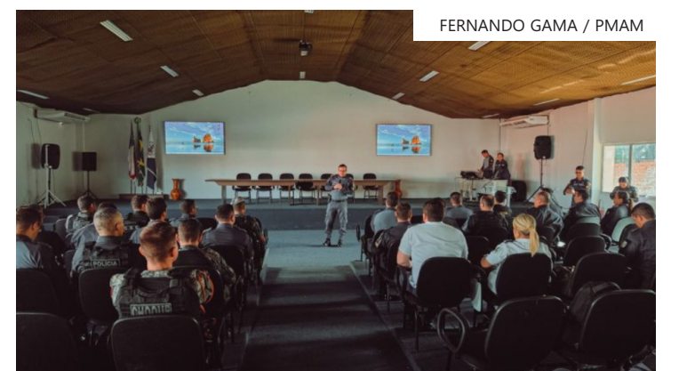
Corporação intensifica planejamento para garantir a tranquilidade de moradores e turistas durante o festival

e apoio operacional que serão empregadas antes e durante o evento. De acordo com o comandante-geral da PMAM, coronel PM Klinger Paiva, a reunião foi fundamental para alinhar os últimos detalhes do planejamento da Operação Parintins 2026. Durante a cerimônia, foram homenageadas as Unidades Destaque, que receberam o Selo CGD Bronze, reconhecimento institucional concedido às unidades que apresentaram resultados expressivos dentro da metodologia de acompanhamento do ciclo.