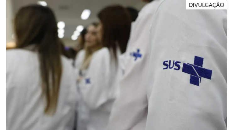
Provas serão aplicadas em 13 de setembro

Além disso, os médicos já graduados em anos anteriores interessados em usar os resultados do Enamed para acesso direto ao Exame Nacional de Residência (Enare) 2026/2027 podem se inscrever voluntariamente.