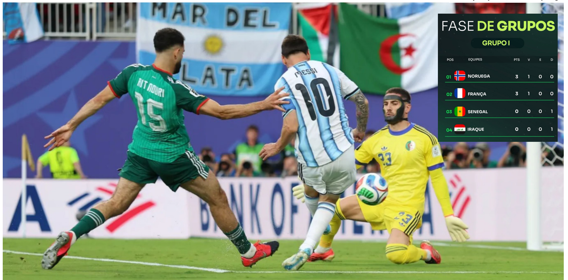
Duelo entre Argentina e Argélia, válido pela primeira rodada da Copa do Mundo

Messi marcou os três gols da vitória e, com isso, superou Pelé, Ronaldo, Mbappé e igualou o alemão Miroslav Klose com 16 gols na artilharia da história dos Mundiais. No fim do segundo tempo, ele saiu aclamado pela apaixonada torcida presente no Arrowhead Stadium, no Kansas City.