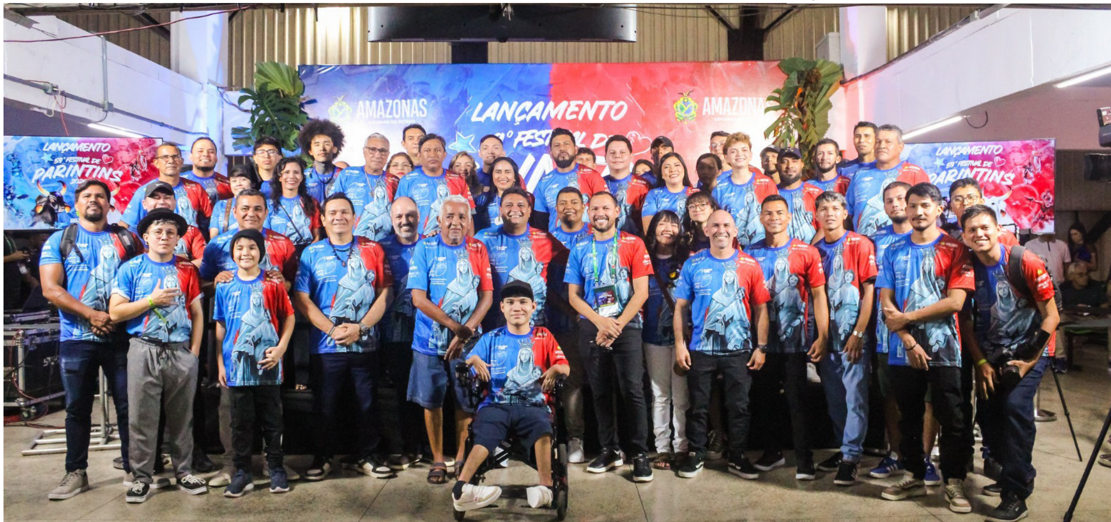
A iniciativa promove reflexões sobre ancestralidade, identidade amazônica, pertencimento e memória coletiva