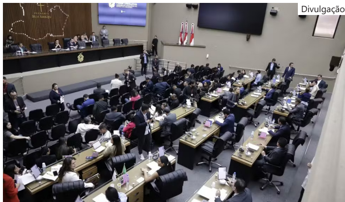
Na prática, projeto de lei transforma a atual Companhia de Operações Especiais (COE) no novo Batalhão de Operações Policiais Especiais

Na justificativa encaminhada ao Governo do Estado, o deputado argumentou que a elevação da unidade à condição de batalhão possibilitaria uma estrutura organizacional mais robusta, com maior autonomia administrativa e operacional, além de ampliar a capacidade de planejamento e execução de operações especiais.