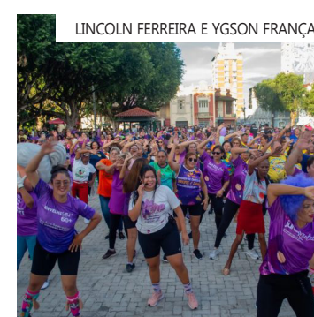
15 de junho, Dia Mundial de Conscientização da Violência contra a Pessoa Idosa.