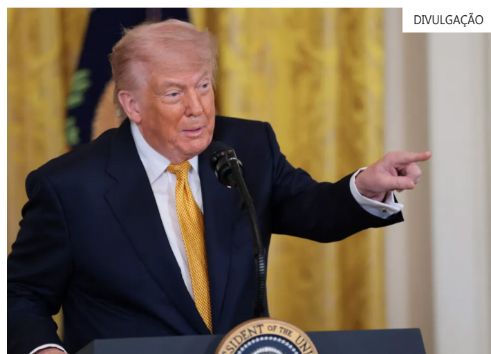
Presidente dos EUA, Donald Trump

O setor privado também aposta no impacto inflacionário que a medida pode ter para a economia americana. Porém, nada disso será determinante se o governo brasileiro não se dispuser a negociar com os Estados Unidos, relatam negociadores do setor privado.