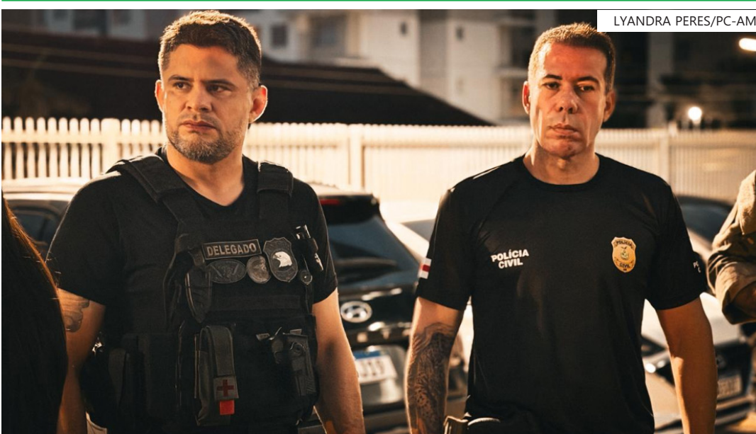
A iniciativa está alinhada ao Código de Conduta da PC-AM, documento que estabelece padrões éticos e comportamentais para instrutores da modalidade