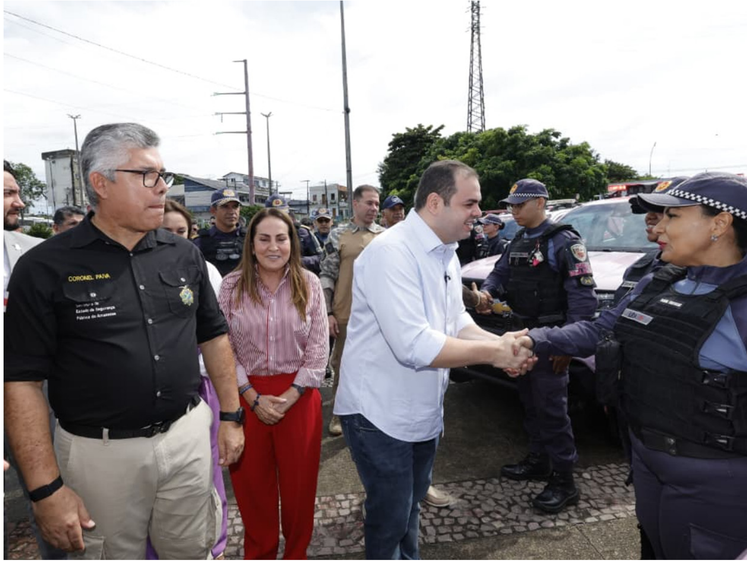
Operação Mulher Segura, iniciativa que vai reforçar e ampliar as ações de enfrentamento à violência contra a mulher em todo o Amazonas

Coordenada pela Secretaria de Estado de Segurança Pública (SSP-AM), a Operação Mulher Segura será executada no âmbito da Operação Segurança Presente, com apoio do Ministério da Justiça e Segurança Pública (MJSP), reunindo as forças de segurança e instituições parceiras em ações integradas de proteção, conscientização e combate à violência contra as mulheres.