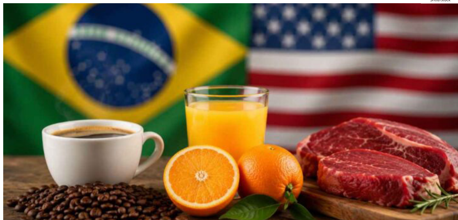
A proposta de taxa dos EUA considera como motivação atos, políticas e práticas do governo brasileiro relevantes e "passíveis de medidas legais"

A audiência sobre a ação proposta pela USTR está marcada para 6 de julho deste ano, com prazo para aplicação da "medida