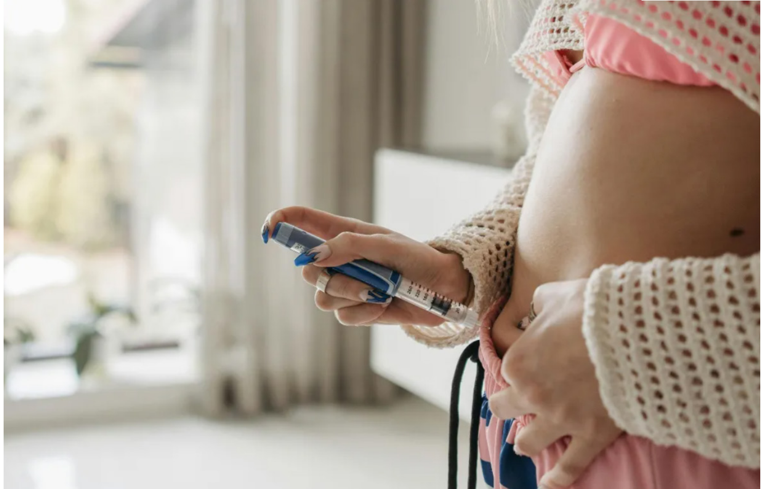
Medicamento se chama Ozivy e é uma versão sintética do mesmo princípio ativo do Ozempic

Os valores não incluem a alíquota de ICMS (Imposto sobre Circulação de Mercadorias e Serviços), que varia conforme cada estado brasileiro.