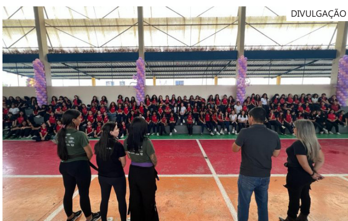
Projeto da Sedel visa empoderar estudantes e levar técnicas de segurança e prevenção ao ambiente escolar

Na tarde desta terça-feira (02/06), às alunas, que participaram do Curso de Defesa Pessoal Feminina nas Escolas receberam certificados durante a Ação Integrada da Rede de Proteção da Criança e do Adolescente do Governo do Amazonas no Ceti Gilberto Mestrinho de Medeiros Raposo.