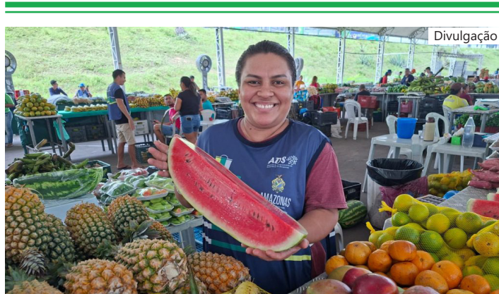
Feiras de Produtos Regionais

"A edição extra no EcoAmazônia será das 10h às 20h, nos três dias de evento, que finaliza na sexta-feira (05/06).