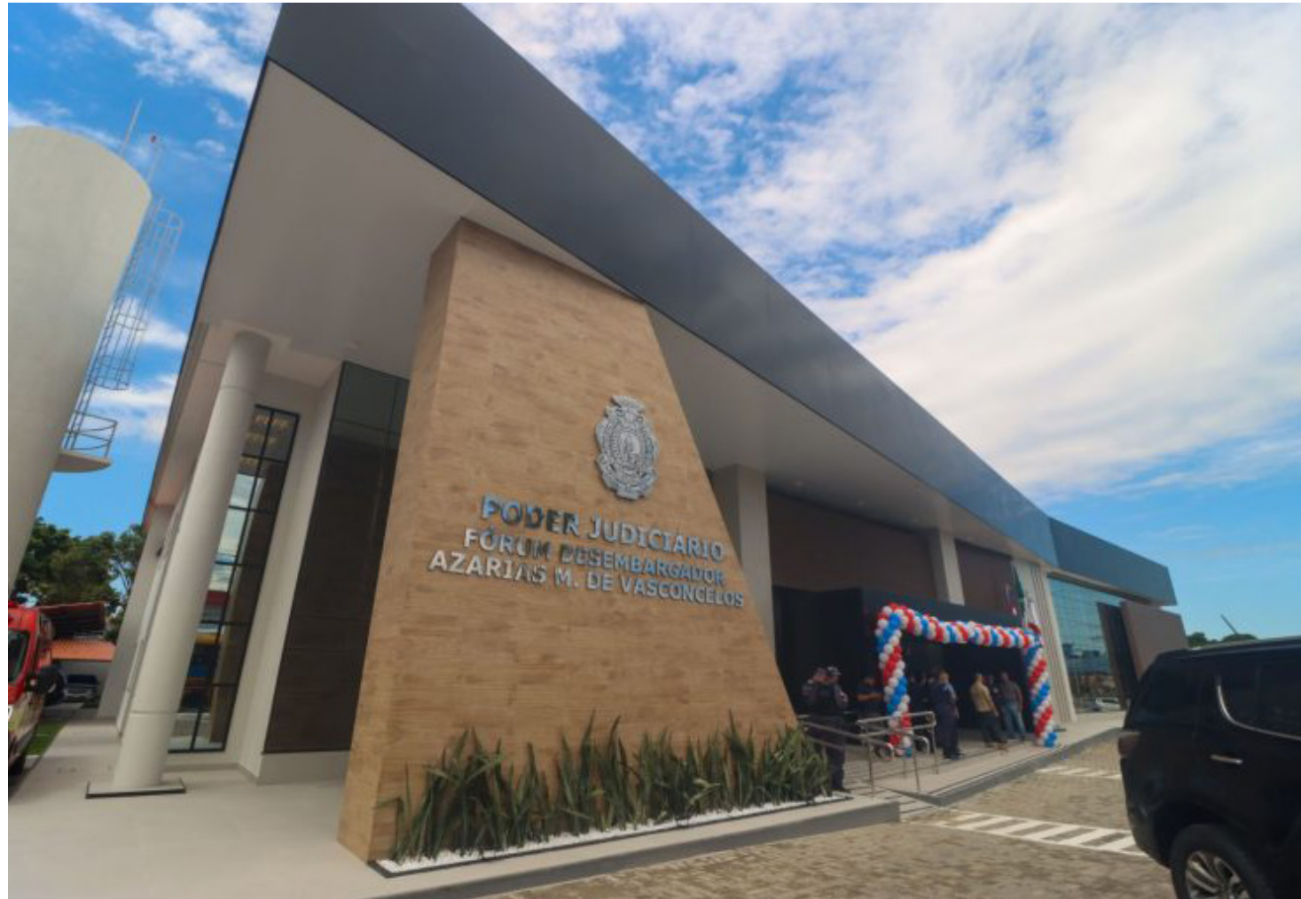
Fórum Desembargador Azarias Menescal de Vasconcelos

Durante a solenidade, o vice-governador Serafim Corrêa destacou a impor-