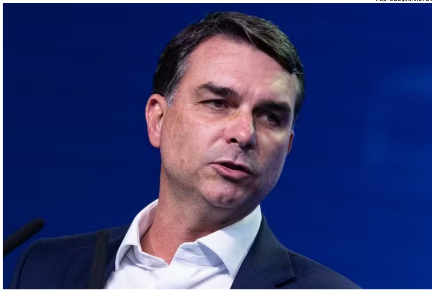
O senador Flávio Bolsonaro em entrevista à Itatiaia nesta terça (2)

"Então, não são as empresas brasileiras que estão sendo tarifadas. Quem está sendo tarifado é o presidente Lula: é ele e o seu comportamento, são as suas ameaças aos Estados Unidos e o seu sentimento anti-americano. É a sua ideologia sendo colocada na frente do interesse do povo brasileiro que pode fazer com que as empresas brasileiras sejam mais uma