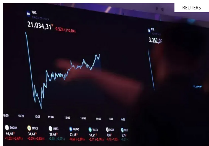
A saída líquida em maio totaliza R$ 13,27 bilhões

A forte retirada de recursos ocorre após um período de expressivas entradas de capital estrangeiro no mercado brasileiro. Somente em janeiro deste ano, o fluxo positivo alcançou R$ 26,31 bilhões, enquanto fevereiro e março registraram ingressos de R$ 15,40 bilhões e R$ 11,66 bilhões, respectivamente. De acordo com a análise da Elos Ayta, a saída observada em maio reflete uma combinação de fatores externos e domésticos.