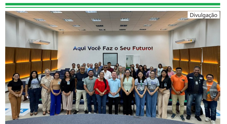
3ª Oficina de Preparação da Vigilância Hospitalar no Contexto de Eventos de Massa

A iniciativa integra as ações preparatórias da FVS-RCP para o 59º Festival de Parintins 2026, considerado um dos maiores eventos culturais do Brasil e que, anualmente, intensifica a demanda por serviços de saúde no Amazonas.