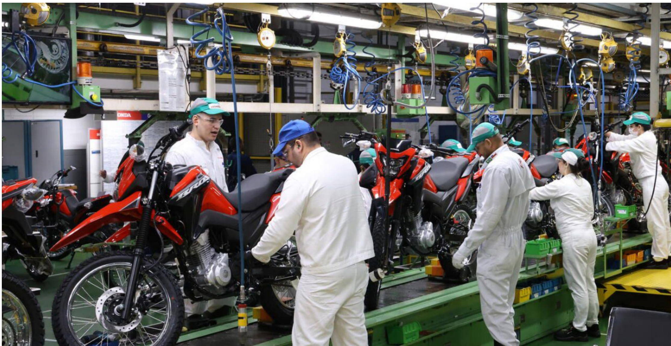
Entre janeiro e maio deste ano foram fabricadas 932.522 unidades, mais de 85,8 mil unidades a mais que no mesmo período do ano passado