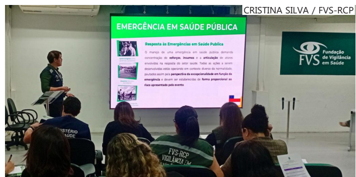
Realização da oficina-piloto de implementação da metodologia Strategic Tool for Assessing Risks (STAR)

"A ferramenta STAR fortalece a vigilância baseada em eventos no Amazonas, qualificando os processos de detecção e resposta e ampliando a articulação entre as áreas técnicas. Para o CIEVS e a FVS-RCP, essa experiência representa uma oportunidade de fortalecimento da capacidade institucional frente às emergências em saúde pública", ressaltou.