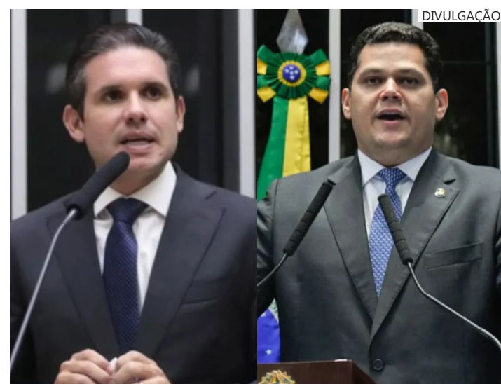
Presidente da Câmara dos Deputados, Hugo Motta (E) e o presidente do Senado, Davi Alcolumbre (D)

E que, portanto, eventuais prejuízos eleitorais não devem ocorrer, já que o assunto deverá se transformar em uma promessa eleitoral do petista para os próximos quatro anos.