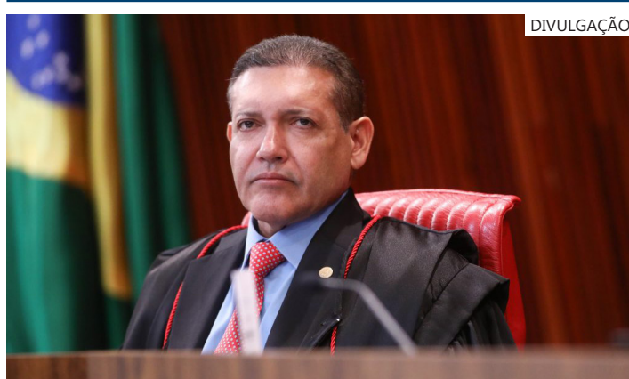
Presidente do TSE, Kassio Nunes Marques