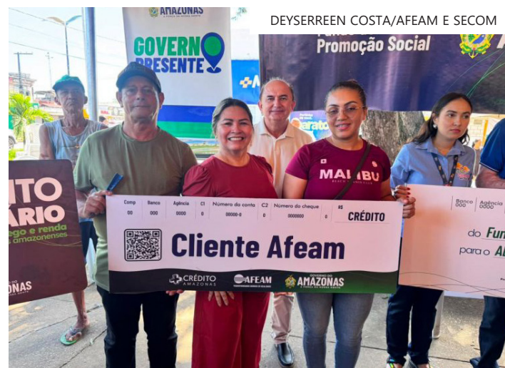
Crédito fortalece atividade econômica e amplia oportunidades de geração de renda no município

sente reforça o compromisso do Governo do Amazonas em ampliar o acesso ao crédito nos municípios. "Estamos trazendo crédito para os nossos produtores rurais e para as atividades econômicas locais. São recursos que fortalecem os negócios, impulsionam o desenvolvimento e geram emprego e renda para a população", afirmou.