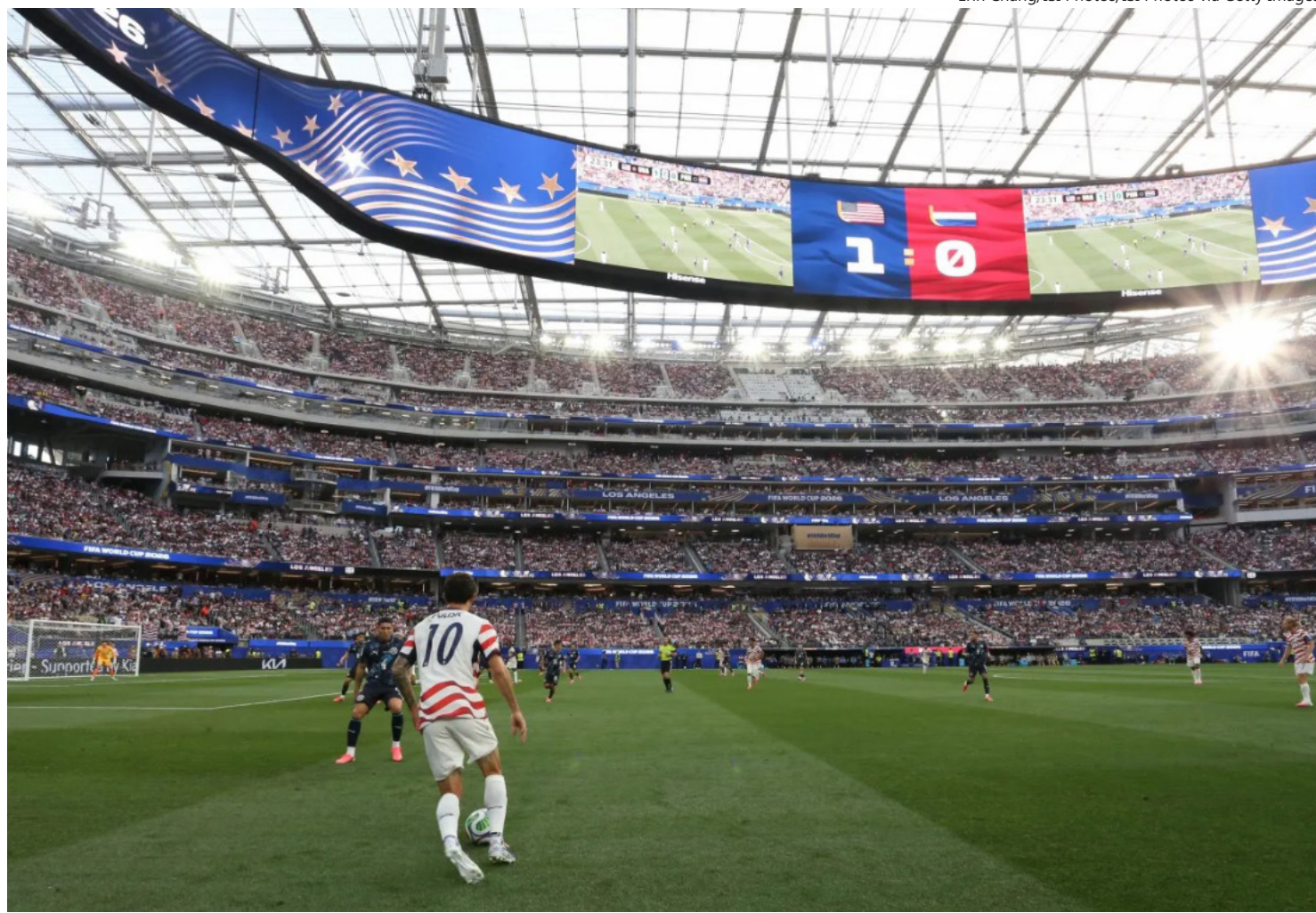
Estados Unidos x Paraguai na Copa do Mundo

A seleção paraguaia apresentou seu cartão de visitas logo no primeiro minuto de partida com um lançamento de Alderete para Sanabria. O meia Diego Gómez fina-