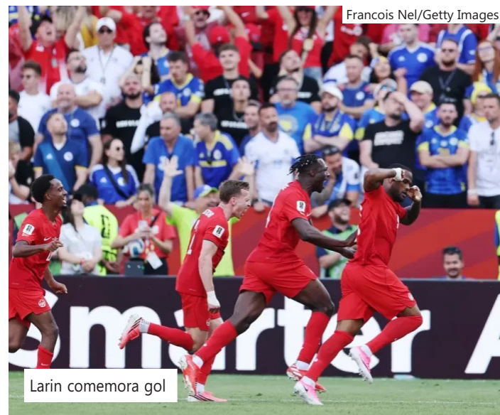
Larin comemora gol

Capitão e maior artilheiro da história da Bósnia, Dzeko levou o país à sua primeira Copa, em 2014, no Brasil, e é tratado como símbolo de união nacional no pós-guerra.