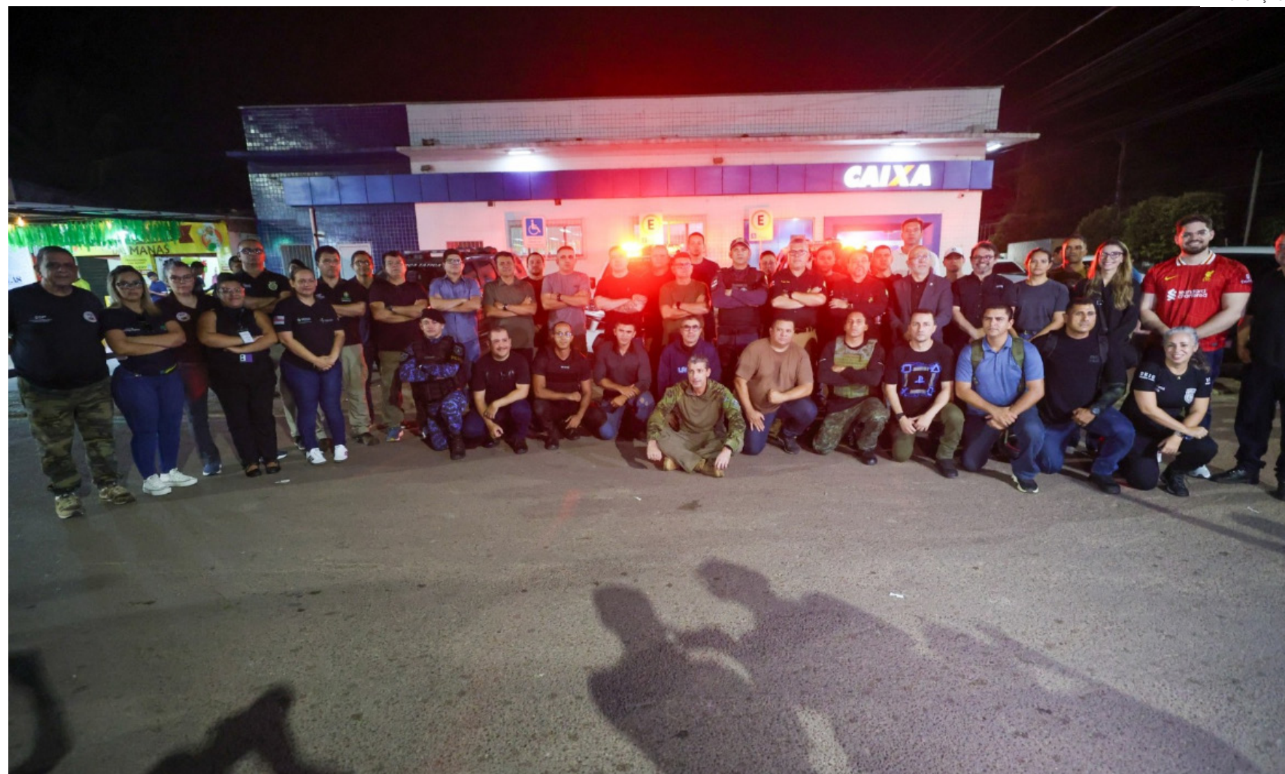
A atividade fortalece o preparo das Forças de Segurança no enfrentamento ao crime organizado

“É muito importante trazer esse conhecimento do que está acontecendo fora, aqui do nosso estado. As nossas tropas têm se empenhado cada vez mais, têm treinado para fazer frente à crimi-