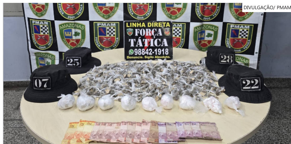
Suspeito tentou fugir ao perceber a aproximação dos policiais militares

Como parte da estrutura operacional, o Centro Integrado de Comando e Controle Local (CICC-L) será ativado na Ilha Tupinambarana para o acompanhamento em tempo real das ocorrências e das atividades relacionadas aos eventos.