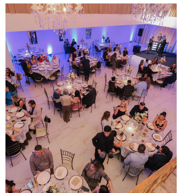
Foto do salão