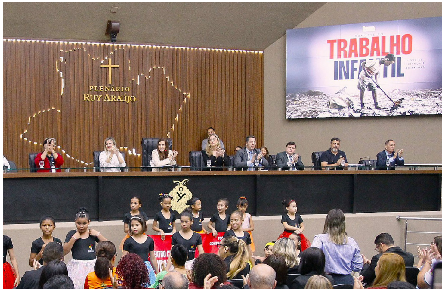
Assembleia Legislativa do Amazonas (Aleam)

Neste sentido, a Aleam aprovou a Lei nº 7.158/2024, de iniciativa do deputado