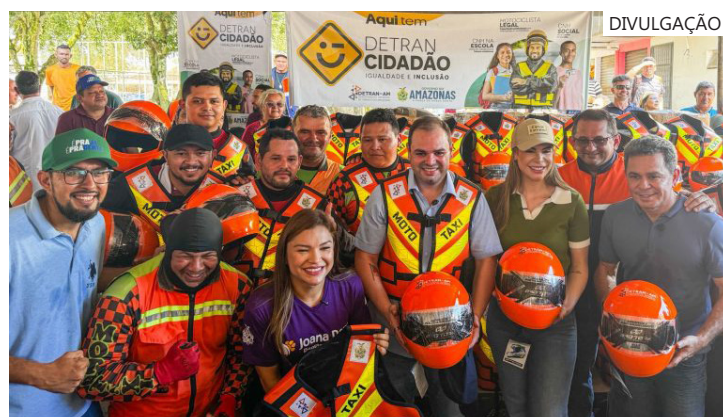
Mototaxistas do município foram contemplados com equipamentos de segurança, e a população teve acesso a serviços de veículos e CNH

Outro serviço disponível foi o de inscrição em cursos oferecidos pela Escola Pública de Trânsito (Eptran). Entre os cursos presenciais estavam disponíveis os de Direção Defensiva, para Mototaxista e para Motofretista. Também estavam disponíveis inscrições nos cursos da modalidade à distância de Direção Defensiva, Direção Defensiva para Motociclista, Monitor Escolar e Mecânica Básica.