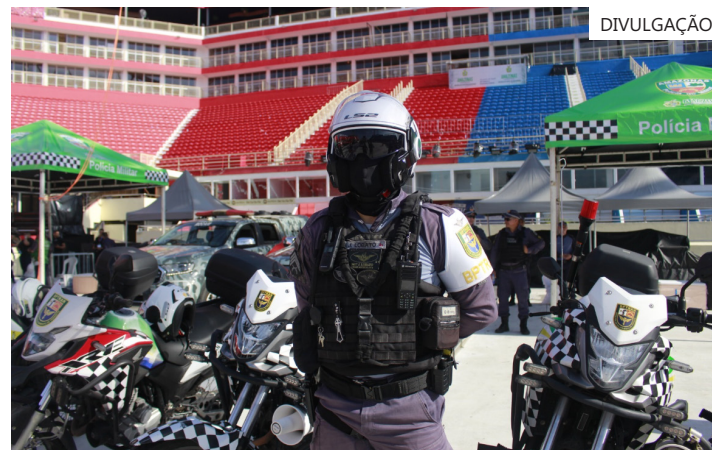
A ação vai atuar de forma integrada coordenada pela SSP-AM em áreas terrestres e fluviais durante o evento