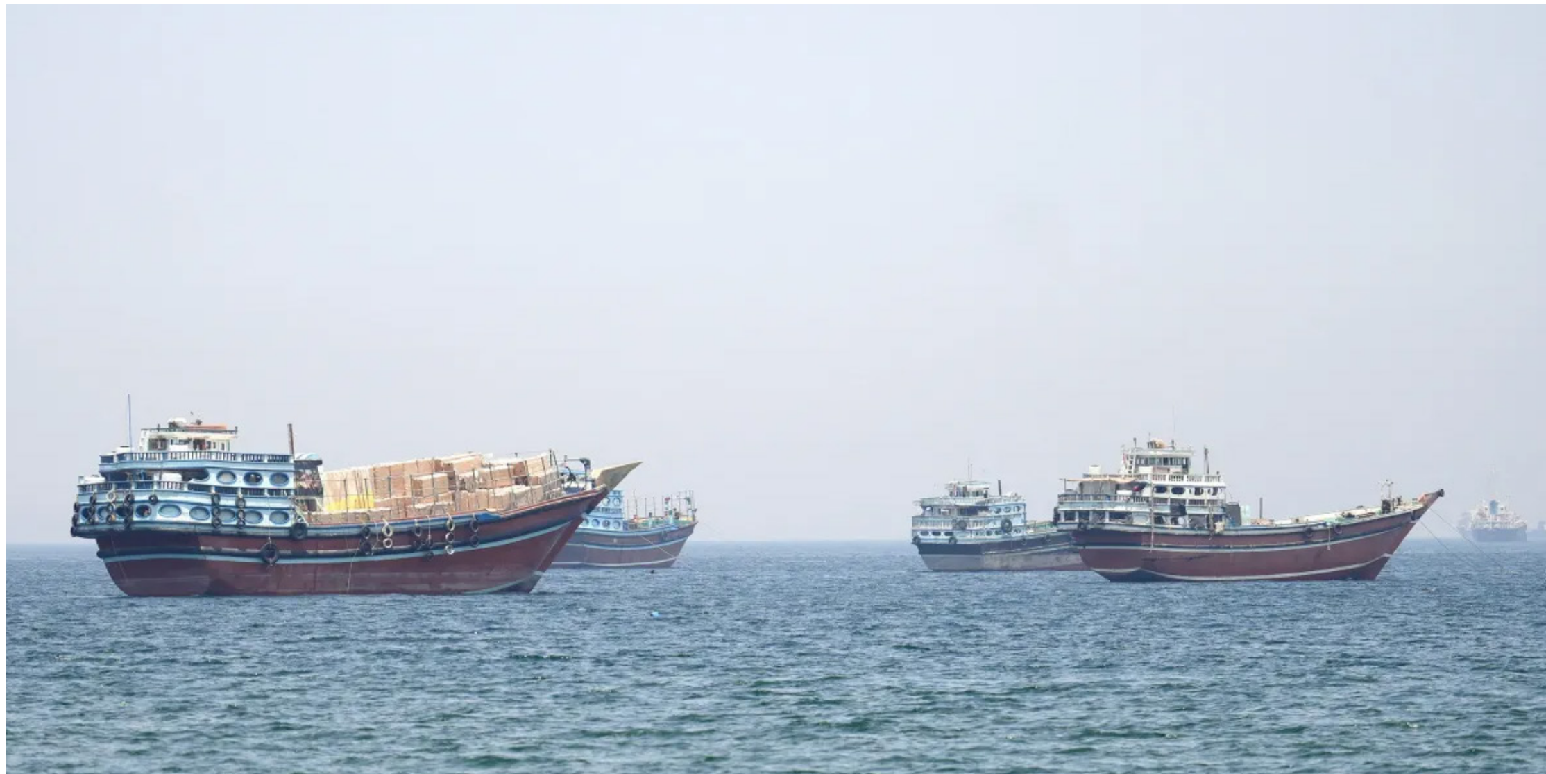
Embarcações no Estreito de Ormuz 29 de abril de 2026

Comando Central dos Estados Unidos afirmou que equipamentos buscavam interromper o tráfego marítimo comercial próximo ao estreito