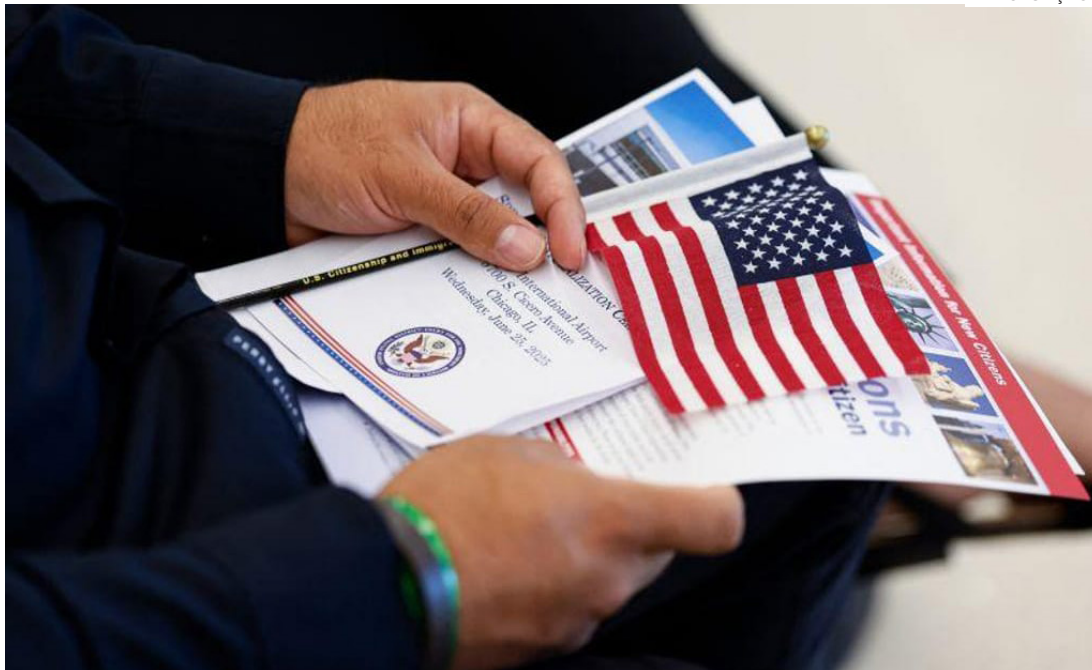
Esforços para revogar a cidadania de pessoas naturalizadas nos Estados Unidos

Em menos de dois meses, 29 processos foram apresentados; casos abertos até agora incluem pessoas acusadas de cometer fraude, abuso sexual de menor ou de ter expressado apoio ao terrorismo antes ou durante o processo de naturalização