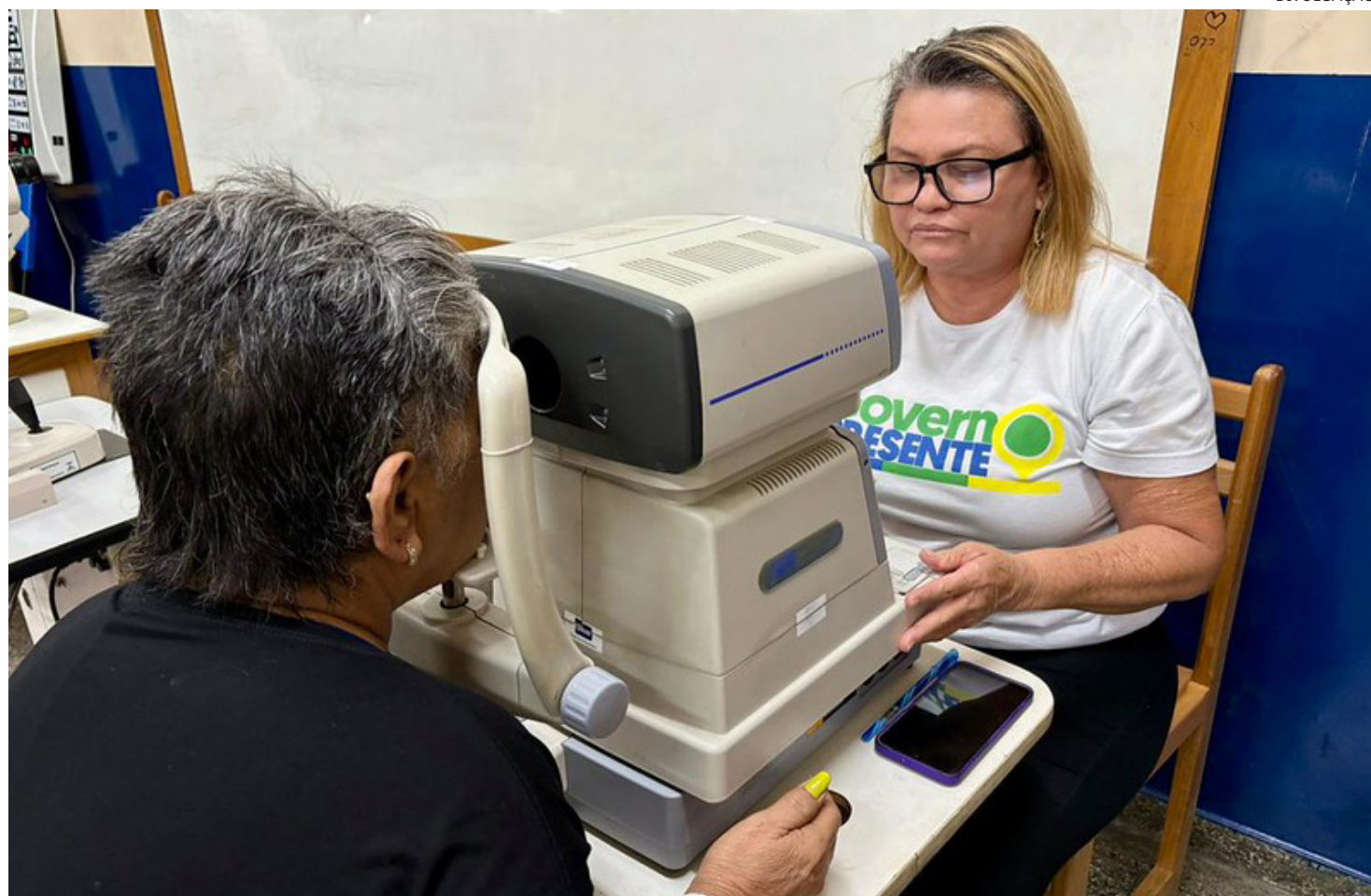
Governo Presente, na Escola Estadual Coronel Pedro Câmara (CMPM VIII)

Os moradores têm ainda acesso aos serviços de aferição da pressão arterial, testes glicêmicos, agendamento de consultas e exames pelo Sistema de Regulação, além de atendimento da Ouvidoria e ações de vigilância em saúde