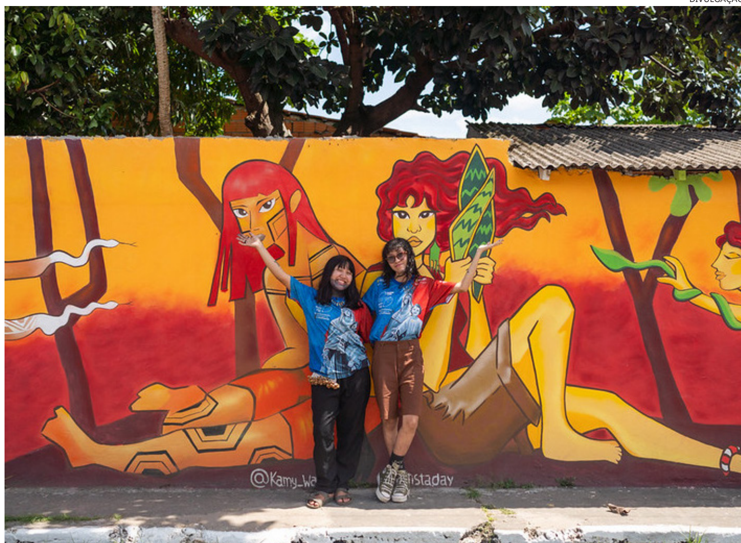
Mulheres ocupam espaço de destaque na quinta edição do projeto 'Parintins Galeria Cidade Aberta'

"Foi uma experiência muito especial. Trabalhamos com uma equipe formada por mulheres, construindo juntas um mural que fala justamente sobre os conhecimentos e ensinamentos