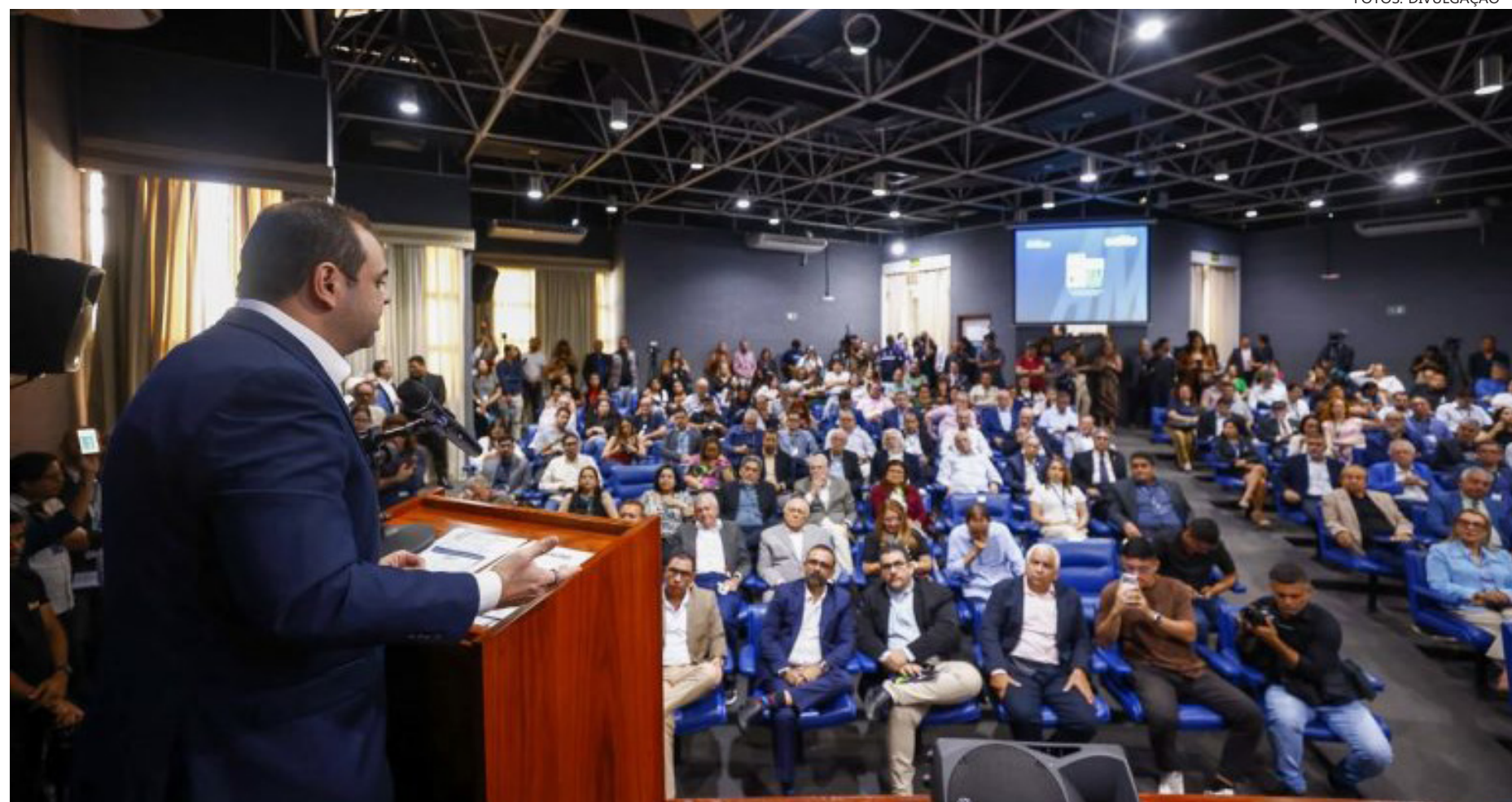
Investimentos somam R$ 2,68 bilhões e proporcionam mais de 2,6 mil novos postos de trabalho

"A aprovação desses 80 projetos pelo Codam demonstra a confiança do setor produtivo no potencial do Amazonas e no ambiente favorável que estamos construindo para novos investimentos. Estamos falando de R$ 2,68 bilhões que serão injetados na nossa economia, fortalecendo a indústria, gerando oportunidades e criando mais de 4,8 mil postos de trabalho. Cada emprego criado representa mais dignidade