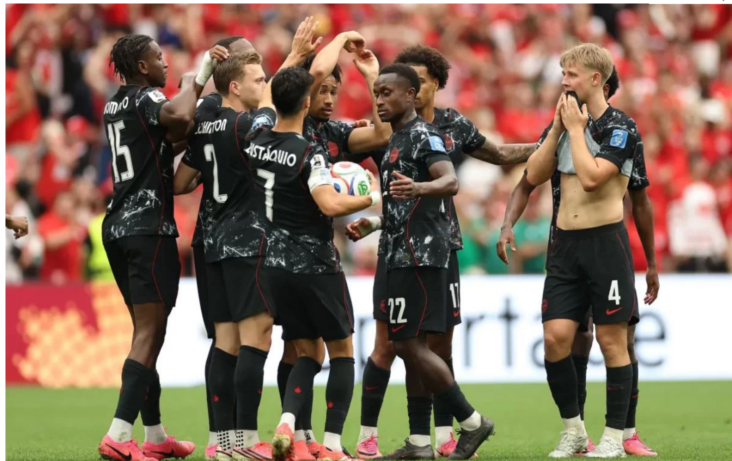
Jogo Canadá x Catar

O time canadense apertou a marcação e diminuiu os