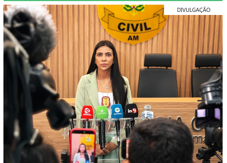
Grandes eventos concentram enorme circulação de pessoas, aumentando riscos à população infantojuvenil

uma criança ou adolescente perdido ou em situação de risco, recomendamos o acolhimento imediato e o seu encaminhamento até um posto policial ou Conselho Tutelar, garantindo que ela não fique sozinha", alertou a delegada. Conforme a autoridade policial, para os pais e responsáveis que pretendem curtir as festividades com os filhos, a recomendação é o planejamento prévio e o cuidado constante.