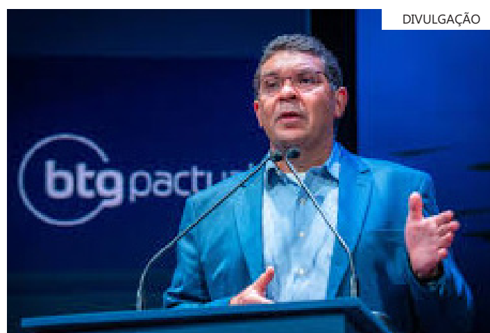
Expansão deve seguir crescimento médio anual de 2,7% dos quatro anos do governo Lula

Com um ajuste fiscal, o juro real no País poderia cair de 8% para 4%, estimulando investidores a migrarem da renda fixa para aplicações relacionadas ao financiamento de projetos.