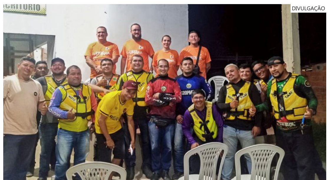
As atividades pré-festival buscam conscientizar a população sobre o trânsito seguro, e seguem até a próxima semana