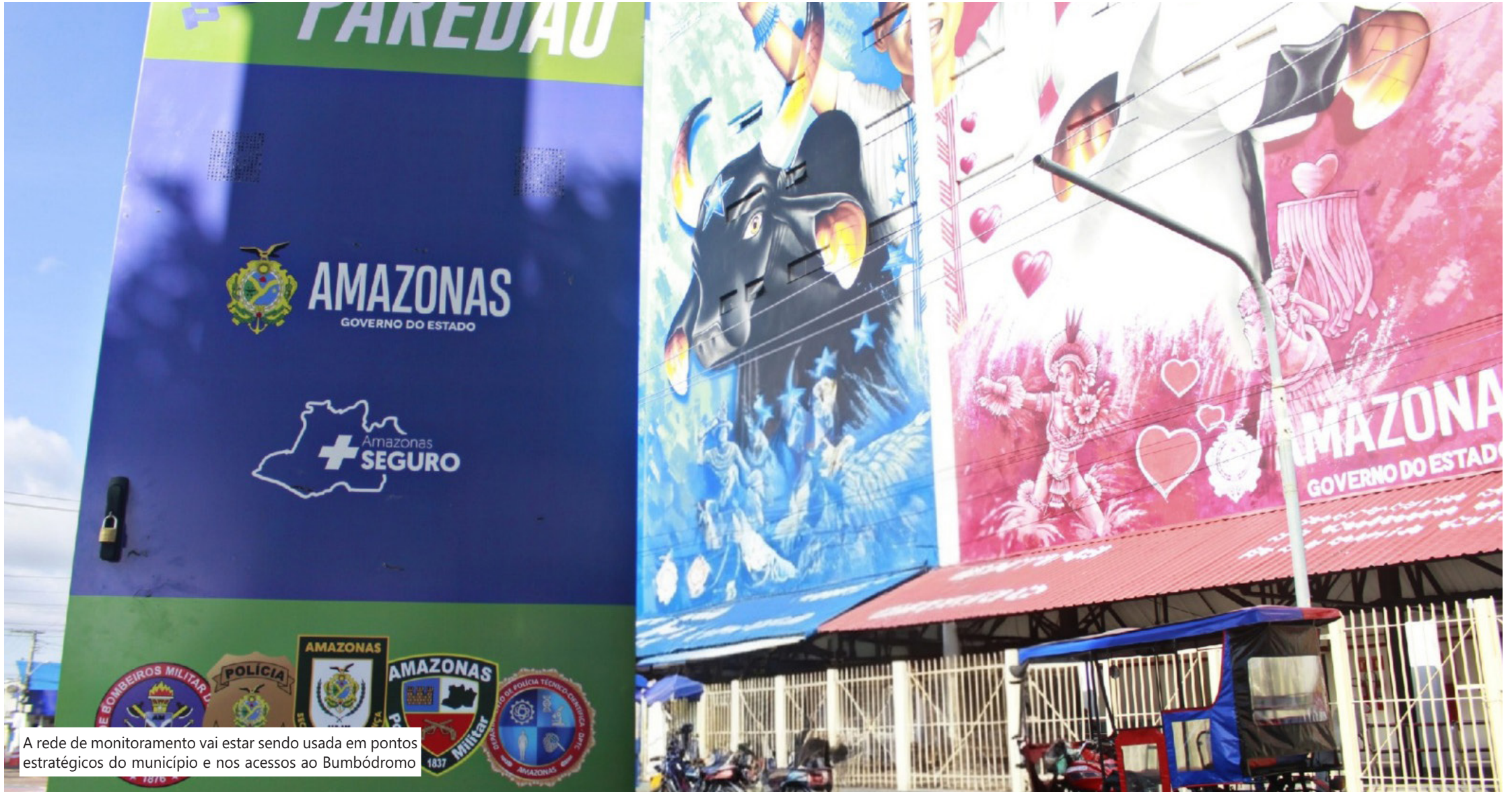
A rede de monitoramento vai estar sendo usada em pontos estratégicos do município e nos acessos ao Bumbódromo