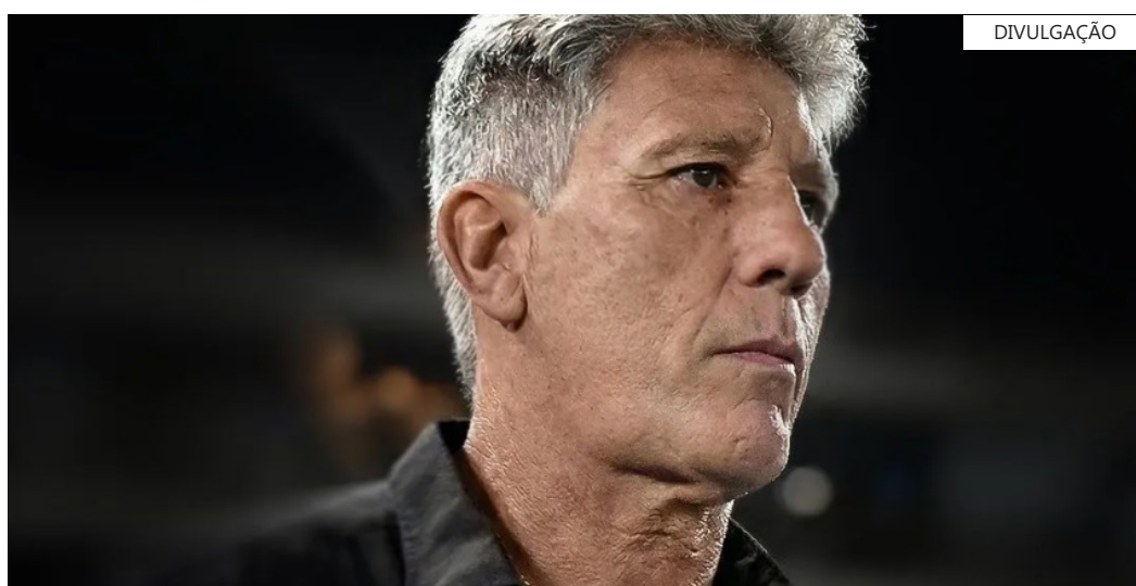
Renato Gaúcho durante partida do Vasco

“Foi uma noite lamentável. Nada saiu como planejado e, infelizmente, perdemos um jogo em casa que poderia nos colocar em uma posição melhor na tabela. Agora é continuar trabalhando e focar na classificação de quarta-feira pela Sul-Americana. Depois disso, vamos pensar no jogo de domingo,