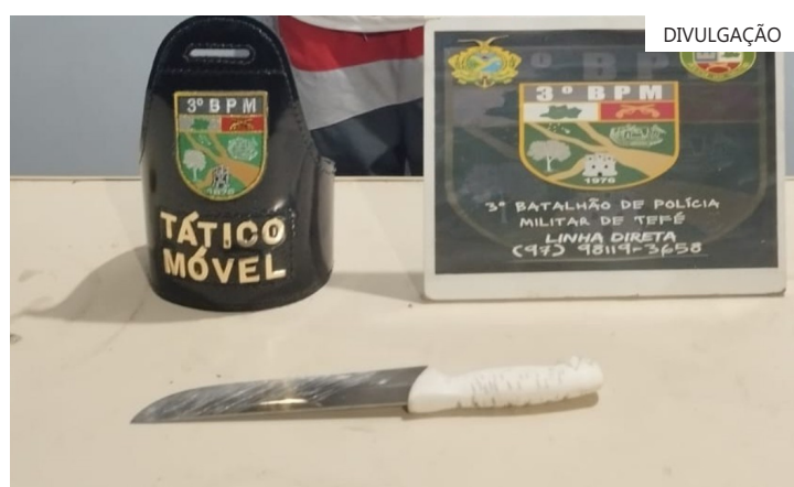
Suspeito foi encontrado escondido embaixo de uma cama na casa da tia dele

A Polícia Militar do Amazonas orienta a população a informar, imediatamente, ao tomar conhecimento da ação criminosa, por meio do disque denúncia 190. A identidade do denunciante será mantida em sigilo.