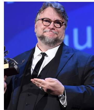
Guillermo del Toro venceu o Leão de Ouro no Festival de Veneza de 2017 por "A Forma da Água"