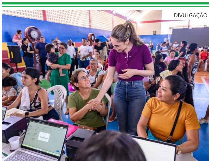
Moradores atendidos na Escola Estadual Coronel Pedro Câmara

Durante a agenda, a primeira-dama Thaisa Cidade acompanhou os atendimentos e conversou com moradores beneficiados pela ação. Para ela, a iniciativa fortalece a presença do Governo do Estado nas comunidades e facilita o acesso da população aos serviços públicos.