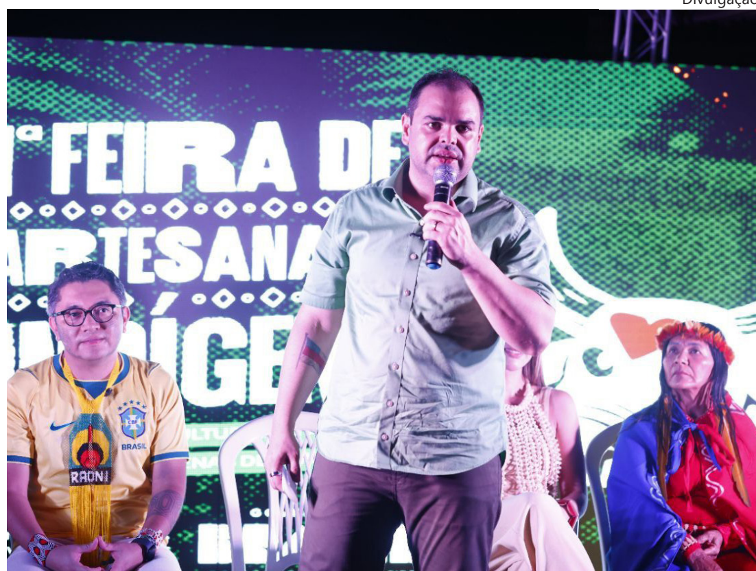
O governador entregou a revitalização do Aeroporto Júlio Belém, uma das principais portas de entrada do Festival de Parintins

No aeroporto, as intervenções tiveram como foco oferecer mais conforto, seguran-