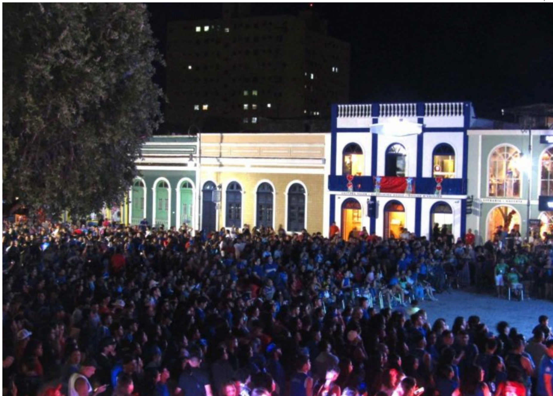
A programação é gratuita e aberta ao público

Evento oferece ao público a oportunidade de acompanhar o espetáculo dos bois-bumbás e sentir, em Manaus, a emoção que toma conta do Bumbódromo