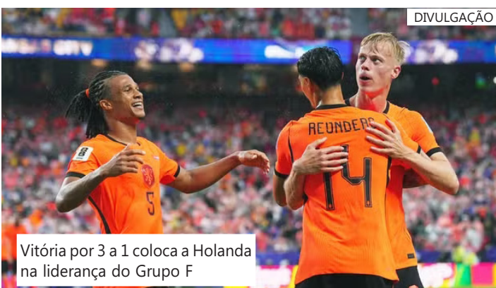
Vitória por 3 a 1 coloca a Holanda na liderança do Grupo F

A Suécia empatou, deixando a decisão das posições ainda mais emocionante.