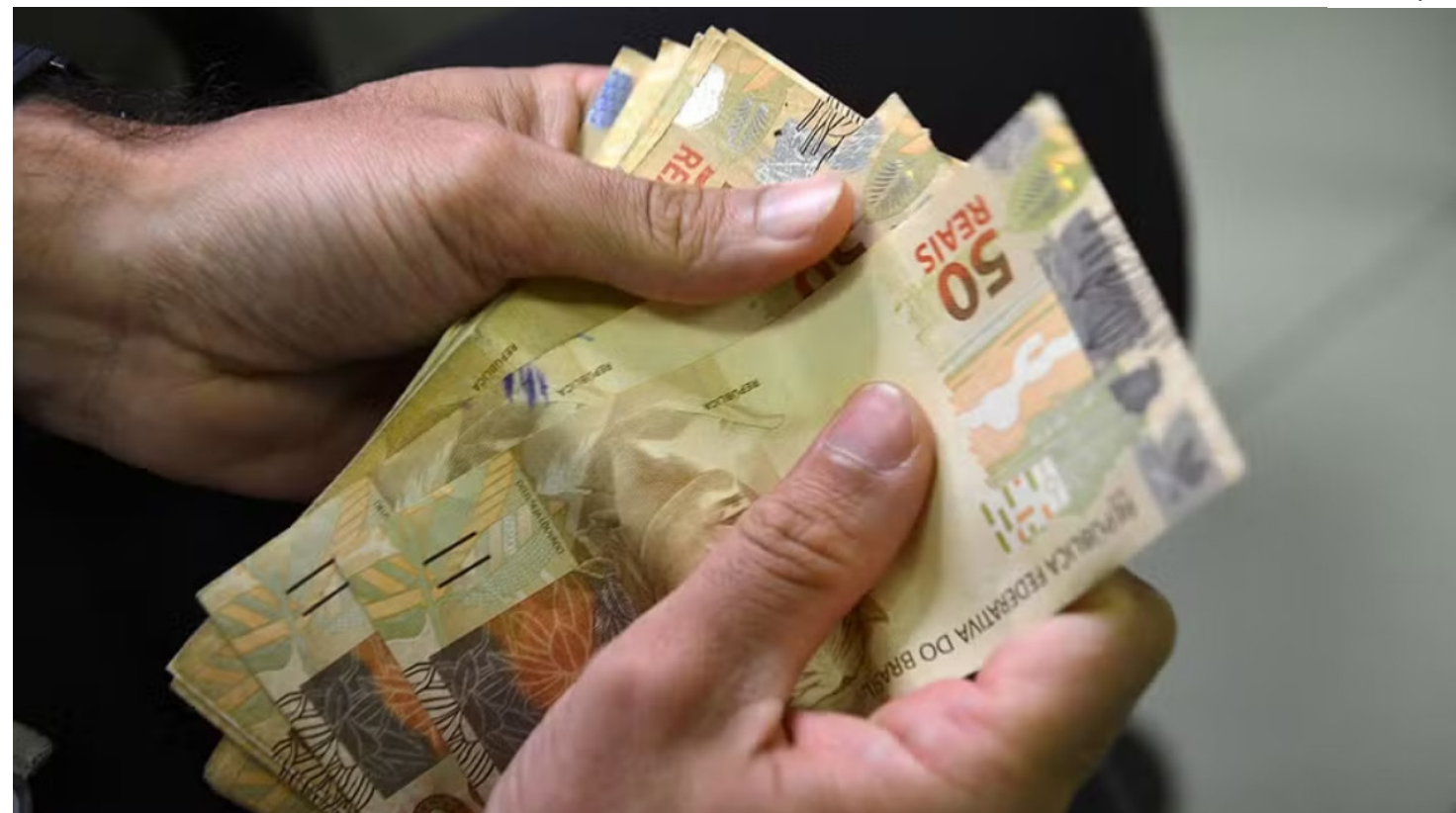
Os dados são do relatório de Estatísticas do Cadastro Central de Empresas

pregam no Brasil também está entre os que pagam os menores salários médios, segundo o relatório de Estatísticas do Cadastro Central de Empresas (CEMPRE), divulgado nesta quinta-feira (24) pelo Instituto Brasileiro de Geografia e Estatística (IBGE).