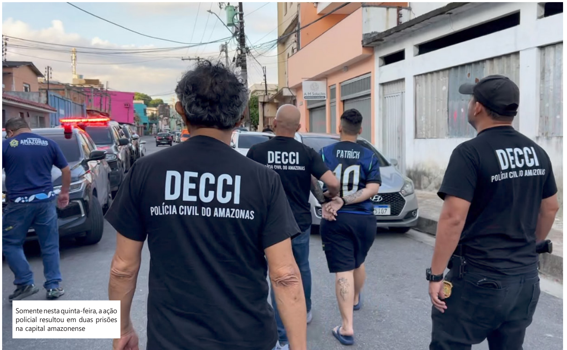
Somente nesta quinta-feira, a ação policial resultou em duas prisões na capital amazonense

Em todo o estado, foram registrados 115 BOs, instaurados 52 Inquéritos Policiais (IPs) e concluídos 20 procedimentos com autoria identificada. Também foram solicitadas dez medidas protetivas e representadas dez medidas cautelares. No âmbito repressivo, três pessoas foram