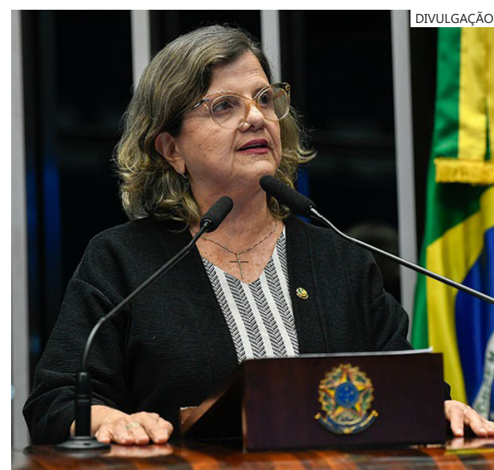
Senadora Teresa Leitão (PT-PE)