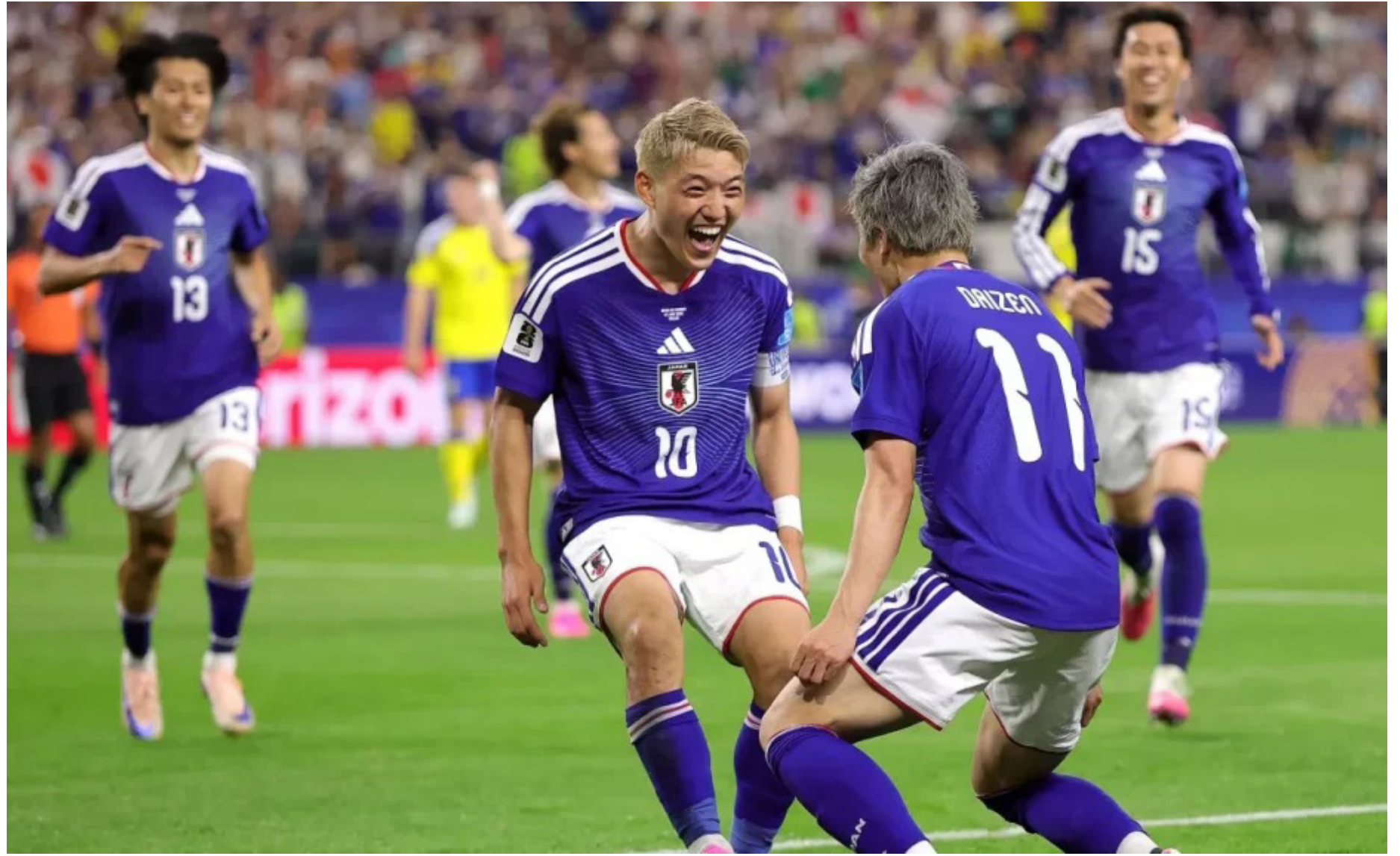
Jogadores do Japão celebrando o gol marcado diante da Suécia, pela Copa do Mundo