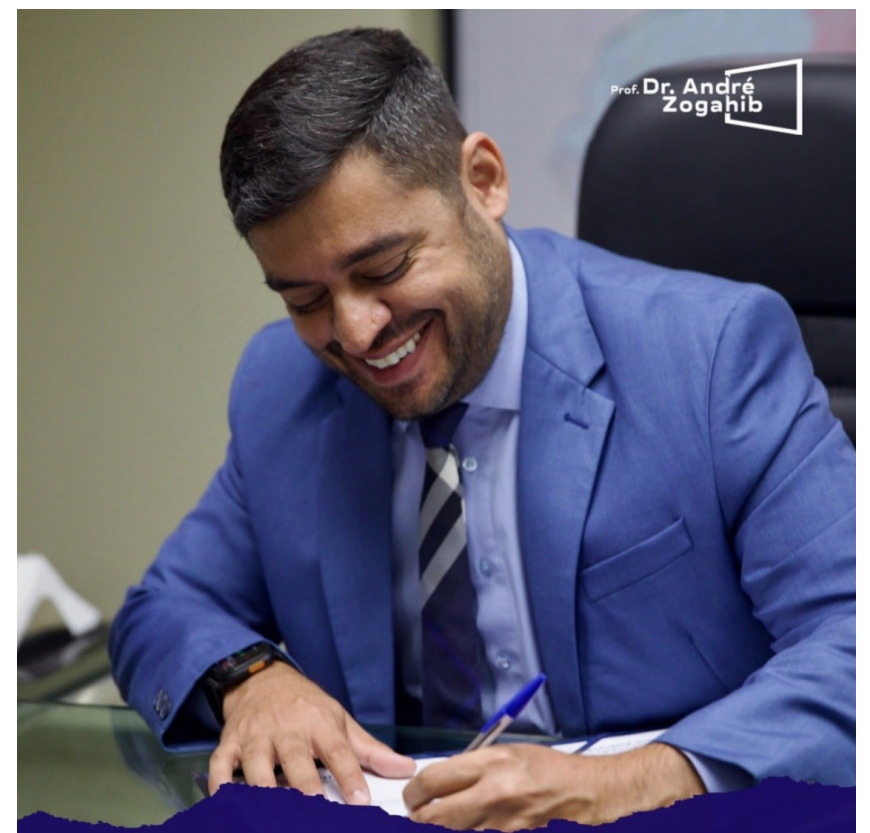
O reitor da UEA, André Zogahib assinando importantes convênios para a Universidade do Estado do Amazonas, com sua brilhante atuação

. A próxima edição do Bossa Nossa acontece na segunda-feira, dia 29 de junho, reafirmando a proposta do projeto de celebrar a música brasileira, promover encontros afetivos e valorizar a produção artística amazonense em uma experiência que integra música, artes visuais, gastronomia e convivência. A atração principal da noite será o grupo Amigos da Boemia, coletivo musical que completa duas décadas de trajetória e se consolidou como uma das referências da resistência cultural e da boemia tradicional manauara. Os drinques são um charme à parte. Vale conferir!