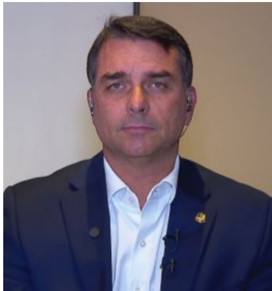
Senador Flávio Bolsonaro (PL-RJ) e ex-primeira-dama Michelle Bolsonaro (PL)

“De coração aberto, quero reforçar o convite que já havia feito à Michelle.