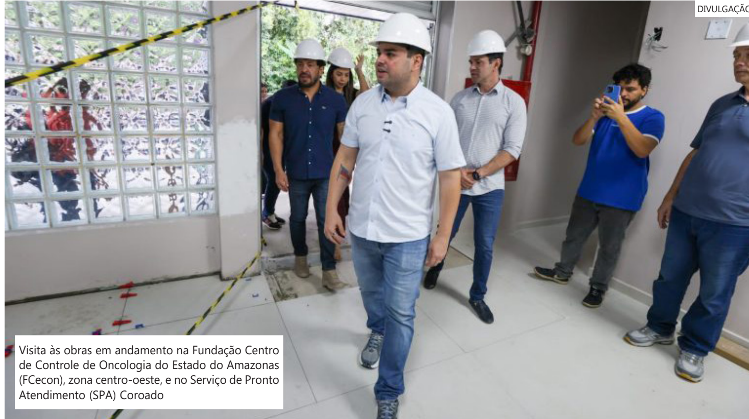
Visita às obras em andamento na Fundação Centro de Controle de Oncologia do Estado do Amazonas (FCecon), zona centro-oeste, e no Serviço de Pronto Atendimento (SPA) Coroado

“Vamos melhorar muito o conforto, o atendimento dos pacientes que precisamos e estou vindo in loco visitar todas as obras para que a gente possa dar celeridade e entregar o mais rápido possível. Vou seguir fazendo outras visitas para que a gente possa melhorar a estrutura de atendimento de saúde, não só para Manaus, mas também para todo o estado do Amazonas. Estamos em