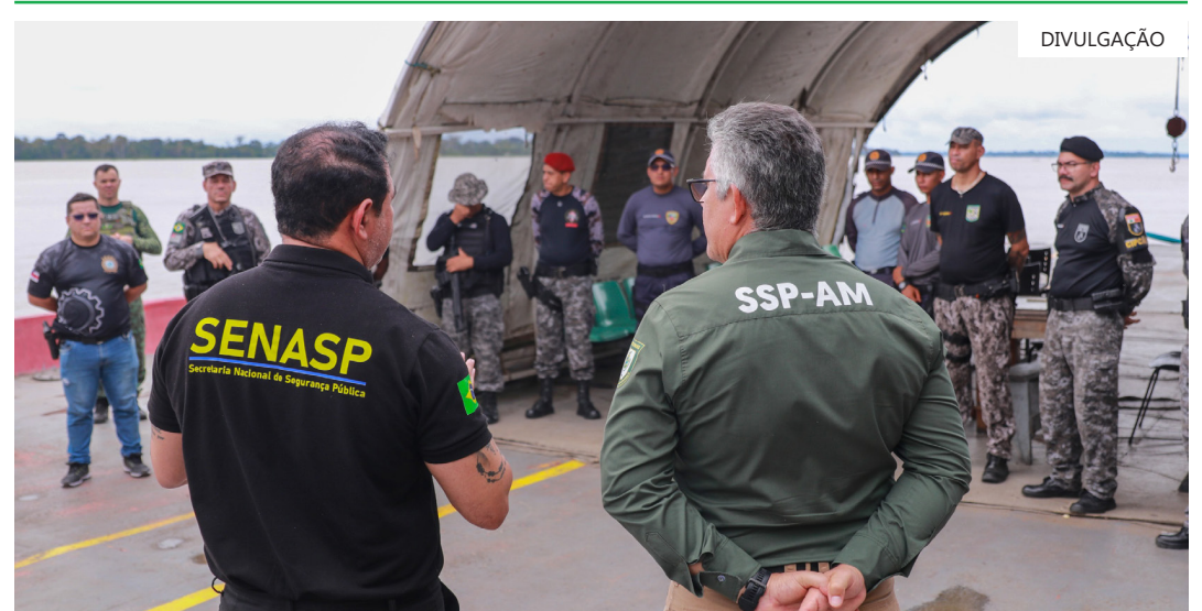
A comitiva esteve nos municípios de Tabatinga, Benjamin Constant e Coari, a previsão é buscar fortalecer o apoio do Governo Federal

Aqui em Tabatinga, colocamos, ainda, uma lancha blindada para enfrentar essa criminalidade", lembrou o secretário.