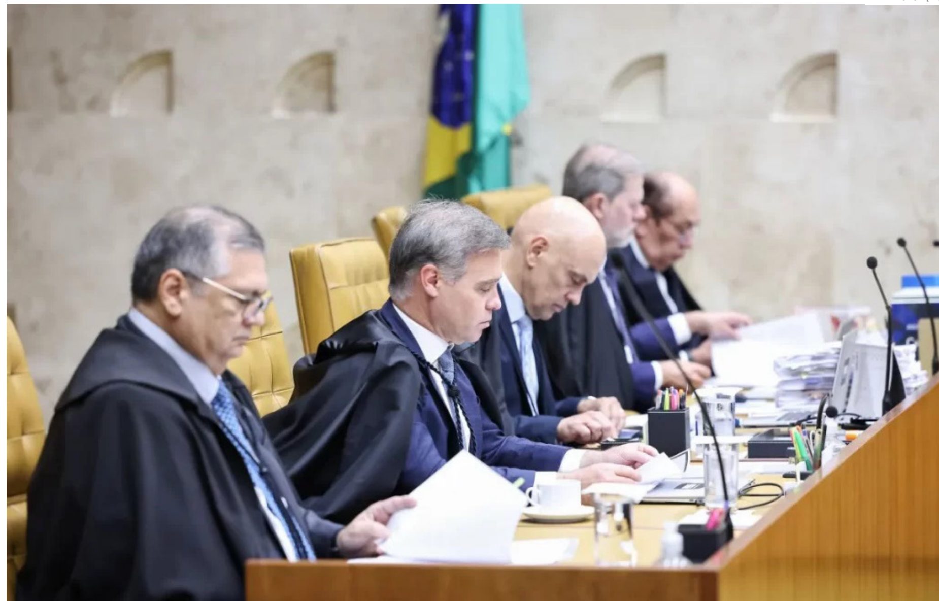
Supremo Tribunal Federal (STF)

Reservadamente, as grandes empresas de tecnologia desconfiam de uma "ação casada" entre a publicação dos decretos presidenciais e