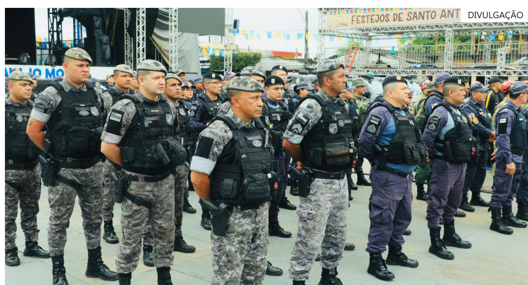
Policiais militares foram enviados para o município no sábado e vão garantir a ordem na Festa de Santo Antônio de Borba

Os policiais militares vão atuar de forma preventiva para preservar a ordem pública, além de patrulhamento ostensivo e atuação em grandes ocorrências e gerenciamento de crise no tradicional evento que, neste ano, vai realizar uma programação inédita com shows nacionais.