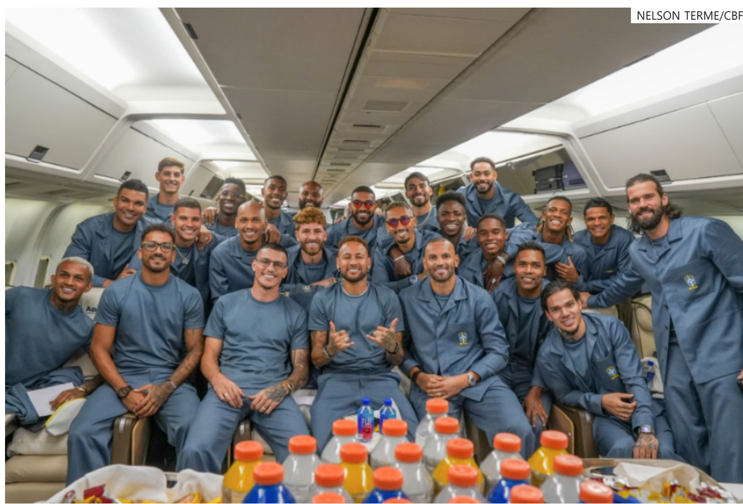
Seleção Brasileira embarcou para os Estados Unidos

A delegação brasileira deixará o Rio de Janeiro