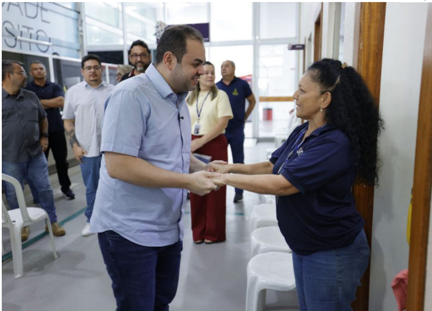
Pacote de medidas voltado à valorização dos servidores do Departamento Estadual de Trânsito do Amazonas (Detran-AM)