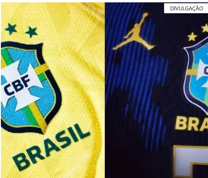
Novas camisas da Seleção brasileira de futebol para a Copa 2026

Antes da estreia no Mundial, a Seleção ainda fará um último teste. O time enfrenta o Egito no dia 6 de junho, em Cleveland, em amistoso preparatório para a competição.