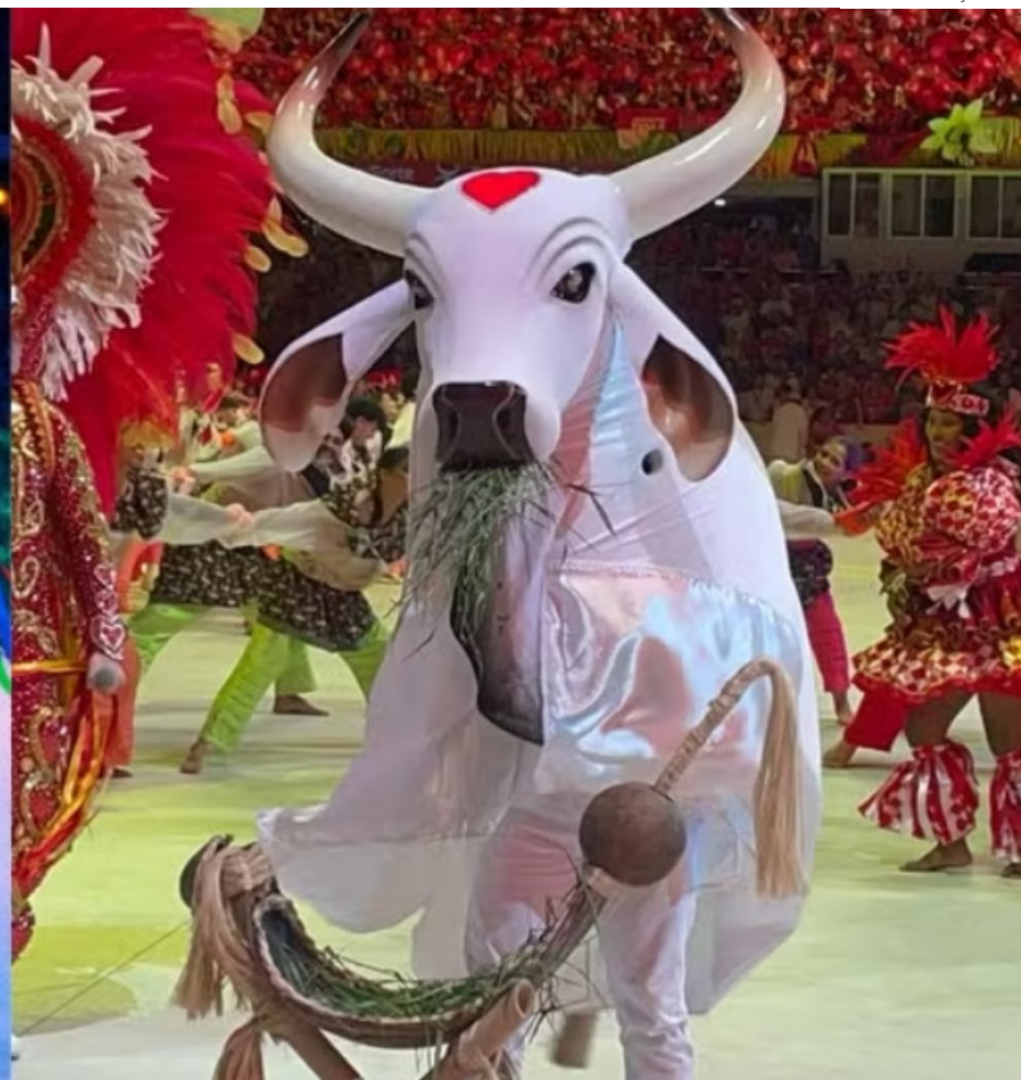
Caprichoso e Garantido na última noite do Festival de Parintins

so para este ano, revelou que a inspiração para a obra nasceu de suas próprias memórias e da relação de suas filhas com o bumbá azul e branco. Para o músico, o maior desafio foi equilibrar a grandiosidade do espetáculo atual com a simplicidade do boi de rua.