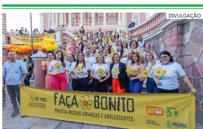
Ações foram realizadas em Manaus e em municípios do interior do estado

As ações de abordagem, orientação e fiscalização realizadas pela Sejusc alcançaram 2.208 pessoas, sendo 1.965 na capital, em ações durante a Temporada dos Bumbás, Operação Caminhos Seguros, Missa de Pentecostes e Norte Bumbás 2026. E 243 pessoas no interior, nas ações realizadas em escolas, unidades de saúde e empresas, desenvolvidas nos municípios de Itapiranga, Silves e Itacoatiara.