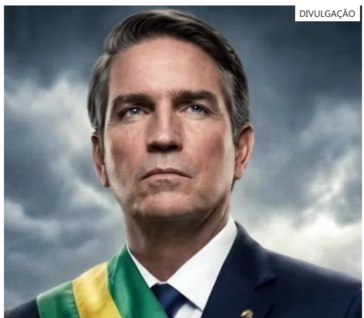
Jim Caviezel interpreta Jair Bolsonaro em filme chamado "Dark Horse"

Agestão do prefeito Ricardo Nunes também nega irregularidades no contrato do programa Wi-Fi Livre Comunidades, alvo da Operação Wi-Fi Livre. Fontes do alto escalão da Prefeitura de São Paulo afirmaram que a administração municipal contesta os principais pontos que embasam a investigação e sustenta que o serviço contratado está sendo efetivamente prestado.