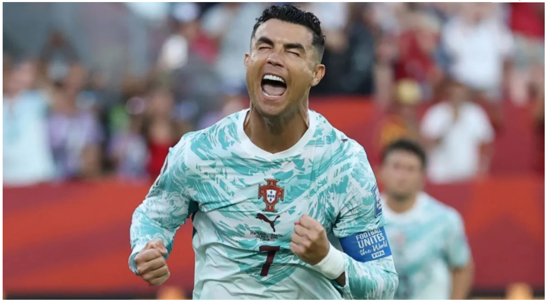
Cristiano Ronaldo marca pela primeira vez em mata-mata de Copa do Mundo

da pausa para a hidratação, o time croata colocou a bola no chão e começou a trocar passes em busca de uma boa infiltração na defesa portuguesa. Mas o lapso durou pouco. Rapidamente, Portugal retomou as ações defensivas.