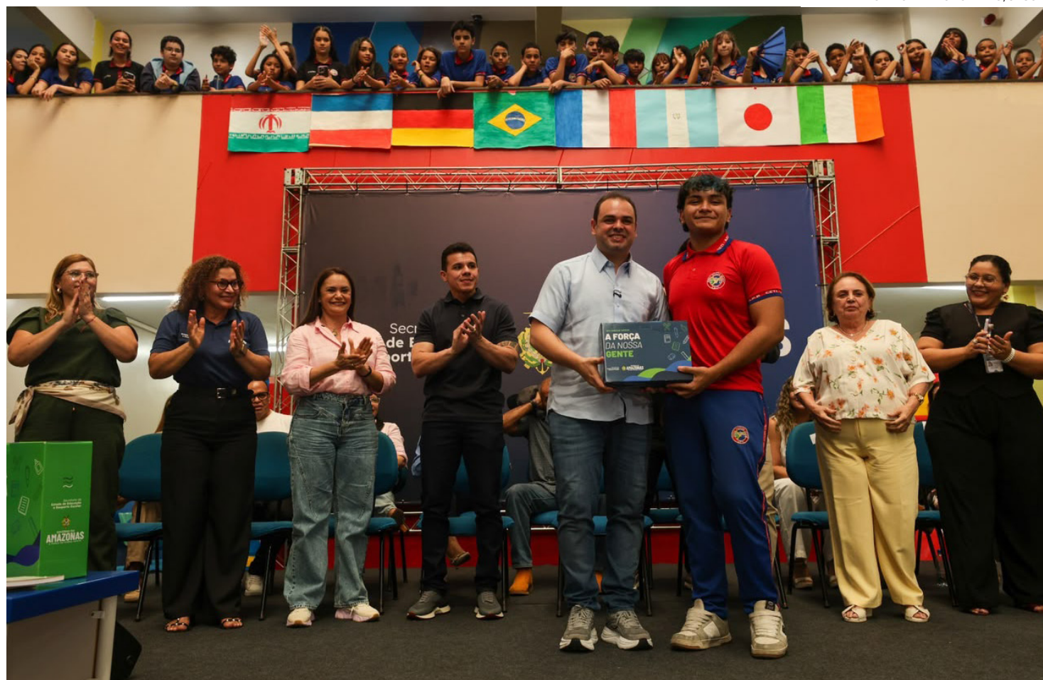
Entrega de mais de 800 kits escolares para estudantes do ensino fundamental e médio do Centro de Educação de Tempo Integral (Ceti) Áurea Pinheiro Braga

A ação integra um pacote de investimentos do Governo do Amazonas para o fortalecimento da educação pública estadual. As medidas preveem a destinação de 399 mil kits escolares para estudantes, 36 mil kits para professores, a retomada da entrega de fardamentos e materiais escolares, melhorias na infraestrutura das unidades de ensino, aquisição de equipamentos e a realização do maior concurso público da história da rede estadual.