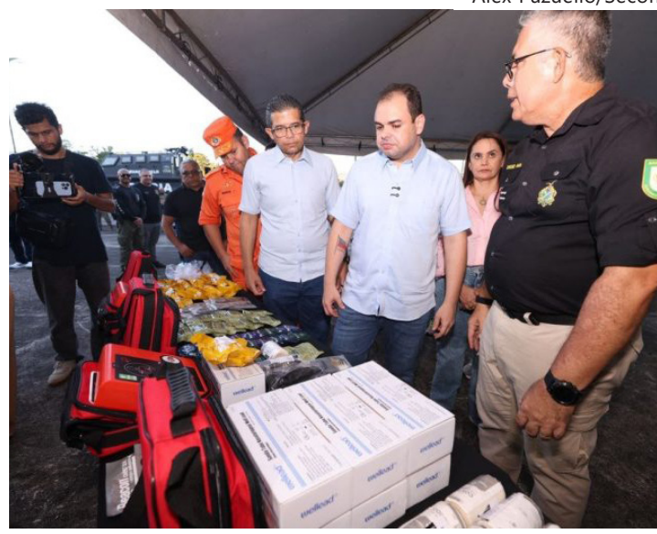
Investimento de R$ 9,1 milhões fortalece a atuação das Forças de Segurança

Além do reforço operacional, o Governo do Amazonas investe na proteção e no suporte às equipes que atuam na