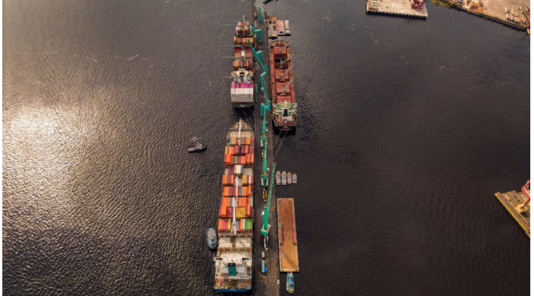
O empreendimento contará com investimento de R$ 9 milhões e aproximadamente 4,7 quilômetros de extensão