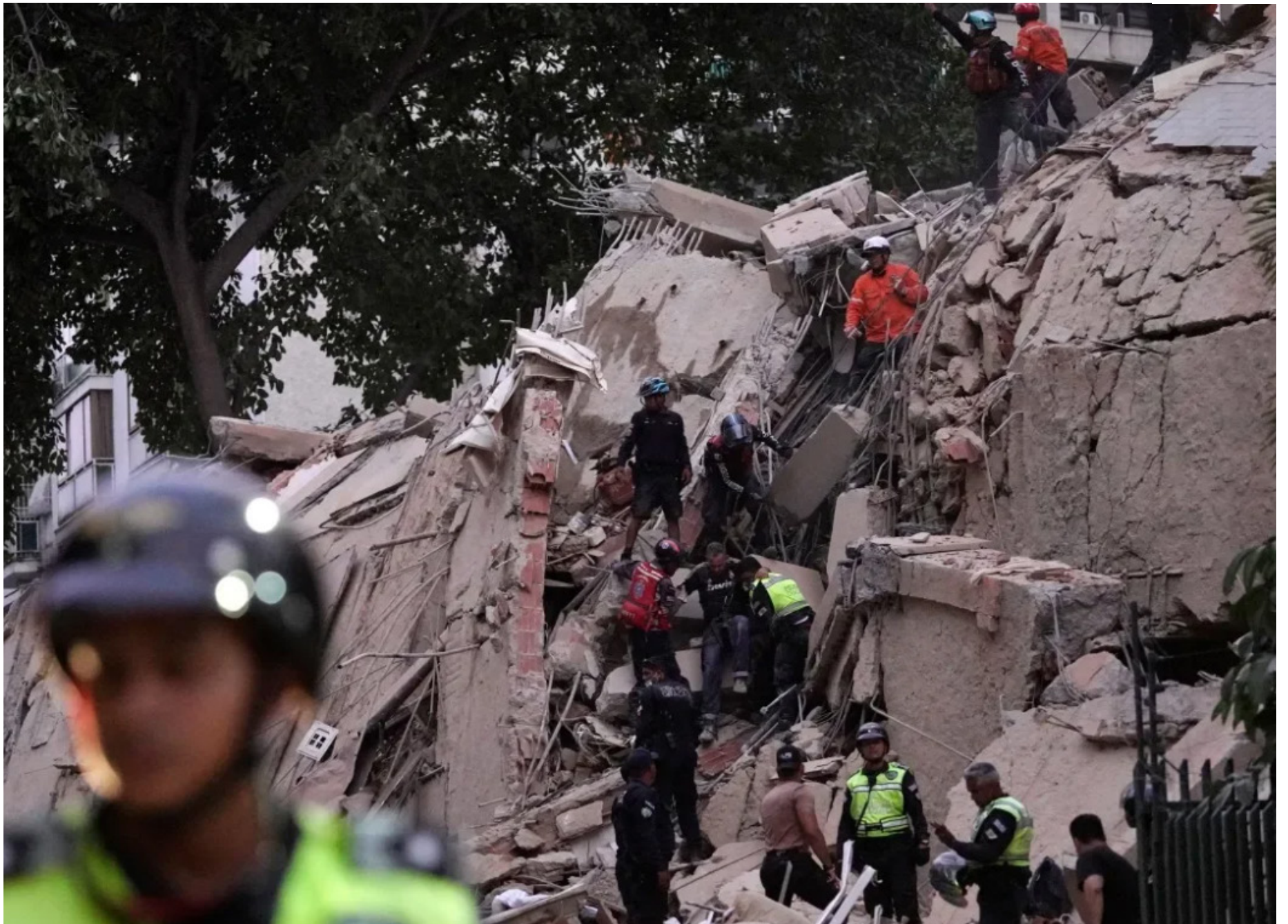
“Janela de ouro” para conseguir encontrar vítimas ainda vivas diminui a cada dia, mas resgates ainda são realizados

risco, não pode haver obstáculos. A prioridade deve ser salvar vidas, auxiliar as vítimas e apoiar aqueles que realizam o trabalho mais árduo”, destacou a organização.