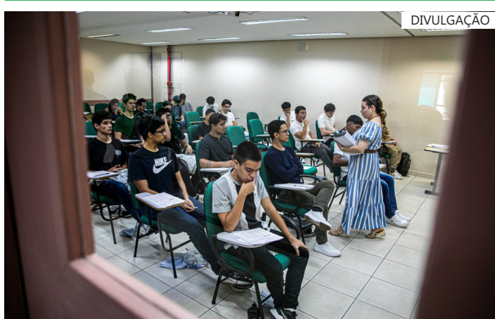
Do total de vagas, 2.648 são destinadas ao SIS e 1.764 ao Vestibular

“Convidamos todos os candidatos a realizarem suas inscrições e a lerem o edital com atenção. Neste ano, a UEA também disponibiliza o Guia do Candidato, um material com as principais informações sobre o processo seletivo, elaborado para auxiliar os participantes durante toda a seleção. O guia estará disponível em português, inglês, espanhol e francês, ampliando o acesso às informações, especialmente para os candidatos às vagas destinadas a imigrantes em condição de vulnerabilidade. Desejo boa sorte a todos os candidatos”, afirmou o reitor.