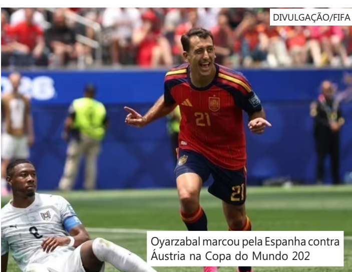
Oyarzabal marcou pela Espanha contra Áustria na Copa do Mundo 202

Para concretizar a vaga, Cucurella foi acionado na esquerda e encontrou Oyarzabal com lindo passe. O atacante bateu de primeira para vencer o goleiro com tranquilidade.