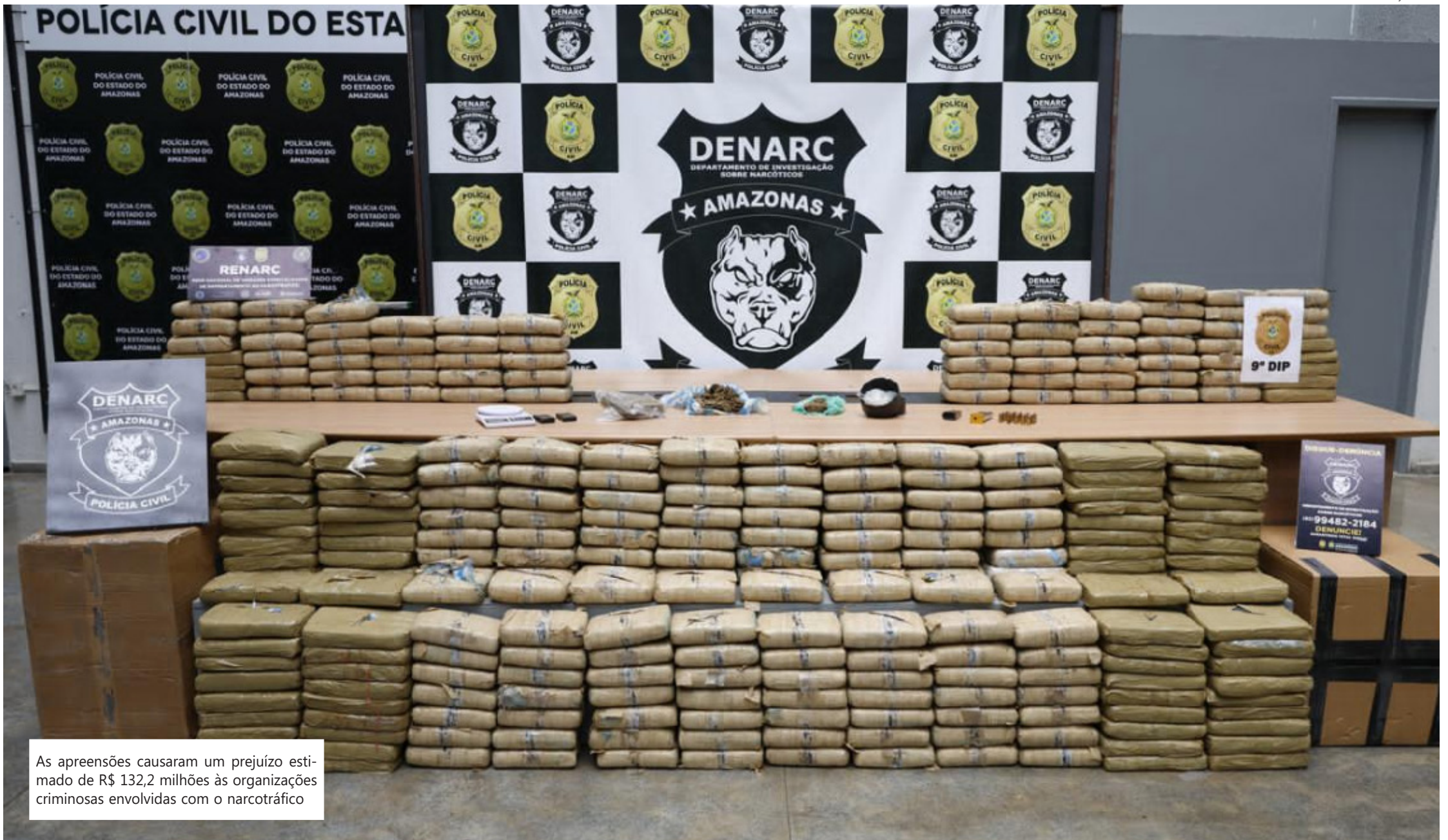
As apreensões causaram um prejuízo estimado de R$ 132,2 milhões às organizações criminosas envolvidas com o narcotráfico