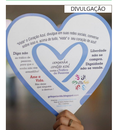
Prevenção ao Tráfico Humano no Amazonas

“Nosso alerta para a população, sobretudo entre os mais jovens, é desconfiar de propostas de trabalho fácil com grande retorno financeiro no exterior. Muitas vezes, o que parecia ser um sonho pode ser um grande pesadelo”, destacou a secretária da Sejusc.