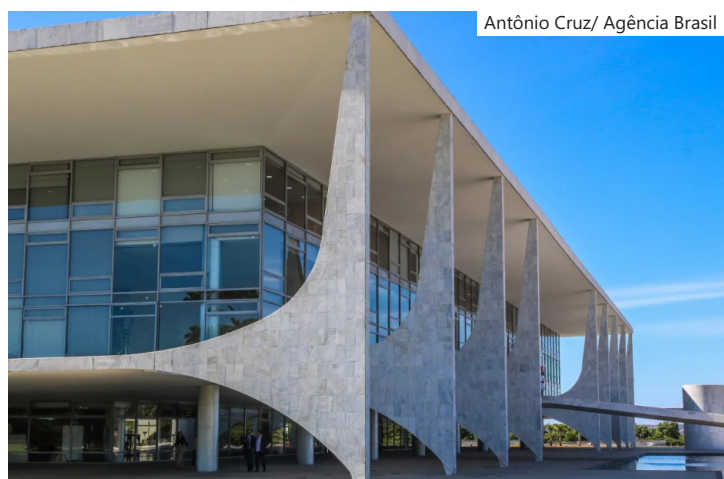
Fachada do Palácio do Planalto em Brasília

Antes da decisão definitiva da PGR, Vorcaro esperava a substituição de um dos advogados responsáveis pelas negociações na tentativa de destravar o acordo. Ainda assim, a Procuradoria sinalizou que não pretende reabrir as tratativas nas condições atuais.