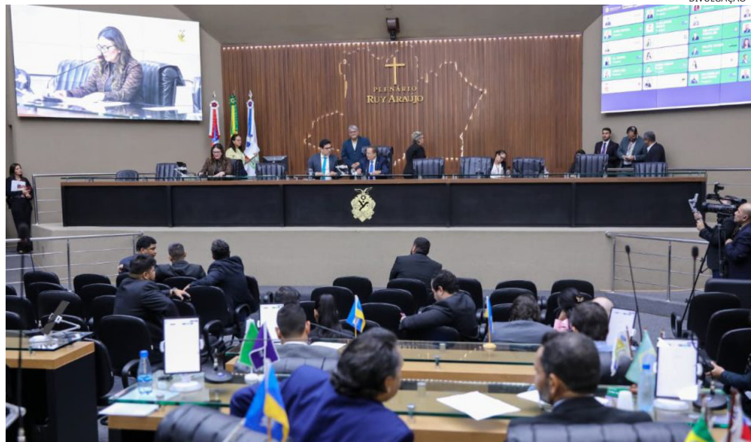
Assembleia Legislativa do Amazonas (Aleam)

A iniciativa busca combater o assédio, garantir canais rápidos de denúncia em embarcações e ônibus e promover o acolhimento imediato das vítimas du-